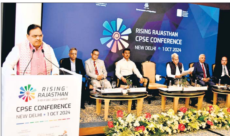
मुख्यमंत्री भजनलाल शर्मा ने राइजिंग राजस्थान ग्लोबल इन्वैस्टमेंट समिट 2024 के तहत नई दिल्ली में आयोजित कॉनक्लेव में केन्द्रीय सार्वजनिक क्षेत्र के उपक्रमों के वरिष्ठ अधिकारियों को संबोधित किया।

राइजिंग राजस्थान समिट के तहत आयोजित इस कॉनक्लेव में सार्वजनिक क्षेत्र के उपक्रमों के वरिष्ठ अधिकारियों ने भाग लिया