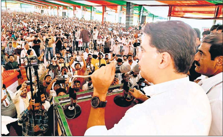
कांग्रेस महासचिव सचिन पायलट 30 सितम्बर से हरियाणा के चुनाव प्रचार अभियान पर हैं। आज उन्होंने कई जनसभाओं को संबोधित किया। वे 2 और 3 अक्टूबर को भी हरियाणा में ही रहेंगे।

सचिन पायलट ने कहा कि जनता ने भाजपा को बता दिया कि घमंड व अहंकार से राज नहीं कर सकते