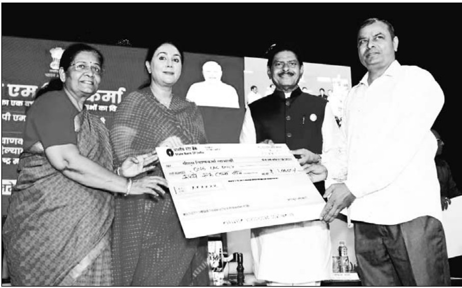
उपमुख्यमंत्री दिया कुमारी ने जयपुर के झालाना स्थित राजस्थान इंटरनेशनल सेंटर के ऑडिटोरियम में आयोजित कार्यक्रम में विश्वकर्माओं को कौशल प्रमाण पत्र एवं अन्य लाभ वितरित किये।

दिया कुमारी ने कहा कि प्रधानमंत्री के विजन अनुसार इस योजना की शानदार सफलता का एक साल पूरा होना गर्व का विषय है। 18 पारम्परिक कलाओं से जुड़े कारीगरों और शिल्पकारों को आगे बढ़ने का अवसर मिला है। यह समारोह इस योजना की सफलता की कहानी बता रहा है। हाथ के कारीगरों, हुनरमंद कलाकारों के लिए योजना वरदान साबित हो रही है। छोटे स्तर पर काम करने वाले इन कारीगरों