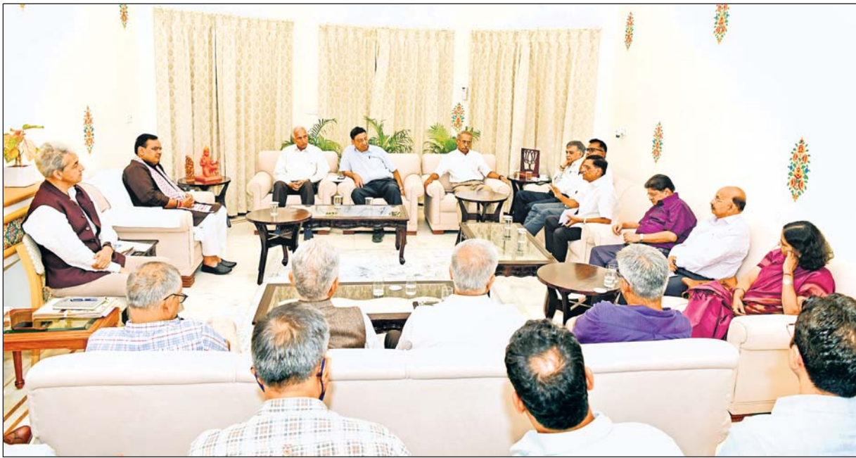
मुख्यमंत्री भजनलाल ने राइजिंग राजस्थान ग्लोबल इन्वेस्टमेंट समिट के संबंध में भारतीय प्रशासनिक सेवा एवं भारतीय पुलिस सेवा के सेवानिवृत्त अधिकारियों से चर्चा की।