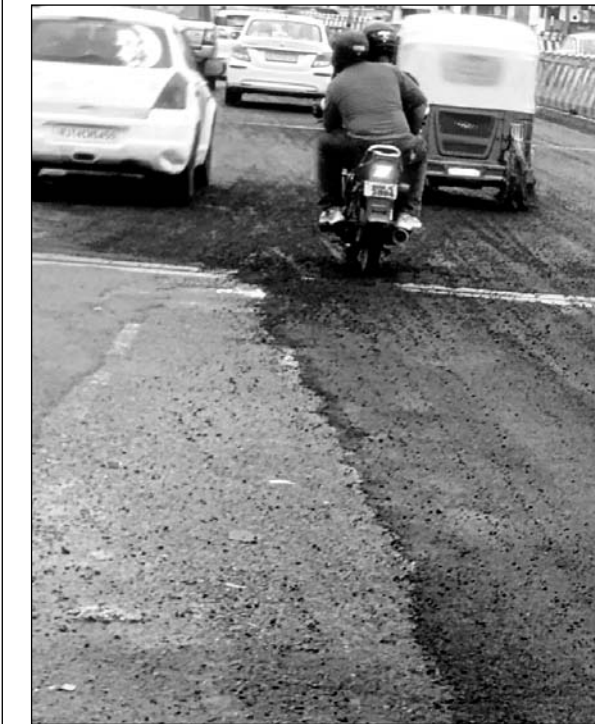
अजमेर एलिवेटेड रोड पर पेचवर्क उखड़ने के बाद सड़क पर बिखरी रोड़ी-कंक्रीट, जो हादसों को न्यौता दे रही है।

-कार्यालय संवाददाता- जयपुर । अजमेर एलिवेटेड रोड पर घटिया पेचवर्क और दुर्गुने पैसे लगाकर उसे उखड़ने में जे.डी.ए. के लाखों रुपये की बर्बादी करने के मामले में जे.डी.ए. कमिश्नर आनंदी ने वस्तुस्थिति की रिपोर्ट मांग ली। मजेदार बात यह है कि जेडीए जोन-7 ने अजमेर रोड एलिवेटेड रोड पर पुरानी चुंगी से मजार तक 3.15 करोड़ रुपये की लागत से नई सड़क बनाने के लिए टेंडर जारी किया है। यानि कि 3.15 करोड़ रुपये लगाकर सड़क की रि-कारपेंटिंग को जायेगी। टेंडर की अंतिम तारीख 7 अक्टूबर है। सफल आवेदक को चर्क आर्डर जारी किया जाएगा। इस कारपेंटिंग से पहले सड़क पर पुरानी डामर को उखाड़ा जाएगा। ऐसे में यह सभी पेचवर्क भी उखड़ेंगे, जो बरसात के दौरान किये जा रहे हैं। सूत्रों की मानें तो नई सड़क निर्माण से पहले जेडीए जोन-7 के इंजीनियर्स ने बुधवार रात आनन-फानन में यह घटिया पेचवर्क कराए, जो कुछ घंटे भी नहीं चले। यह जानकारी मजदूरों के इंजीनियर्स ने इसलिए किया गया कि, कुछ दिनों बाद जब सड़क नई बनाई