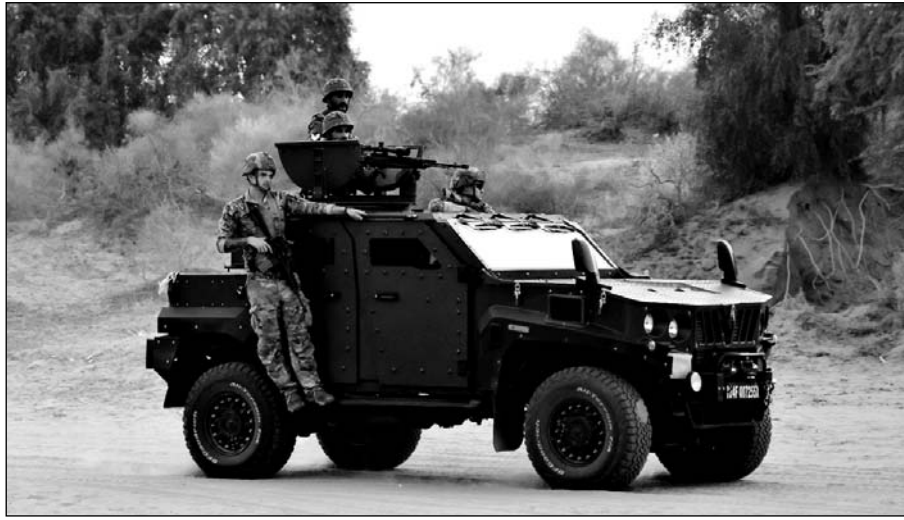
भारत और अमेरिकी सैनिकों ने जटिल सामरिक युद्धाभ्यास, लाइव-फायर ड्रिल्स और संयुक्त वायु अभियानों का प्रदर्शन किया।

भारत-अमेरिका सेना के जवानों ने मिलकर अपने-अपने हथियारों की मारक क्षमता का प्रदर्शन किया। अर्पाचे के दौरान यूएसए-777 अल्ट्रा-लाइट हॉलिवर तोपों ने भारतीय तोपखाने की यूनिट्स के साथ मिलकर प्रैक्टिस की है। एक्यूरोसी के साथ। इसके अलावा घायल होने वाले जवानों को मेडिकल सेवा देने और इन जवानों को हवाई सेवा से अन्यत्र ले जाने के दृश्य भी नजर आए। अर्पाचे के अंतिम क्षणों में युद्ध जैसे दृश्य नजर आए जब दोनों देशों के हथियारों का