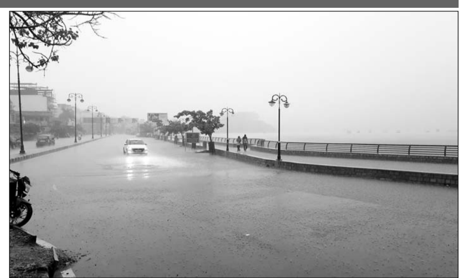
प्री मानसून की तेज बरसात के बाद वैशाली नगर स्थित आनासागर चौपाटी मुख्य मार्ग पर भरा पानी।

शहर के पर्यटक स्थलों के साथ ही आनासागर चौपाटी पर लोगों की भीड़ देखने को मिली। जिले के पुष्कर, केकड़ी, मसूदा, किशनगढ़ और अंराई सहित अन्य स्थानों पर बरसात हुई। पुष्कर सरोवर में फोडर के जरिए पानी की आवक हुई। अजमेर की निचली बस्तियों जादूगर, गुर्जर धरती, नारा, भजनगंज, अशोक नगर भट्टा, जौन्सगंज, बिहारीगंज, अलवर गेट, झलकारी नगर आदि क्षेत्रों की सड़कों पानी से लबालब हो गई। जेएलएन अस्पताल परिसर के आस-पास पानी भरने से तालाब बन गया। मार्टिडल ब्रिज के नीचे, स्टेशनरोड, क्लॉक टावर से गांधी भवन