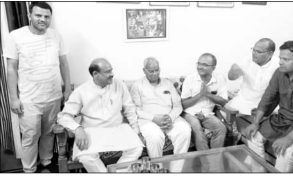
लोकसभा अध्यक्ष बिरला ने क्षेत्रीय विधायक दिलावर व रेल मंडल प्रबन्धक के साथ विभिन्न योजनाओं का शिलान्यास व उद्घाटन किया।

रामगंजमण्डी (निर्स)। लोकसभा अध्यक्ष ओम बिरला ने क्षेत्रीय विधायक मदन दिलावर व रेल मंडल प्रबन्धक के साथ रामगंजमण्डी जंक्शन, मोडक, कमलपुरा, दरा, आलनियां व डकनियां तालाब स्टेशन पर विभिन्न योजनाओं का शिलान्यास व उद्घाटन किया।