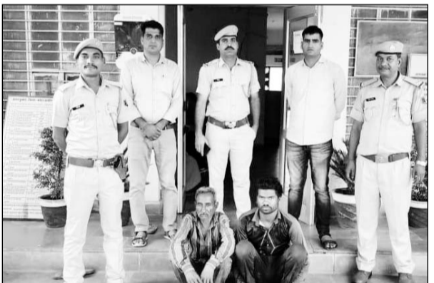
रामगंजमण्डी पुलिस 4 किलो 780 ग्राम गांजा के साथ दो आरोपी को गिरफ्तार करने में सफलता प्राप्त की।