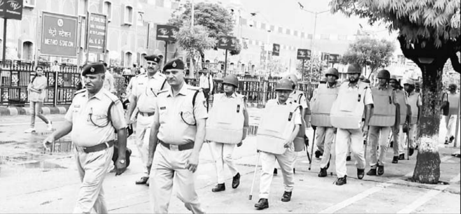
सेना भर्ती के लिए केन्द्र सरकार की योजना "अग्निपथ" को लेकर सोशल मीडिया पर भारत बंद के वायरल हुए मैसेज को देखते हुए रेलवे ने अतिरिक्त सुरक्षा व्यवस्था की है।

जयपुर (कासं)। सेना भर्ती के लिए केन्द्र सरकार की योजना 'अग्निपथ' को लेकर सोशल मीडिया पर भारत बंद के वायरल हुए मैसेज को देखते हुए पुलिस ने जयपुर शहर में व्यवस्था चाक-चौबंद कर दी है। साथ ही रेलवे ने अतिरिक्त सुरक्षा व्यवस्था की है। दरअसल, प्रदर्शनकारी रेल और रेलवे ट्रेक को निशाना बना रहे हैं। ऐसे में एहतियात के तौर पर सोमवार सुबह से ही जयपुर जंक्शन पर पुलिस अलर्ट मोड में दिखी।