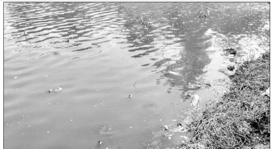
पाली नगर परिषद के कर्मचारियों ने मृत मछलियों को बाहर निकाला।

पाली, (नि.सं।) पाली शहर के लाखोटिया तालाब में भैरुघाट साइड तालाब के दूसरे हिस्से में भरे पानी में सोमवार सुबह घूमने जाने वाले लोगों को सैकड़ों मछलियां किनारे पर मरी पड़ी मिली, जिसके कारण आने-जाने वाले राहगीरों को भारी दुर्गंध आ रही थी। यह मछलियां किस कारण मरी उसका पता नहीं चला। पिछले 2 वर्षों से तालाब में भरा पानी गंदा हो गया है ऑक्सीजन की कमी होने से शायद मरी है। कई लोगों का कहना है कि लोगों ने तालाब में कुछ डाल दिया हो कारण नहीं पता चला। सूचना देने पर दिन में नगर परिषद के कर्मचारी पहुंचे और तालाब में मरी मछलियों को बाहर निकाला और जांच के लिए भेजा। मत्स्य विभाग या चिकित्सा विभाग इसकी जांच कर पता लगाएगी कि क्या मामला है।