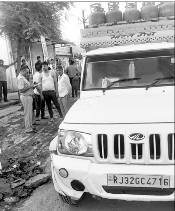
घटना के बाद पुलिस ने मौके से जानकारी जुटाई।

किशनगढ़ बास, (निसं)। शहर के अलवर रोड पर गैस सिलेंडरों से भरी पिकअप गाड़ी के चालक ने लापरवाही से सड़क पर बैंक गियर में गाड़ी चलाकर मॉर्निंग वॉक के लिए निकली महिला को पीछे से टक्कर मारकर कुचल दिया जिससे महिला की मौके पर ही दर्दनाक मौत हो गई। महिला करीब 1 सप्ताह पहले बहरोड़ से किशनगढ़ बास पीयर में माता-पिता से मिलने के लिए आई हुई थी।