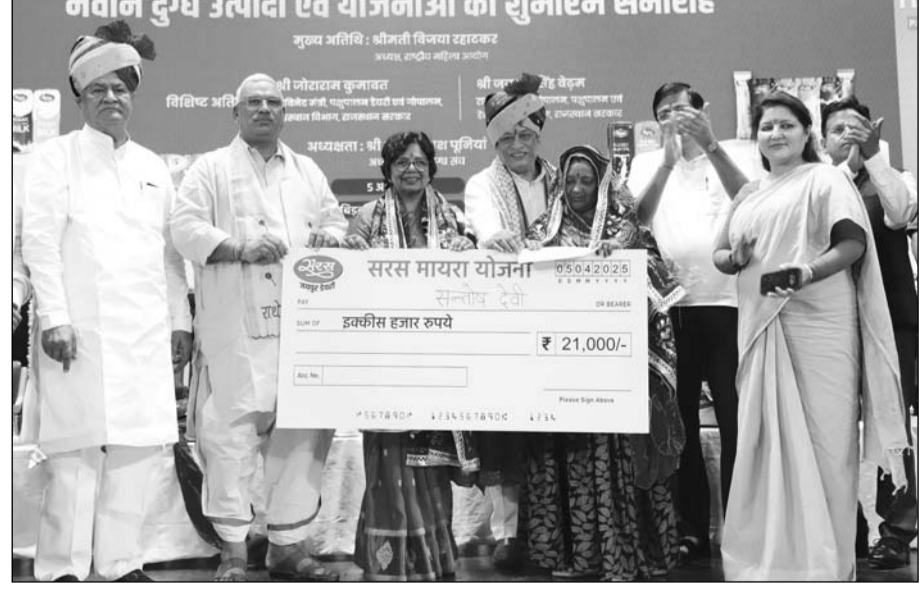
जयपुर के बिड़ला ऑडिटोरियम में जयपुर डेयरी की महिला सशक्तिकरण की अभिनव पहल-सरस मायरा योजना का शुभारम्भ किया गया। इस योजना की शुरुआत के अवसर पर ही डेयरी से जुड़ी दो लाभार्थी महिला दुग्ध उत्पादकों को 21-21 हजार रुपये के बैंक भी भेंट किये गये।

ऐनर्जी उत्पादन के लिये रुफटॉप सोलर प्लांट योजना का भी शुभारम्भ किया गया। रुफटॉप सोलर प्लांट योजना के