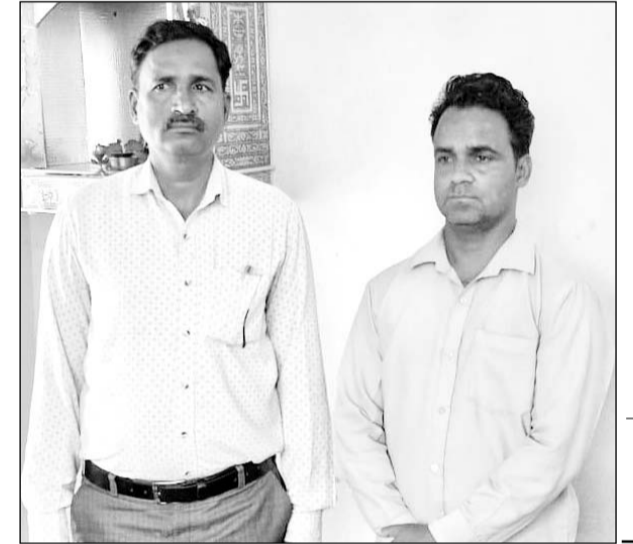
एसीबी ने रिश्वत लेने के दो आरोपियों को गिरफ्तार किया।