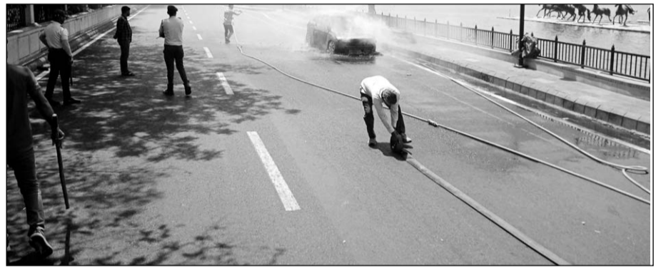
दमकलकर्मियों ने मौके पर जाकर कार में लगी आग को बुझाया।

कोटा, (निसं)। नयापुर इलाके में शनिवार को तालाब की पाल पर एक कार में आग लग गई। गनीमत रही कि कार चालक ने कार के बोनट से धुआं उठता देखा और कार को साईड में खड़ी करके समय रहते कार से उतर गया। कार चालक के कार से उतरते ही बोनट में आग की लपटें निकली और कुछ ही मिनटों में आग पूरी तरह फैल गई। कार में आग लगने की सूचना पाकर पुलिस और अग्निशमन विभाग की दमकल मौके पर पहुंची और एक दमकल की मदद से आग पर काबू पाया गया।