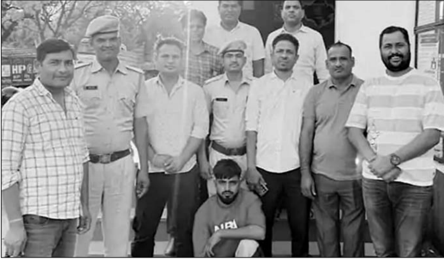
पुलिस ने अवैध हथियार के साथ युवक को गिरफ्तार किया।