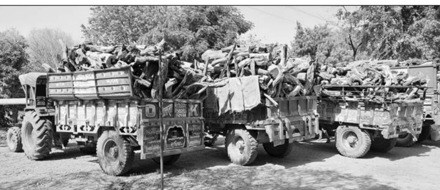
माण्डलगढ़ वन विभाग की टीम ने 50 क्विंटल खैर की लकड़ी जब्त की।

माण्डलगढ़, (निर्स)। माण्डलगढ़ वन विभाग की टीम ने वन माफिया पर बड़ी कारवाही को अंजाम देकर करीब दो लाख कीमत की अवैध खैर की लकड़ी के स्टॉक को जब्त किया है। बताया जा रहा है कि बूंदी जिले के वन क्षेत्र से वन माफिया ने खैर के बड़े-बड़े पेड़ों को कटवाकर कारवाही से बचने के लिए भीलवाड़ा जिले के साई पीपला गांव की सीमा में स्टॉक लगा रखा था। वन विभाग की टीम ने अज्ञात के खिलाफ मामला दर्ज कर वन माफिया की तलाश में जुटी है।