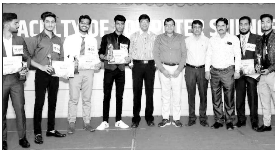
उदयपुर के पेंसिफिक में सांस्कृतिक कार्यक्रम ‘आव्हान’ आयोजित हुआ।

उदयपुर, (कासं)। पेंसिफिक फेकल्टी ऑफ कम्प्यूटर साइंस में सांस्कृतिक कार्यक्रम ‘आव्हान’ का रंगारंग कार्यक्रम में विभिन्न प्रतियोगिता का आयोजन हुआ। प्रतियोगिता अन्तर्गत विभिन्न खेल (रिले रेस, च्रेस व केरम) व अन्य रंगोली, मास्टर सेफ, ट्रेजर हंट विथ सेल्फी प्रतियोगिताओं का आयोजन किया गया। इस प्रतियोगिता का