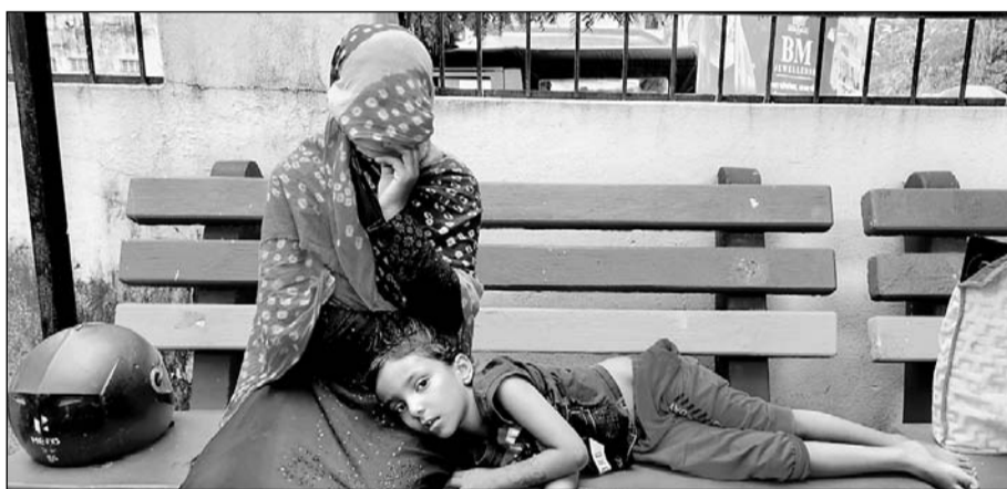
पीड़ित महिला और बच्ची।

भीलवाडा, (निसं)। जिले के सबसे बड़े महात्मा गांधी चिकित्सालय में एक सीनियर डॉक्टर ने धिनीनी हरकत को अंजाम दिया है। जानकारी अनुसार एक महिला अपनी बेटी को हॉस्पिटल दिखाने आई थी इस दौरान एनआईसीयू वार्ड के बाहर डॉक्टर ने इस महिला को थप्पड़ जड़ दिया। यह पूरी वारदात सीसीटीवी फुटेज में कैद हुई है इसके बाद पीड़ित महिला ने थाने में रिपोर्ट दर्ज करावाई है।