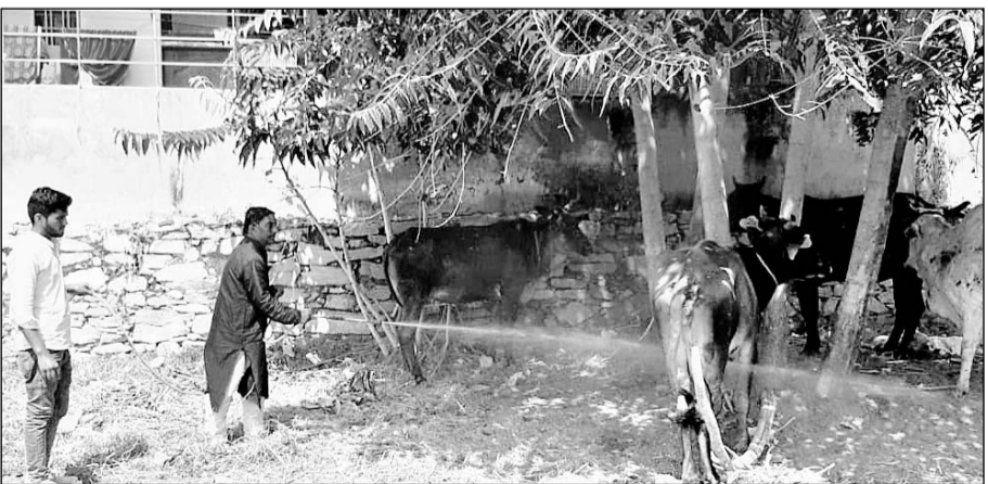
लम्पी बीमारी से ग्रस्त गायों का सैनेटाइजर से उपचार करती टीम।

उन्होंने बताया कि बहुत से किसान गायों के लम्पी बीमारी होते ही घर से बाहर छोड़ देते हैं। ऐसे में संस्थान ने नया कदम उठाते हुए मोबाइल टीम बनाई है जो उन लम्पी ग्रस्त गायों को घर घर जाकर इलाज करेगी। संस्थान के शर्मा ने बताया कि सैकड़ों गायों को सतर्कता व दवाओं तथा इलाज से ठीक किया जा चुका है।