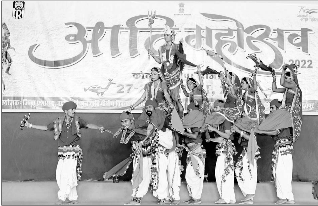
“आदि महोत्सव” के पहले दिन भारत के विभिन्न क्षेत्रों से आए लोक कलाकारों ने नृत्य की सामूहिक प्रस्तुती दी।

पर्यटन के क्षेत्र में विश्व पटल पर अपनी विशिष्ट पहचान रखने वाले उदयपुर में आयोजित यह आदि महोत्सव भारत की विविधता में एकता की विशेषता का साक्षी बना। इस महोत्सव में मेवाड़ की लोक संस्कृति के साथ भारत के विभिन्न क्षेत्रों से आए लोक कलाकारों ने अपनी प्रस्तुतियों से सभी को मंत्रमुग्ध किया। भारत के विभिन्न प्रांतों से आए लोक कलाकारों ने अपने पारंपरिक लोक वाद्य यंत्रों एवं अपने प्रदेश की पौराणिक कथाओं व संस्कृति पर आधारित कार्यक्रमों की