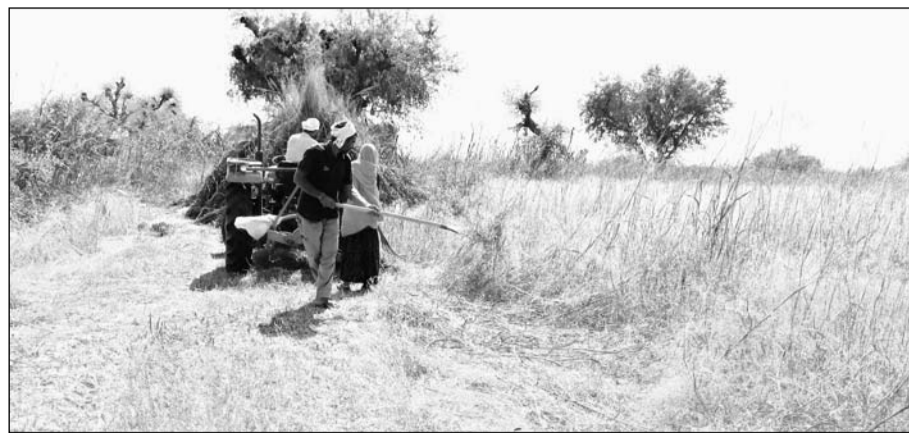
सांभर में खेत पर चारा एकत्रित करते किसान ।