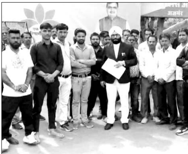
कलेक्ट्रेट पर पीड़ित लोगों ने प्रदर्शन किया।