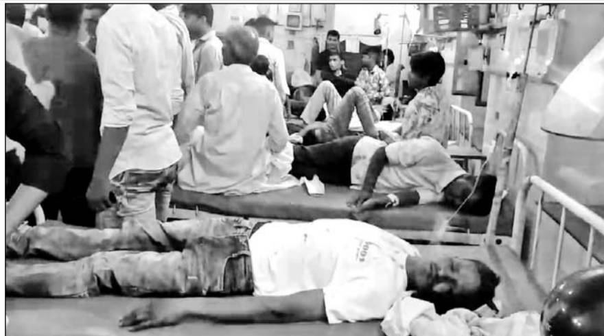
घायलों को इलाज के लिए जिला अस्पताल धौलपुर में भर्ती कराया।

धौलपुर, (निसं)। धौलपुर शहर के सदर थाना क्षेत्र में गुरुवार-शुक्रवार की रात को पंचगांव गांव के पास भरतपुर हाईवे पर बारातियों से भरा एक डीसीएम वाहन पलटा गया। हादसे में दो बारातियों की मौत हो गई तथा 14 बाराती घायल हो गए वहीं कुछ बाराती चोटिल भी हो गए। घायलों को इलाज के लिए जिला अस्पताल धौलपुर में भर्ती कराया गया, जहां से दो घायलों को गंभीर हालत में जयपुर रेफर कर दिया गया। जैसे ही घटना की जानकारी वर व वधु पक्ष के घर पहुंची तो मातम छा गया और सनाटा पसर गया।