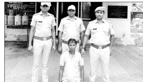
मनोहरपुर पुलिस ने फरार नकबजन को गिरफ्तार किया।