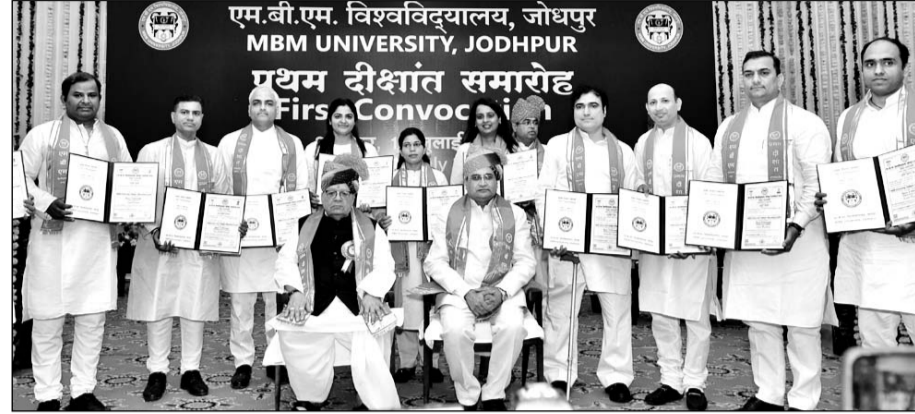
राज्यपाल कलराज मिश्र ने समारोह में विद्यार्थियों को गोल्ड मेडल प्रदान किए।

जोधपुर, (कांस)। राज्यपाल और कुलाधिपति कलराज मिश्र ने कहा कि प्रौद्योगिकी शिक्षा के तहत विश्वविद्यालय युवाओं को नवाचारों से जोड़ते हुए शोध की मौलिक भारतीय दृष्टि से संपन्न करें। उन्होंने कहा कि तकनीकी शिक्षा का उद्देश्य छात्रों में निहित अद्वितीय क्षमताओं को पहचान कर उन्हें भविष्य के अवसरों के लिए तैयार करना है। उन्होंने विद्यार्थियों से आह्वान किया कि वे अर्जित ज्ञान का उपयोग राष्ट्र और समाज के विकास के साथ ही मानवता के कल्याण में करें। राज्यपाल मिश्र जोधपुर स्थित एम.बी.एम. विश्वविद्यालय के प्रथम दीक्षांत समारोह को संबोधित कर रहे थे। समारोह में राज्यपाल कलराज मिश्र ने 19 विद्यार्थियों को गोल्ड मेडल प्रदान किए, जिसमें 13 गोल्ड मेडल यूजी के विद्यार्थियों को, 4 गोल्ड मेडल पीजी के विद्यार्थियों को एवं 2 गोल्ड मेडल एमसीए के विद्यार्थियों को प्रदान किए गए। साथ ही वर्ष 2022 एवं 2023 में उत्तीर्ण 680 विद्यार्थियों को स्नातक में उपाधियां प्रदान की। इसी प्रकार कुल 167 विद्यार्थियों को स्नातकोत्तर में, 28 विद्यार्थियों को बी.आर्किटेक्चर में, 52 विद्यार्थियों को एमसीए में एवं 11 विद्यार्थियों को पी.एच.डी की उपाधि प्रदान की गई। समारोह को संबोधित करते हुए राज्यपाल ने कहा कि शिक्षण के माध्यम से युवाओं को प्रबंधन करना हमारी प्राथमिकता है। इस