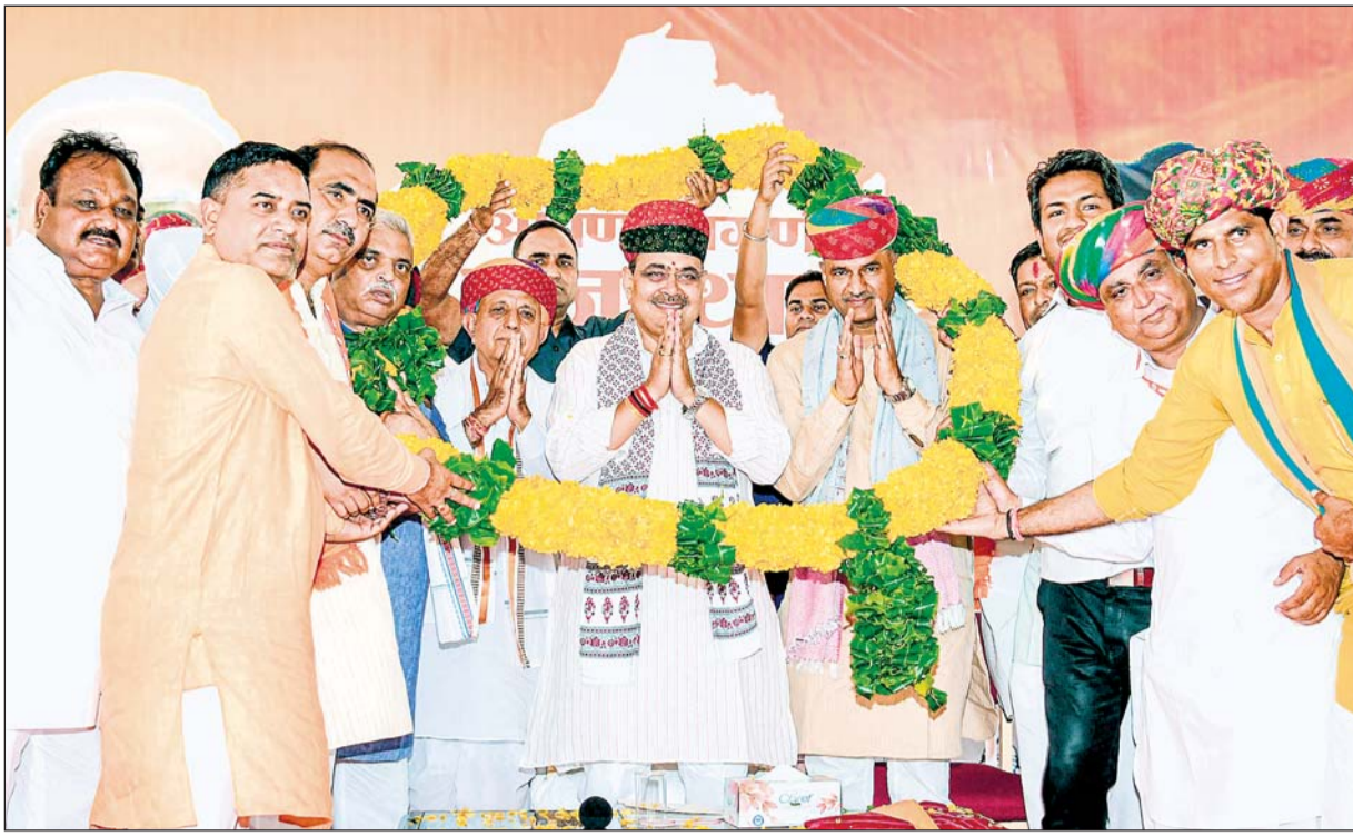
बजट पर मुख्यमंत्री भजनलाल शर्मा का आभार जताने के लिए प्रदेश भर से किसान मु.मंत्री निवास पर इकट्ठा हुये। किसानों ने बजट के प्रति प्रसन्नता जाहिर की और मुख्यमंत्री का माला पहनाकर अभिनन्दन किया।