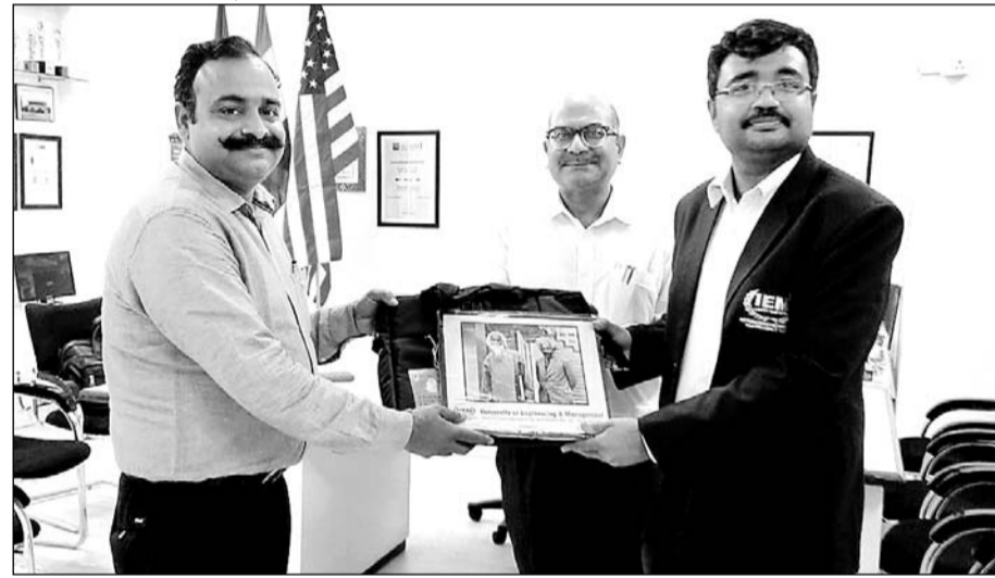
क्रीटी टेक्नोलॉजीज, बैंगलोर ने यूनिवर्सिटी ऑफ इंजीनियरिंग एंड मैनेजमेंट (यूईएम), जयपुर के साथ मिलकर भारत का पहला एलीक्सिस् लैब स्थापित किया है।