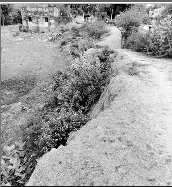
पथवारी तालाब भिनाय की क्षतिग्रस्त फैशवाला।

हो रहा है। भिनाय कस्बे का धार्मिक महत्व का यह तालाब वर्तमान में अपनी दुर्दशाग्रस्त हालातों पर आंसू बहा रहा है। इस तालाब के भीतर कूड़ा कर्कट, कचरा, गंदगी, आदि का जमावड़ा बढ़ता जा रहा है। पंचायत राज के अधीन उक्त पथवारी तालाब की क्षतिग्रस्त व जमींदोज यानि ध्वस्त फैशवाल का मलबा हटाने और पुनः फैशवाल निर्माण कार्य को लेकर ग्राम पंचायत भिनाय प्रशासन संवेदन शून्य बना हुआ है। व्यापक जनहित में प्रशासन द्वारा अविबलम्ब संज्ञान लेकर उक्त सम्बन्ध में गंभीरता व गहनता से प्रभावी व कारगर कार्यवाही करना अपेक्षित है।