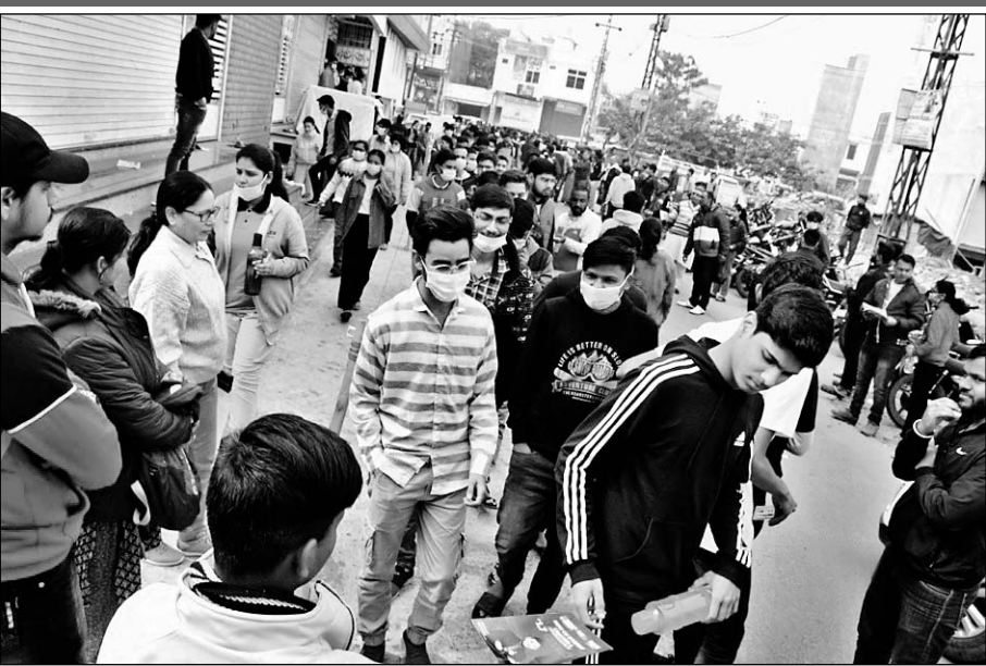
जेईई में से पेपर को लेकर छात्रों में उत्सुकता रही।