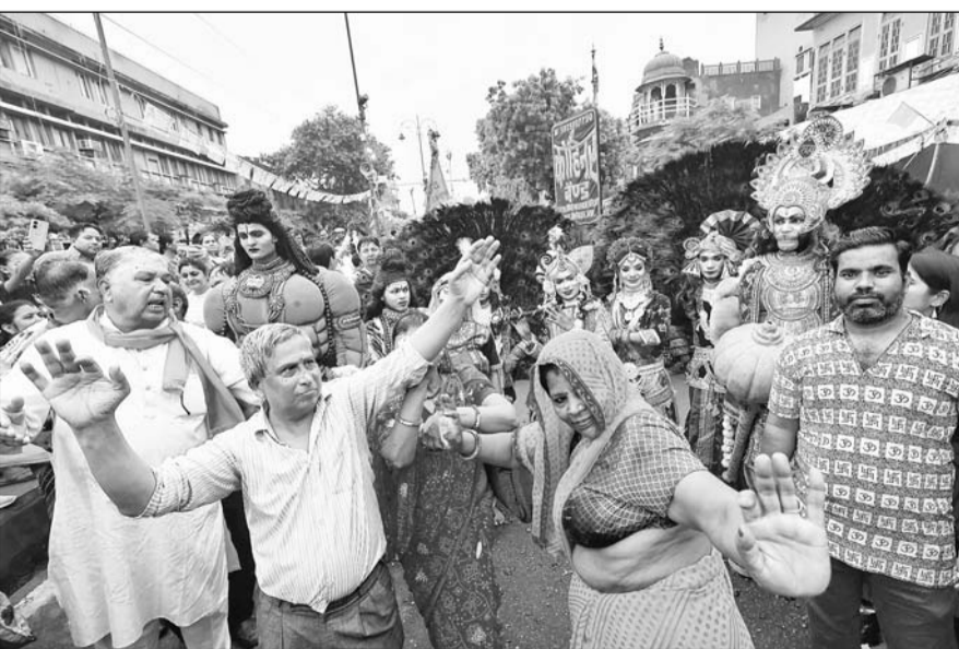
डिग्गी कल्याणजी की 59वीं लक्ष्मी पदयात्रा रविवार को जयपुर के ताड़केरवर्जी मंदिर से जयकारों के बीच रवाना हुई।