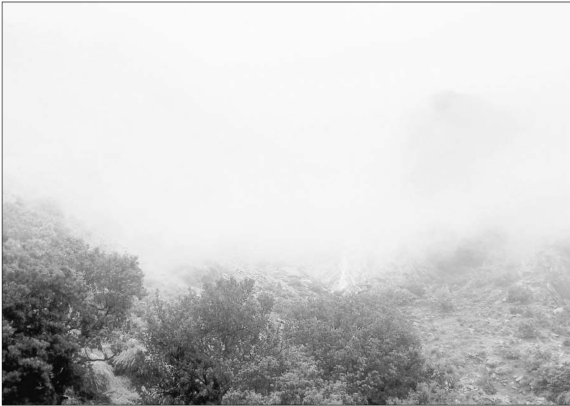
राजस्थान में मानसून को मेघ मल्हार चरम पर हैं। बारिश के बाद अरावली की पहाड़ियों से झरने बहने लगे हैं। सावन के इस हरियाली भरे मौसम में पहाड़ियों ने भी हरियाली की चादर ओढ़ ली। बारिश के बाद आसमान में धुंध छाये रहने से ऐसा लगने लगा है, जैसे बादल जमीं पर उतर रहे हों। जयपुर के नजदीक सामोद की पहाड़ियों का ये दृश्य ऐसा लगता है कि जैसे कुल्लू-मनाली की पहाड़ियां हों।