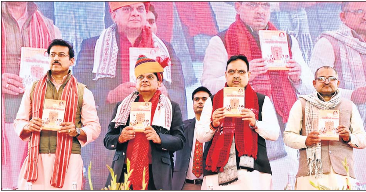
जयपुर के धानक्या गांव में प. दीनदयाल उपाध्याय की 56वीं पुण्यतिथि पर आयोजित व्याख्यान समारोह में मुख्यमंत्री भजन लाल ने प. दीनदयाल उपाध्याय की अंत्योदय योजना को सरकार का आदर्श बताया। कार्यक्रम में राज्य सरकार के मंत्री राज्यवर्धन सिंह राठौड़ व अन्य वरिष्ठ महानुभावों ने शिरकत की।