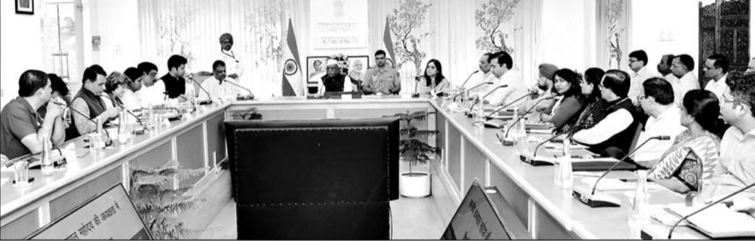
राज्यपाल हरिभाऊ बागडे ने मंगलवार को राजभवन में चिकित्सा विभाग की समीक्षा बैठक ली। उनके साथ मंत्री गजेन्द्र सिंह खोंवसर और विभाग के आला-अधिकारी मौजूद थे।

तुरंत कार्यवाही करने और पदोन्नतियां भी यथासमय करवाने के निर्देश दिए हैं। राज्यपाल ने टीबी मुक्त राजस्थान के लिए अभियान चलाकर कार्यवाही किए जाने के भी निर्देश दिए हैं। उन्होंने तहसील, गांव और जिला स्तर पर इस संबंध में विशेष कार्य करने और अगले तीन साल में राजस्थान को पूरी तरह से टीबी मुक्त करने के लिए सबको मिलकर प्रयास करने के निर्देश दिए। राज्यपाल ने प्रदेश के जनजातीय और ग्रामीण क्षेत्रों में प्रभावी चिकित्सा सुविधाएं उपलब्ध करवाने का आह्वान किया। उन्होंने चिकित्सकों से गांव,