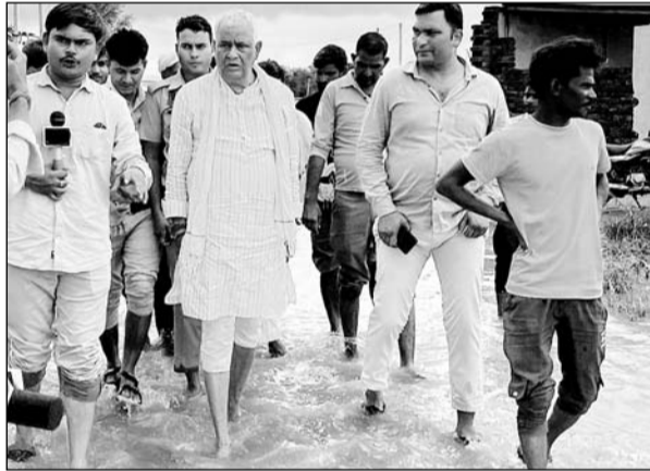
डॉ. किरोड़ी लाल मीणा ने भरतपुर, बयाना, हिण्डौन में जलभराव क्षेत्रों का दौरा किया।

जयपुर, (का.सं.)। भाजपा के वरिष्ठ नेता सवाई माधोपुर विधायक किरोड़ीलाल मीणा जो सुबह तो कैबिनेट मिनिस्टर थे और दोपहर होते-होते विधायक बन गए किरोड़ी का सोशल मीडिया प्रोफाइल बार-बार बदल रहा है। भाजपा प्रदेश अध्यक्ष मदन राठौड़ के बोलने के बावजूद अपने ट्विटर पेज पर खुद को विधायक बता किरोड़ी लाल मीणा ने ये संकेत दे दिए कि अब भी सब कुछ उतना सामान्य नहीं है, जितना बताया जा रहा है। वहीं मंगलवार को किरोड़ी लाल मीणा सड़क मार्ग से दौरा किया।