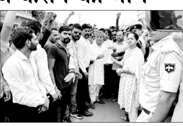
उपखंड अधिकारी को ज्ञापन सौंपते हुए।