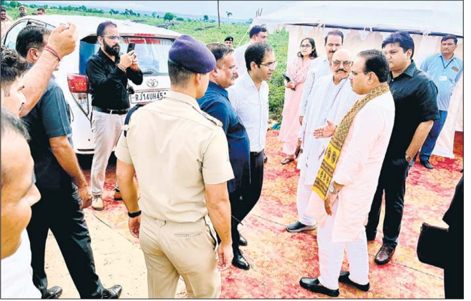
मुख्यमंत्री भजनलाल शर्मा मंगलवार को बयाना पहुंचे और गत 11 अगस्त को बाणगंगा नदी में डूबकर मरने वाले 7 युवकों के घर जाकर उनके परिजनों से मुलाकात की और उन्हें ढाढस बंधाया। मुख्यमंत्री ने झील का बाड़ा हैलौपेड पर प्रशासनिक अधिकारियों से भी राहत कार्यों की जानकारी ली।