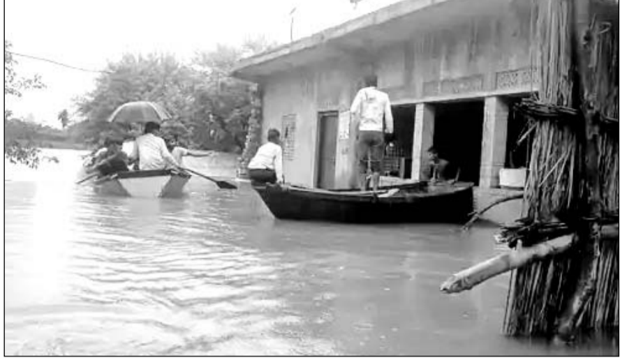
गंगापुर सिटी में बारिश के बाद जल भराव क्षेत्रों में राहत कार्य शुरू किए।