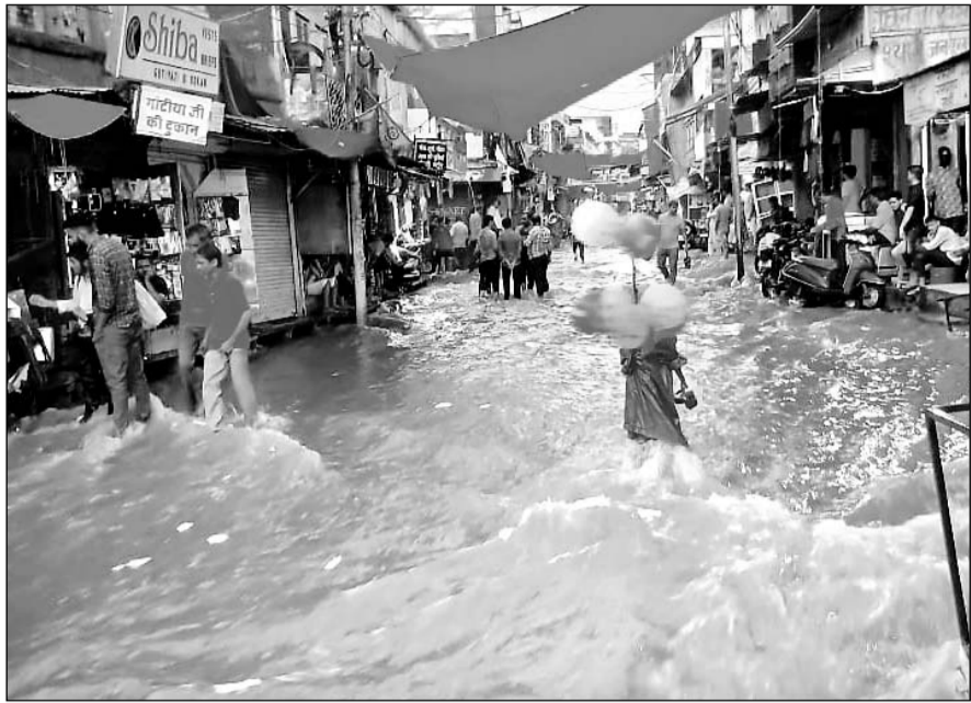
जोधपुर में हुई तेज बरसात के बाद कई जगहों पर सड़कें पानी से लबालब हो गईं।

जोधपुर सहित फलोदी, लोहावट, ओसिया, तिंवरी, नागाना सहित कई क्षेत्रों में बारिश हुई