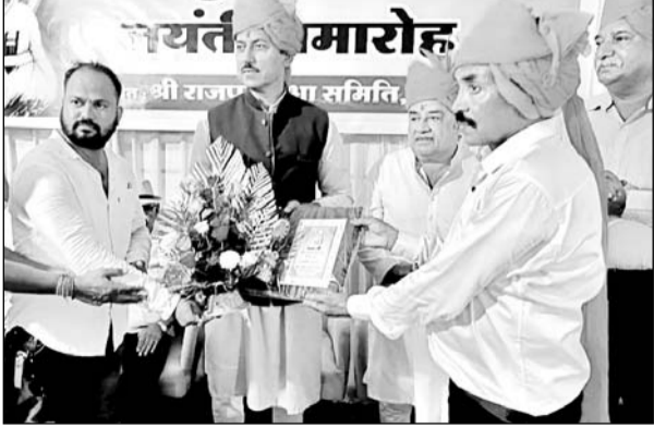
वीर दुर्गादास राठौड़ की जयंती श्रद्धा पूर्वक मनाई।