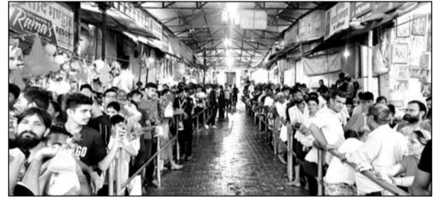
डिगगी लकड़ी मेले में श्रीजी के दर्शन के लिये आस्था का सैलाब उमड़ा।

कल्याण भक्तों की सेवा-चाकरी की लोगों में होड़ सी मची हुई है। जयपुर रोड बजरी नाँके के पास लगे श्रीजी भंडारा व डिगगी मोड़ से आगे लगे श्याम मित्र मंडल के भंडारे में अपनी सेवाएं दे रहे सेवक पदात्रियों में कल्याणधणी का वास मानकर उनके चरण धोने व भंडारे में तैयार किये गये कई प्रकार के व्यंजन भक्तों को परोसकर स्वयं को श्रीजी के समीप होने का अहसास कर रहे हैं। डिगगी तीर्थ की ओर आने वाले छोटे से बड़े हर