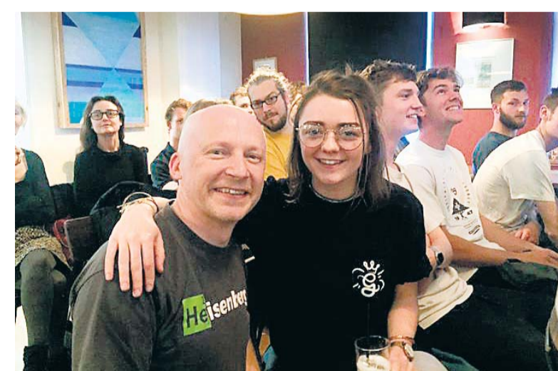
Marcus du Sautoy with Maisie Williams.

Yes, you're saying that it is learning from the environment around it. So, if the environment around it is malicious, it can learn that behaviour?