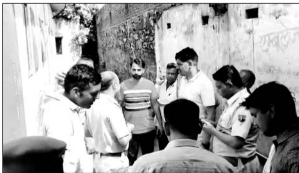
मौके पर पहुंची पुलिस ने परिजनों से समझाइश की।

भोलवाड़ा, (निर्स)। जमीन विवाद के चलते ट्रैक्टर से कुचल कर महिला की हत्या के मामले में आरोपियों की गिरफ्तारी की मांग को लेकर परिजनों ने एमजी हॉस्पिटल के बाहर प्रदर्शन शुरू कर दिया।