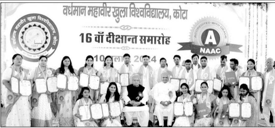
कोटा में राज्यपाल कलराज मिश्र ने दीक्षांत समारोह में छात्र-छात्राओं को उपाधियां प्रदान की।

कोटा, (निर्स)। कुलाधिपति एवं राज्यपाल कलराज मिश्र ने कहा है कि खुला विश्वविद्यालय के पत्राचार पाठ्यक्रम इस तरह से बनें कि उनमें युग की आवाज ध्वनित हो। उन्होंने नई शिक्षा नीति के अंतर्गत विद्यार्थियों के भविष्य के लिए उपयोगी पाठ्यक्रम निर्धारित करने और पहले से बने पाठ्यक्रमों को अपडेट करने पर भी जोर दिया। उन्होंने कहा कि विश्वविद्यालय शिक्षा के साथ-साथ कौशल विकास से भी विद्यार्थियों को जोड़ें। मिश्र बुधवार को वर्धमान महावीर खुला विश्वविद्यालय के दीक्षांत समारोह में संबोधित कर रहे थे।