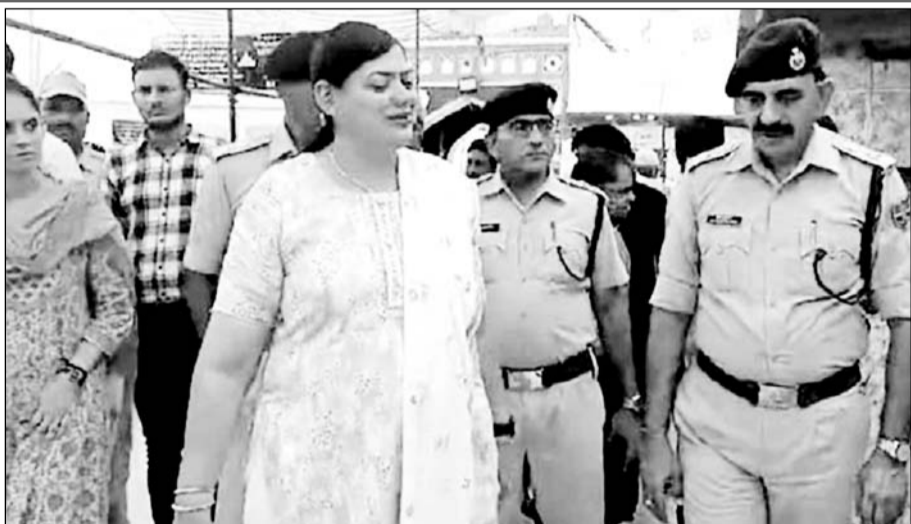
जिला कलेक्टर डॉ. भारती दीक्षित तथा एसपी ने दरगाह सहित दरगाह के परिधि क्षेत्र का जायजा लिया।

अजमेर, (कास)। मोहरम (मिनी उर्स) पर खेले जाने वाले हाईदौस सहित सुरक्षा व्यवस्थाओं को लेकर जिला कलेक्टर डॉ. भारती दीक्षित तथा एसपी