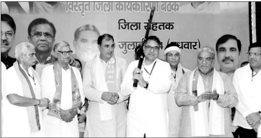
हरियाणा भाजपा प्रदेश प्रभारी नियुक्त होने के बाद पहली बार हरियाणा आए डॉ. सतीश पूनियां का स्वागत किया गया।

चंडीगढ़/हिसार/रोहतक। भाजपा केन्द्रीय नेतृत्व द्वारा हरियाणा भाजपा प्रदेश प्रभारी नियुक्त होने के बाद पहली बार हरियाणा आए डॉ. सतीश पूनियां का भिवानी, हिसार से लेकर रोहतक तक भाजपा कार्यकर्ताओं, जन प्रतिनिधियों, पदाधिकारियों, किसानों, युवाओं एवं माता-बहनों ने भव्य स्वागत अभिनंदन कर तीसरी बार हरियाणा में भाजपा सरकार बनाने का संकल्प लिया। आगामी विधानसभा चुनावों को लेकर राजनीतिक हलचल बढ़ने लगी है तथा नेता सक्रिय होकर चुनावी मैदान में उतर चुके हैं।