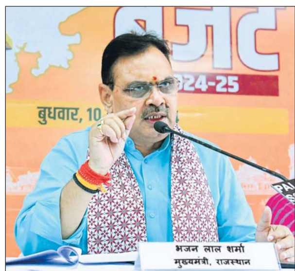
बजट पेश होने के बाद मु. मंत्री भजनलाल शर्मा ने प्रेस कॉन्फ्रेंस में कहा कि सरकारें आती हैं बजट पेश करती हैं, लेकिन हमने बजट के साथ विजन भी पेश किया है। बजट में सरकार का विजन भी होना चाहिए।

जयपुर, 10 जुलाई (का.सं.)। मुख्यमंत्री भजनलाल शर्मा ने दावा किया है कि समयबद्ध रूप से बजट की घोषणाओं को पूरा किया जाएगा और आमजन की सुविधाओं के लिए सरकार कड़े निर्णय लेने से भी नहीं हिचकेगी। विधानसभा में बजट पेश होने के बाद आयोजित प्रेसवार्ता में मुख्यमंत्री ने कहा कि राज्य में अब डबल इंजन की सरकार है और इनके सहारे ही राज्य के विकास को पटरी पर तेजी से दौड़ाया जाएगा। मुख्यमंत्री ने मीडिया को संबोधित करते हुए कहा कि सरकारें आती हैं बजट पेश करती हैं, लेकिन हमने बजट के साथ विजन भी पेश किया है। इस बजट में बताया गया है कि 2047 में प्रदेश का विकास कैसा होगा? हमारी सरकार बिजली पानी के लिए कटिबद्ध है। इसके साथ-साथ किसान युवा, महिला और औद्योगिक विकास का ध्यान रखा है। प्रदेश की आठ करोड़ जनता को पूरा-पूरा लाभ हम दें, जनता की आशाओं को पूरा करने का जो वादा