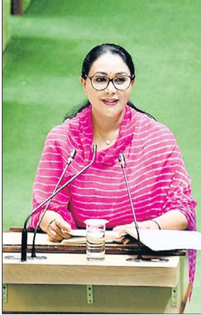
उप मुख्यमंत्री एवं वित्त मंत्री दिया कुमारी ने बुधवार को अपना पहला बजट पेश किया।

बजट में चिकित्सा और पुलिस विभाग में करीब 9 हजार नए पद भी सृजित करने की घोषणा की गई है। शहरी विकास के लिए बजट में 1300 करोड़ रुपए का प्रावधान किया गया है। भजनलाल सरकार ने इस बजट में इन्फ्रास्ट्रक्चर पर खास फोकस किया है। जलजीवन मिशन में इस साल 15 हजार करोड़ खर्च कर 25 लाख ग्रामीण घरों में नलों से पानी पहुंचाने की योजना है तथा प्रदेश के 5846 अतिरिक्त गांवों तक पानी पहुंचाने के लिए 20 हजार करोड़ से ज्यादा की 6 बड़ी परियोजनाएं शुरू की जाएंगी। करौली, सवाईमाधोपुर, गंगापूर सिटी के लिए चंबल आधारित