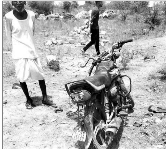
बदमाशों ने मौके पर खड़ी बाइकों में तोड़फोड़ कर दी।