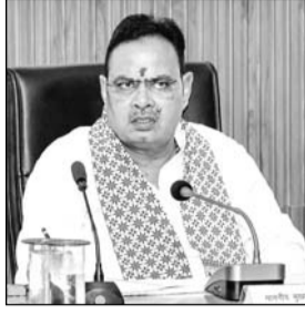
मुख्यमंत्री भजनलाल शर्मा

विशेषज्ञों का मानना है कि इन परियोजनाओं के पूरा होने के बाद राजस्थान निवेश, उद्योग, पर्यटन और व्यापार के क्षेत्र में देश के अग्रणी राज्यों में शामिल हो सकता है।