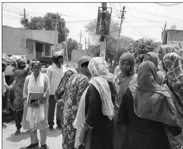
अलवर के अंबेडकर नगर विस्तार कॉलोनी के मुख्य रोड पर मंदिर के पास शराब ठेका हटाने की मांग को लेकर महिलाओं ने नारेबाजी की।

महिलाओं ने विरोध प्रदर्शन कर प्रशासन के खिलाफ जमकर नारेबाजी की और तुरंत शराब ठेका बंद करने की मांग की। महिलाओं का कहना है कि अब यहां से निकलना मुश्किल हो जाएगा। ठेका बंद कराने के लिए अलवर कलेक्टर के पास भी पहुंचे हैं।