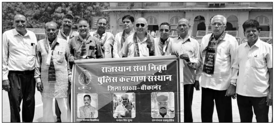
सहकारिता मंत्री गौतम दक के खिलाफ सेवानिवृत्त पुलिसकर्मियों ने प्रदर्शन कर विरोध जताया।

बीकानेर, (कासं)। राजस्थान सेवानिवृत्त पुलिस कल्याण संस्थान बीकानेर संसभाग के बैनर तले आज सैकड़ों पूर्व पुलिस अधिकारियों और कर्मियों द्वारा कलेक्ट्रेट कार्यालय के समक्ष एकत्रित होकर राज्य के सहकारिता मंत्री गौतम दक के खिलाफ एक विशाल उग्र विरोध प्रदर्शन किया। प्रदर्शनकारियों ने नेतृत्व कर रहे बरिष्ठ पदाधिकारियों ने मंत्री के इस कृत्य को पुलिस बल के आत्मसम्मान पर गहरा आघात बताया। कलेक्ट्रेट परिसर में प्रदर्शन के दौरान पूर्व पुलिस अधिकारियों का आक्रोश फूट पड़ा। प्रदर्शनकारियों ने मंत्री के तानाशाही और अपमानित रवैये के खिलाफ जमकर नारेबाजी की। पूरा परिसर गौतम दक मुंबीबाद, तानाशाही नहीं चलेगी और पुलिस संगठन जिंदाबाद, पुलिस का अपमान नहीं सहेंगा, राजस्थान के गणभेदी नारों से