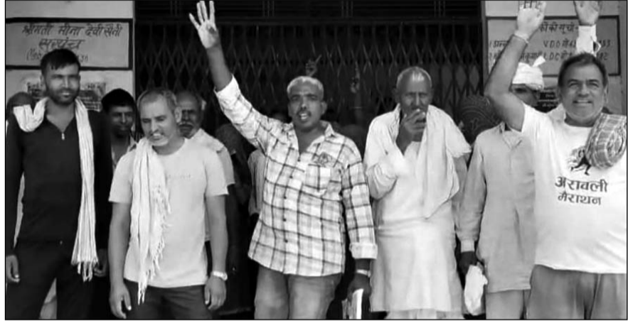
ग्राम पंचायत न्यौराणा में मजदूरों ने पंचायत कार्यालय के बाहर नारेबाजी की।

मजदूरों ने आरोप लगाया कि सरपंच और ग्राम विकास अधिकारी मनरेगा श्रमिकों के साथ भेदभावपूर्ण रवैया अपना रहे हैं। उनका कहना है कि पंचायत में बार-बार मनरेगा कार्य बंद कर दिए जाते हैं, जबकि आसपास की पंचायतों में लगातार रोजगार उपलब्ध कराया जा रहा है। इससे न्यौराणा के जांब कार्डधारी श्रमिकों को आर्थिक परेशानियों का सामना करना पड़ रहा है। श्रमिकों ने बताया कि कई बार मांग करने के बावजूद उन्हें काम नहीं दिया जा रहा है। रोजगार के अभाव