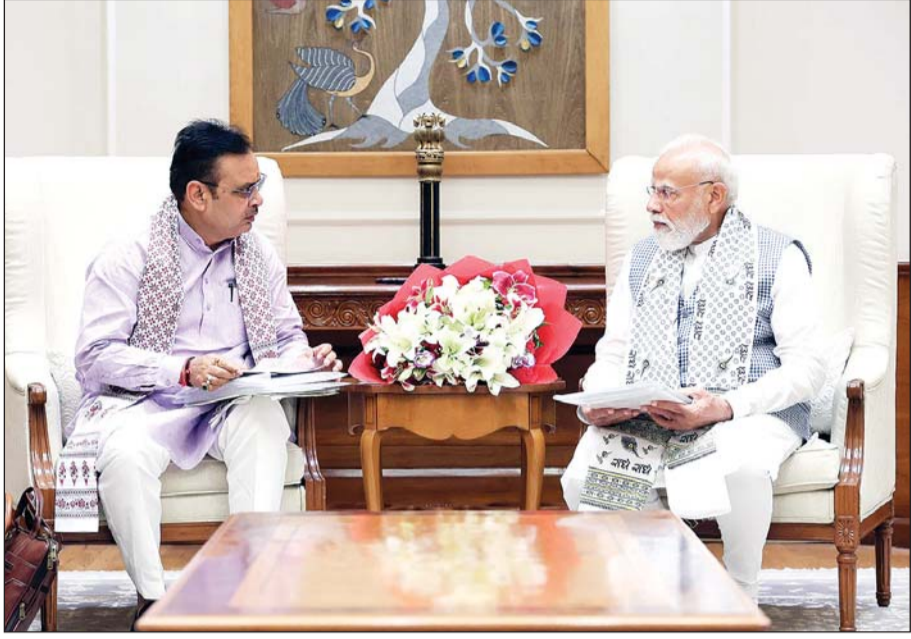
मुख्यमंत्री भजनलाल शर्मा ने सोमवार को नई दिल्ली में प्रधानमंत्री नरेन्द्र मोदी से उनके निवास पर शिष्टाचार भेंट की।

उन्होंने प्रधानमंत्री के साथ विकास, सुशासन व जन कल्याण से जुड़े विषयों पर गहन चर्चा की