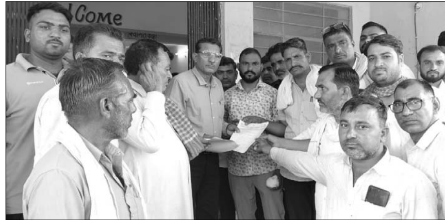
ग्रामीणों ने मुख्यमंत्री के नाम तहसीलदार को ज्ञापन सौंपकर शीघ्र समस्या समाधान की मांग की।

राजलदेसर, (निसं)। राजलदेसर कस्बे के निकटवर्ती ग्राम पंचायत बिनादेसर में दो वर्ष से जारी पेयजल संकट को लेकर सोमवार को ग्रामीणों और किसानों का आक्रोश खुलकर सामने आया। लंबे समय से पानी की समस्या से जूझ रहे ग्रामीणों ने तहसील कार्यालय पहुंचकर प्रदर्शन किया और मुख्यमंत्री के नाम तहसीलदार को ज्ञापन सौंपकर शीघ्र समस्या समाधान की मांग की।