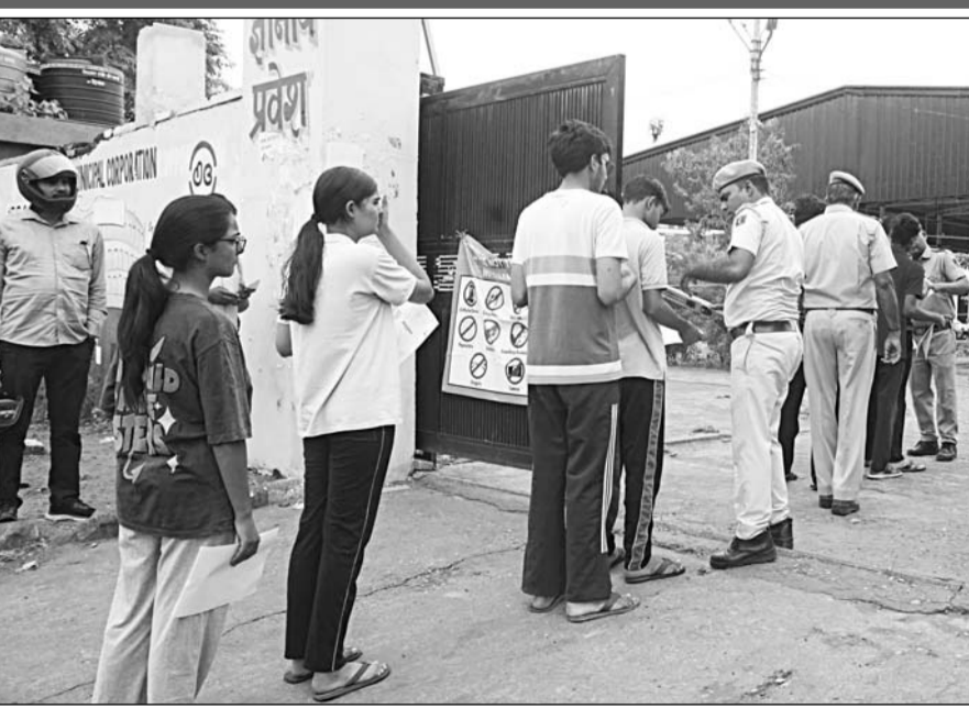
नीट परीक्षा देने पहुंचे अभ्यर्थियों को परीक्षा केंद्र में प्रवेश देने से पूर्व पुलिस ने उनकी गहनता से जांच की। सहायता से अभ्यर्थियों के बालों तक की गहन जांच की। निर्धारित समय के अनुसार दोपहर 1:30 बजे परीक्षा केंद्रों के प्रवेश द्वार बंद कर दिए गए और इसके बाद किसी भी अभ्यर्थी को प्रवेश नहीं दिया गया। गांधी नगर स्थित केंद्रों पर अंतिम समय तक लाउडस्पीकर के माध्यम से अभ्यर्थियों को समय पर पहुंचने के निर्देश दिए जाते रहे।

-कार्यालय संवाददाता- जयपुर। राष्ट्रीय पात्रता सह प्रवेश परीक्षा (नीट-यूजी) की पुनः परीक्षा रविवार को राजधानी जयपुर में कड़े सुरक्षा प्रबंधों और प्रशासनिक निगरानी के बीच शांतिपूर्ण एवं सुव्यवस्थित ढंग से संपन्न हुई। जयपुर जिले के 103 परीक्षा केंद्रों पर आयोजित परीक्षा में 37128 अभ्यर्थी पंजीकृत थे। जिनमें से 34031 अभ्यर्थी उपस्थित रहे, जबकि 3,097 अनुपस्थित रहे। इस प्रकार कुल उपस्थित 91.66 प्रतिशत दर्ज की गई। परीक्षा दोपहर 2 बजे शुरू होकर शाम 5:15 बजे समाप्त हुई। नेशनल टेस्टिंग एजेंसी (एनटीई) ने अभ्यर्थियों को 15 मिनट का अतिरिक्त समय दिया। परीक्षा समाप्त होने के बाद 22 गोदाम सिकल, परकोटा क्षेत्र के प्रमुख बाजारों तथा शहर के कई व्यस्त मार्गों पर परीक्षाार्थियों और उनके परिजनों की भीड़ उमड़ने से यातायात व्यवस्था प्रभावित नहीं और कई स्थानों पर वाहन रंगते नजर आए। परीक्षा की संवेदनशीलता को देखते हुए इस बार अभूतपूर्व सुरक्षा व्यवस्था की गई थी। अभ्यर्थियों को परीक्षा केंद्र में प्रवेश से पहले श्री-लेयर सिक्वोरिटी जांच से