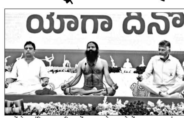
चुटनों से सम्बंधित चालन क्रियाओं का अभ्यास कराया गया, तत्पश्चात खड़े होकर करने वाले आसनों में ताडासन, वृक्षासन, पादहस्तासन, अर्ध चक्रासन और त्रिकोणासन, बैठकर करने वाले आसनों में भद्रासन, वज्रासन, अर्ध उष्ट्रासन, शशाकासन और उत्तान मंडूकासन। प्रेम के बल लेटकर करने वाले आसनों में मकरासन, भुजंगासन और शलभासन, पीठ के बल करने वाले आसनों में सेतुबंधासन, उत्तानपादासन, अर्ध हलासन और पवनमत्स्यासन का अभ्यास कराया। अंत में प्राणायाम और ध्यान के लिए अनुलोम-विलोम, भ्रामरी, और ध्यान व संकल्प का अभ्यास कराया गया।

विजयवाड़ा। योगरूढ़ि स्वामी रामदेव ने आंध्रप्रदेश के अमरावती (विजयवाड़ा) में कृष्णा नदी क्षेत्र से योगमय राष्ट्र व योगमय विश्व का आव्हान किया। यह कार्यक्रम पतंजलि योगपीठ तथा आंध्र प्रदेश सरकार के संयुक्त तत्वाधान में हुआ था। जिसमें आचार्य बालकृष्ण महाराज भी उपस्थित रहे। इस वर्ष योग दिवस की थीम "स्वस्थ आयु के लिए योग" रही। वृत्तों का कार्यक्रम प्रातः 5 बजे से प्रारंभ हो गया था, किंतु सरकारी कार्यक्रम के योग प्रोटोकॉल अनुसार स्वामी रामदेव महाराज, आंध्र प्रदेश के मुख्यमंत्री एन. चंद्रबाबू नायडू एवं आचार्य बालकृष्ण महाराज ने 45 मिनट की मानकीकृत योग दिनचर्या का अनुपालन करते हुए लगभग हजारों योग साधकों को योग का अभ्यास कराया। प्रारंभ में प्रार्थना, ग्रीवा, कंधा, कमर और