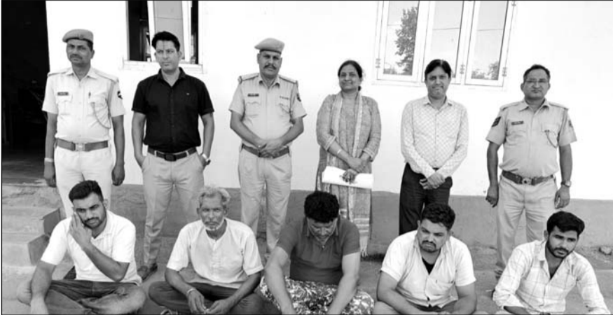
नसीराबाद पुलिस ने टैंकरों से अवैध रूप से गैस रिफिलिंग मामले में पांच जनों को हिरासत में लिया।