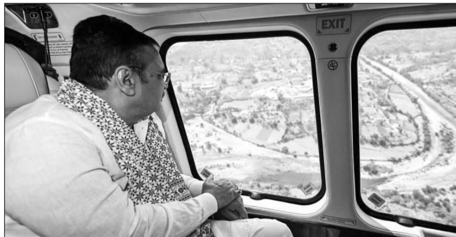
सीएम भजनलाल शर्मा ने देवास-3 एवं 4 पेयजल परियोजना का हवाई सर्वे किया।