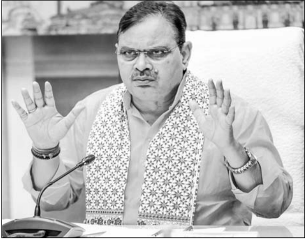
मुख्यमंत्री भजनलाल शर्मा ने राजिग राजस्थान के संबंध में आर्थिक क्षेत्र के प्रबुद्धजनों के साथ बैठक की।

जयपुर। मुख्यमंत्री भजनलाल शर्मा ने कहा कि राजिग राजस्थान ग्लोबल इन्वेस्टमेंट समिट से राजस्थान में उद्योगों को एक नई दिशा मिलेगी तथा सभी के सहयोग से इस समिट को सफल बनाते हुए राज्य में निवेश का सकारात्मक माहौल तैयार जा रहा है। शर्मा गुरुवार को मुख्यमंत्री निवास पर राजिग राजस्थान के संबंध में आर्थिक क्षेत्र के प्रबुद्धजनों के साथ आयोजित बैठक को संबोधित कर रहे थे। उन्होंने कहा कि राज्य में विपुल प्राकृतिक संसाधन की उपलब्धता के चलते निवेश की अपार संभावनाएं हैं। उन्होंने कहा कि पिछली सरकार के एमओयू धरातल पर नहीं उतरा। हमने अपने कार्यकाल के पहले ही वर्ष में राजिग राजस्थान समिट करने का निर्णय लिया है जिससे प्रदेश उद्योगों के क्षेत्र में अग्रणी बन सके।