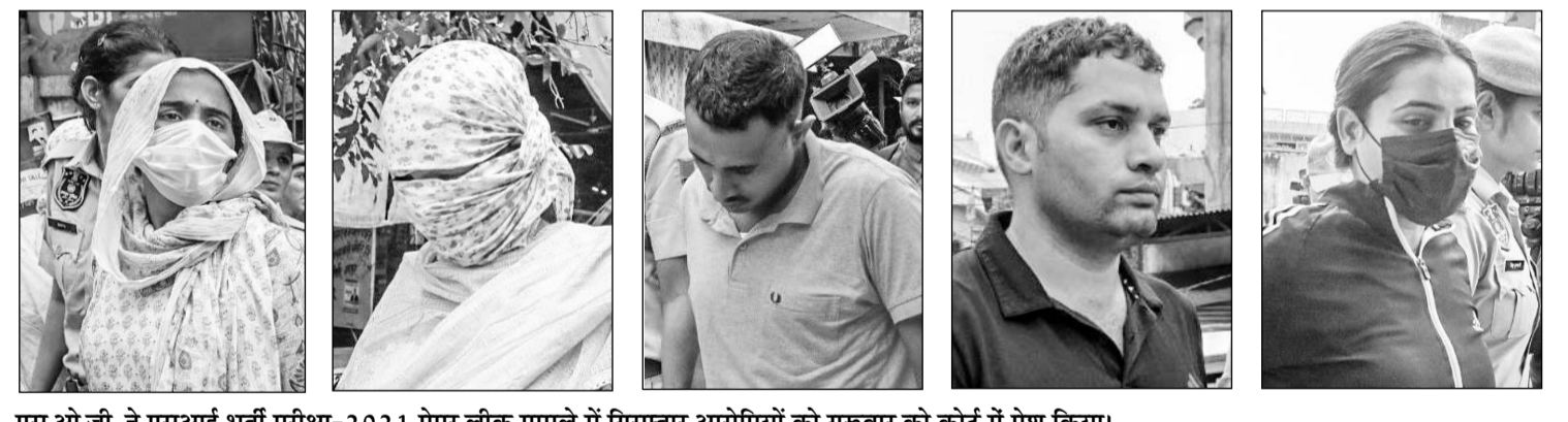
एस.ओ.जी. ने एसआई भर्ती परीक्षा-2021 पेपर लीक मामले में गिरफ्तार आरोपियों को गुरुवार को कोर्ट में पेश किया।