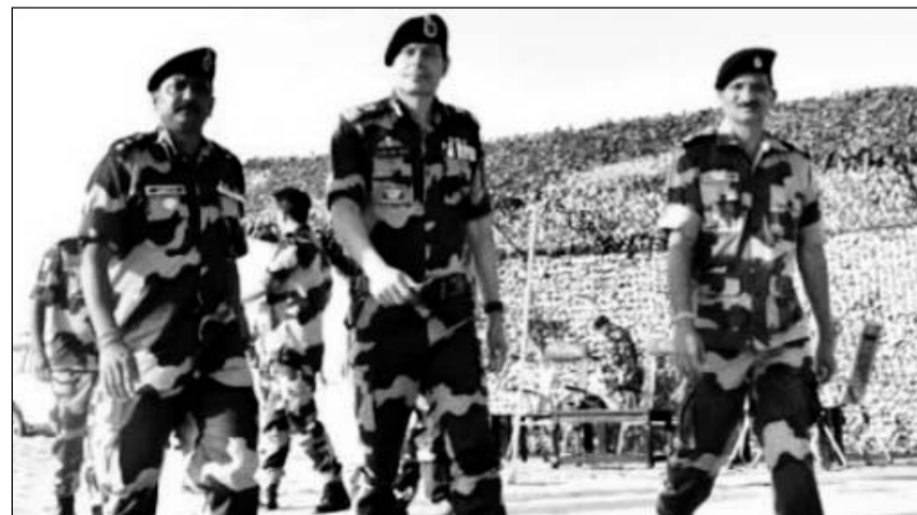
सीमा सुरक्षा बल के डीजी दलजीत सिंह चौधरी दो दिवसीय राजस्थान फ्रंटियर के दौरे पर जैसलमेर पहुंचे।