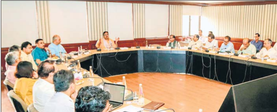
मुख्यमंत्री भजनलाल शर्मा ने गृह विभाग की समीक्षा बैठक ली तथा अधिकारियों को प्रदेश की सुरक्षा व्यवस्था चाक चौबंद बनाने के निर्देश दिए।

जयपुर, 10 अक्टूबर। मुख्यमंत्री भजनलाल शर्मा ने निर्देश दिए कि प्रदेश में कानून व्यवस्था को चाकचौबंद बनाए रखने के लिए पुलिस पूरी सतर्कता और मुस्तेदी के साथ काम करे। उन्होंने कहा कि कानून का इकबाल बुलंद रखना राज्य सरकार की प्राथमिकता है और इसे सुनिश्चित करना पुलिस की जिम्मेदारी है। उन्होंने महिलाओं एवं अनुसूचित जाति-जनजाति वर्ग के प्रति अपराधों में कमी लाने के लिए पुलिस तंत्र को हौसला अफजाई की। वहीं, साइबर अपराध और अवैध नशे के कारोबार में लिप्त अपराधियों से सख्ती से निपटने के निर्देश दिए।