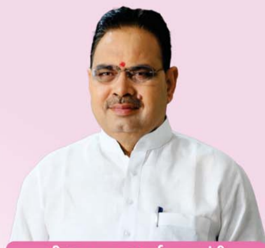
श्री भजनलाल शर्मा, मुख्यमंत्री

आपके क्षेत्र में कोई व्यक्ति इस कार्य में लिप्त है तो टोल फ्री नं. 104/108 या वाट्सएप नं. 9799997795 पर शिकायत दर्ज कराएं, मुखबिर की पहचान गोपनीय रखी जाएगी