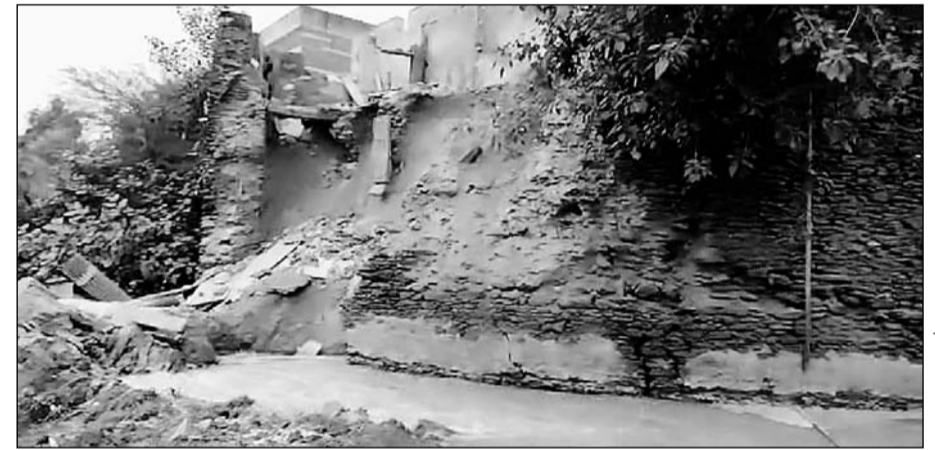
उनियारा के परकोटे का ढहा हुआ हिस्सा।

चारों तरफ पानी होने से खातोली गेट के पास के मकानों में आई दरारें