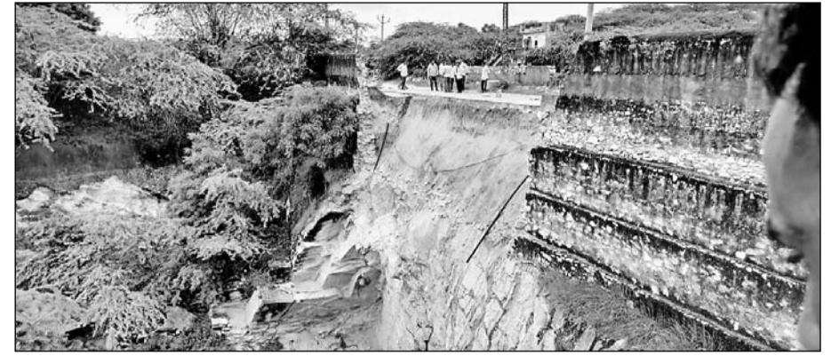
मार्बल खदान में गिरा मलबा जिसमें मजदूर दब गए।

चावंडिया मार्ग पर स्थित ब्राउन खान का रास्ता मार्बल खदान में गिरा