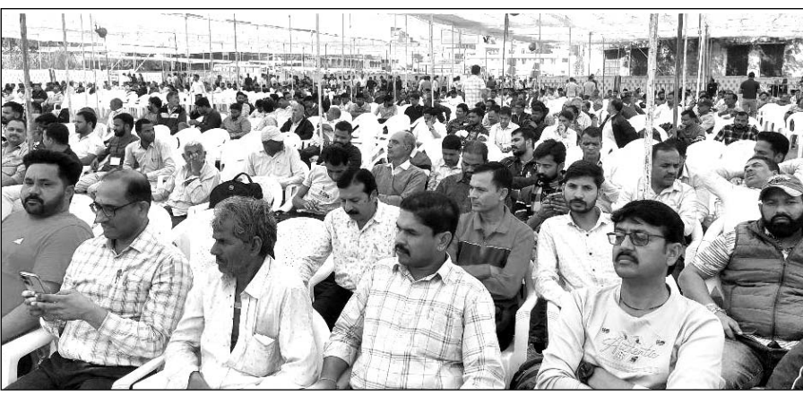
राजकीय फतह उच्च माध्यमिक विद्यालय परिसर में प्रशिक्षण प्राप्त करते मतदान दल।

हो गया। दलों ने बूथों पर भारत निर्वाचन आयोग की गाइड लाइन के अनुरूप आवश्यक व्यवस्थाएं सुनिश्चित की। मतदान 13 नवम्बर को सुबह 7 बजे से प्रारंभ होगा। इससे पूर्व प्रत्याशियों के अधिकृत प्रतिनिधियों की उपस्थिति में मॉक वोट हुआ। मतदान दलों के अंतिम प्रशिक्षण सत्र को संबोधित करते हुए जिला निर्वाचन अधिकारी पोसवाल ने कहा कि भारत की निर्वाचन प्रक्रिया दुनिया के लिए अध्ययन का विषय रही है। मतदान कर्म पूर्ण आत्मविश्वास के साथ कार्य करें तथा निष्पक्ष और पारदर्शी निर्वाचन प्रक्रिया संपन्न कराते हुए लोकतंत्र को मजबूत प्रदान करें। उन्होंने कर्मियों को चुनाव आयोग के दिशा-निर्देशों को अवश्य पालना सुनिश्चित करने तथा चुनाव प्रक्रिया को दूषित करने वाली गतिविधियों से दूर रहते हुए