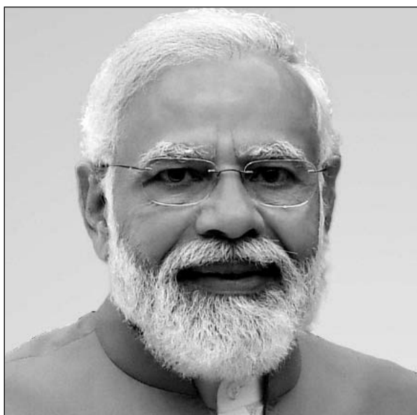
प्रधानमंत्री नरेन्द्र मोदी

महान समाज सुधारक महात्मा फुले का जीवन नैतिक साहस, आत्म चिंतन और समाज के हित के लिए अटूट समर्पण का प्रेरक उदाहरण है