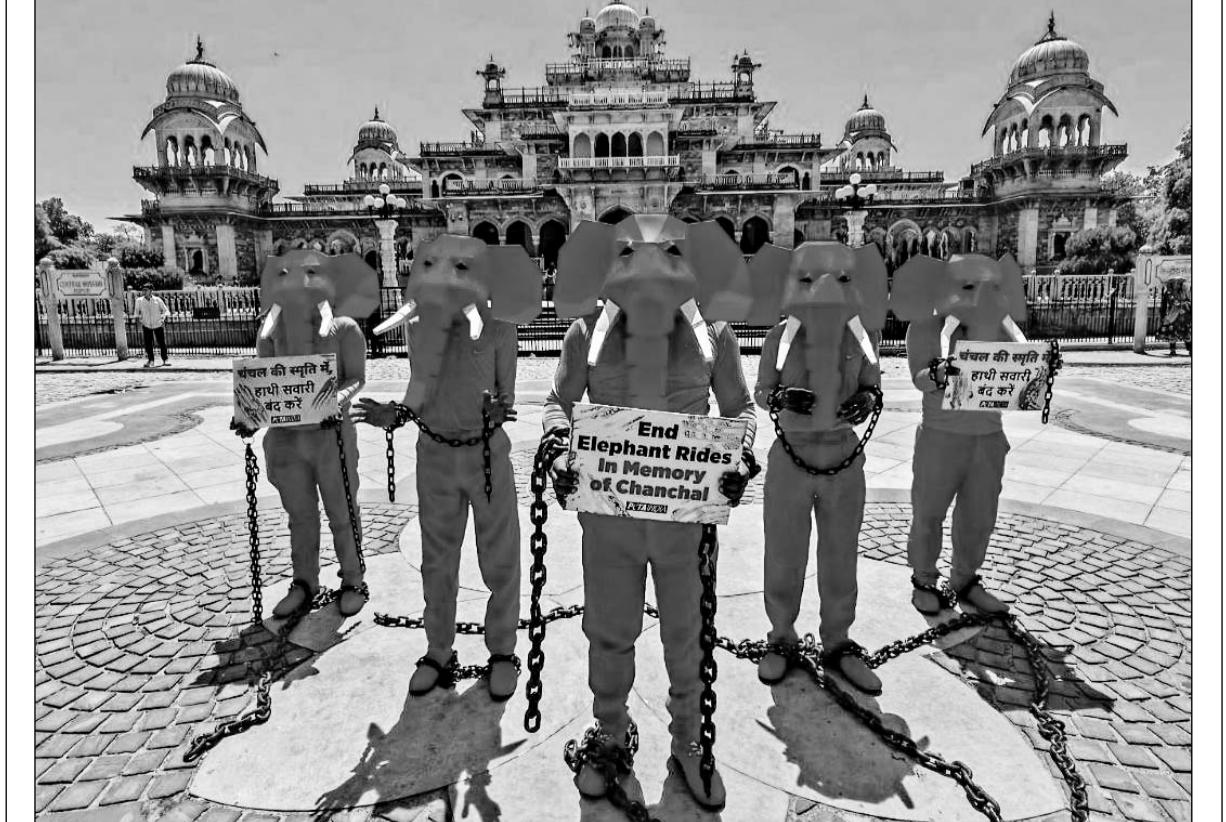
राजधानी जयपुर में हथिनी चंचल को गुलाबी रंगने और उसके बाद विदेशी फोटोग्राफर द्वारा फोटोशूट किये जाने के विरोध में शुक्रवार को घेरा द्वारा अलबर्ट हाल पर प्रदर्शन किया गया। ज्ञात रहे कि यह फोटोशूट करीब 1 साल पहले हुआ था, हथिनी चंचल की मौत भी हो चुकी है। पिछले दिनों जब यह तस्वीरें सोशल मीडिया पर सामने आयी थी, उसके बाद जपकर विवाद उपजा था।