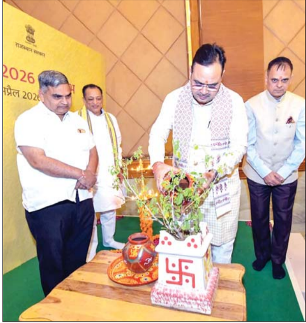
मुख्यमंत्री भजनलाल शर्मा ने शुक्रवार को राज्य ग्लोबल राजस्थान एग्रीटेक (ग्राम- 2026) मीट के कर्टेन रेज़र कार्यक्रम का संबोधित किया। उन्होंने कहा कि ग्राम-2026 एक ऐसा मंच होगा, जहाँ किसान, वैज्ञानिक, निवेशक और नीति निर्माता मिलकर किसानों के सशक्तीकरण के लिए संवाद करेंगे। इस मीट के माध्यम से कृषि और उससे जुड़े सेक्टर पर एकेडमिक-संस्थागत एवं

जयपुर, 10 अप्रैल। मुख्यमंत्री भजनलाल शर्मा ने कहा कि अन्नदाता किसान मजबूत होगा तो देश-प्रदेश आगे बढ़ेगा। हमारी सरकार राज्य के किसानों की आय बढ़ाने के लिए कृषि का सुदृढ़ इकोसिस्टम विकसित करने के लिए कृतसंकल्प है। इसी क्रम में जयपुर में 23 से 25 मई तक आयोजित होने वाले ग्लोबल राजस्थान एग्रीटेक मीट (ग्राम- 2026) का आयोजन हो रहा है, जिसमें प्रदेशभर के किसानों को खेती के नवीनतम आधुनिक तरीकों की जानकारी मिलेगी। उन्होंने कहा कि “ग्राम” के व्यापक प्रचार-प्रसार के लिए 15 अप्रैल से ग्राम प्रचारित स्तर पर किसान कल्याण से जुड़ी योजनाओं को लेकर रथ भेजे जाएंगे, जिससे किसान लाभान्वित हो सकें। इनमें सुझाव पेटिका भी रखी जाएगी, जिससे किसान योजनाओं से जुड़े अपने सुझाव भी दे सकें।