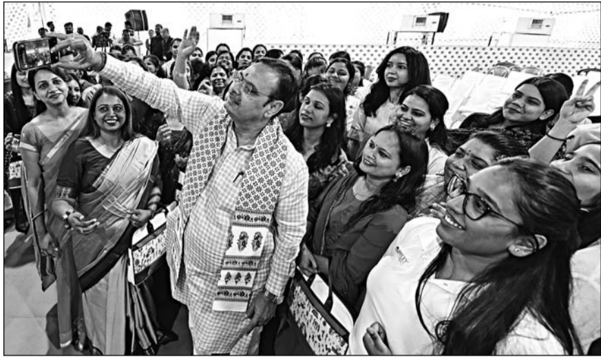
मुख्यमंत्री आवास पर आयोजित नारी शक्ति वंदन कार्यक्रम में पहुंची महिलाओं और छात्राओं के साथ सीएम भजनलाल शर्मा ने मोबाइल में सेल्फी ली।

जयपुर (कांस)। मुख्यमंत्री भजनलाल शर्मा ने कहा कि यशस्वी प्रधानमंत्री नरेंद्र मोदी के नेतृत्व में विकसित भारत के संकल्प के साथ देश आगे बढ़ रहा है और नारी शक्ति इसके केंद्र में है। केंद्र सरकार ने नारी शक्ति वंदन अधिनियम के माध्यम से विधानसभा और लोकसभा में महिलाओं के लिए 33 प्रतिशत आरक्षण का मार्ग प्रशस्त किया है। इससे इनकी राजनीति में अधिक से अधिक भागीदारी सुनिश्चित होगी। उन्होंने कहा कि हमारी डबल इंजन सरकार ने महिला सशक्तिकरण को जीवन के प्रत्येक पहलू से जोड़ा है। उन्होंने महिलाओं को प्रोत्साहित करते हुए कहा कि आप अपने सपनों को पंख दीजिए, हमारी सरकार आपके साथ खड़ी है। शर्मा शुक्रवार को मुख्यमंत्री आवास पर आयोजित नारी शक्ति वंदन कार्यक्रम को संबोधित कर रहे थे।