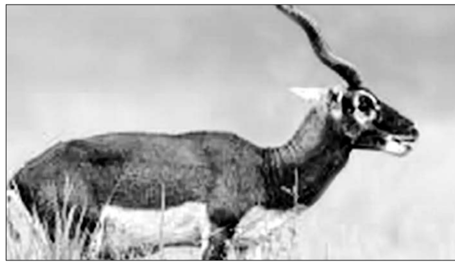
हनुमानगढ़ में वन भूमि में विचरण करते हिरण।

इसी तरह जिले में गत गणना रिपोर्ट के अनुसार 822 जरख, 304 मसूआ बिल्लियाँ, 537 लोमड़ी, 3533 रोड़ड़ा, 2450 चिकरा, काला हिरण 1323 आदि विचरण कर रहे हैं। जंगली जीवों की बढ़ रही संख्या से जैव विविधता को बढ़ावा मिल रहा है। वहीं वन विभाग की ओर से किए जा रहे प्रयास भी अहम हैं। जिला मुख्यालय के नजदीक कोहला वन क्षेत्र में गत एक दशक में पौधरोपण का कार्य बढ़े स्तर पर किया गया है। इसके अलावा वन क्षेत्रों में पौध भी बनाए गए हैं। वन्यजीवों के निवास को लेकर उचित माहौल मिलने की वजह से इन्हें यहां का हवा-पानी रास आ रहा है। यह उम्मीद लगाई जा रही है कि वर्ष 2024 में होने वाली वन्यजीवों की गणना के