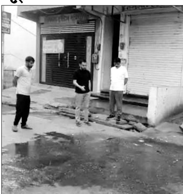
पाइप लाइन लिकेज को सही करने के निर्देश देते जिला कलेक्टर।