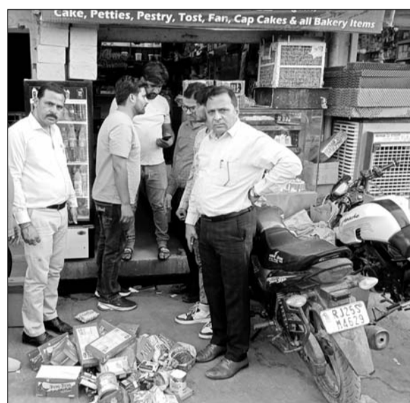
बेकरी की दुकान का निरीक्षण करती खाद्य सुरक्षा टीम।

वही सभी व्यापारियों की समझाइश भी की गयी कि वे अपने सभी उत्पादों पर डेट ऑफ पैकिंग व बेस्ट बिफोर अवश्य अंकित करें।