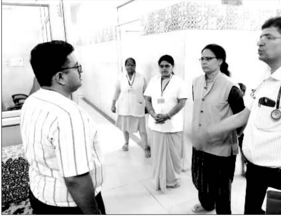
करोली जिला अस्पताल का कलेक्टर नीलाभ सक्सेना ने निरीक्षण किया।

करोली( नि.स.)। जिला कलेक्टर नीलाभ सक्सेना ने बुधवार को नवीन जिला चिकित्सालय एवं मातृ एवं शिशु स्वास्थ्य ईकाई का आकस्मिक निरीक्षण किया।