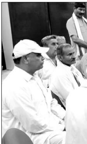
अखिल भारतीय किसान सभा के पदाधिकारियों ने एडीएम प्रशासन को अपनी समस्याओं के समाधान की मांग के लिए ज्ञापन दिया

भरतपुर (निस)। अखिल भारतीय किसान सभा के जिला एवं तहसील पदाधिकारियों ने भरतपुर कलैक्ट्रेट के गेट से लेकर कलेक्टर कार्यालय तक नारे लगाते हुए एडीएम प्रशासन को ज्ञापन दिया, जिसमें मुख्य रूप से ईआरसीपी (पूर्वी राजस्थान कैनाल प्रोजेक्ट) को अविलम्ब चालू कराने, सभी फसलों के एम.एस.पी. पर खरीद कराने, जिसमें कोई सीमा निर्धारित नहीं हो, किसानों की पूर्ण कर्मामफी, आवाय पशुओं, जानवरों एवं पशुओं से निजात दिलाने, भरतपुर क्षेत्र के तुहिया, सोगर, जधीना, जिरोली, हथेनी, नौगाया, गांवडी, इकरन, फुलवारा आदि सभी गांवों से पक्के नाले बनवाकर सीएफसीडी में पानी डलवाने, जिले के गांव खेरिया जाट, सैदपुरा, खुडासा आदि सहित जिन गांवों में आग लग जाने से किसानों का भारी नुकसान हुआ है, उसका समुचित मुआवजा दिलाये जाने सहित विभिन्न किसान समस्याओं का ज्ञापन दिया और प्रशासन के सामने किसान नेताओं ने दृढ़ता से बात रखते हुए कहा कि हमारे संगठन द्वारा पिछले लम्बे अरसे से किसानों की समस्याएं उठायी गयी हैं।