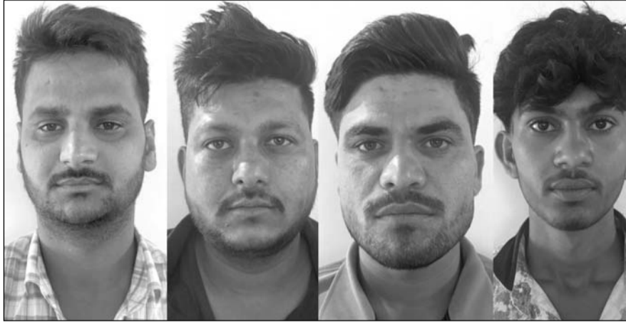
बरोनी पुलिस ने अपहरण करने के आरोपियों को गिरफ्तार किया।