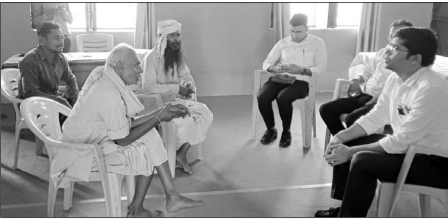
कुशलगढ़ प.समिति में आयोजित जनसुनवाई में ग्रामीणों की समस्याएं सुनते जिला कलेक्टर।

सुनकर संबंधित अधिकारियों को त्वरित समाधान के निर्देश दिए। जनसुनवाई में 10 से भी अधिक परिवार दर्ज किये गए। उन्होंने ग्रामीणों से रुबरु होकर उनकी समस्याओं को सुना और समाधान करवाया। जनसुनवाई के बाद जिला कलेक्टर ने कुशलगढ़ क्षेत्र के विभिन्न गांवों का दौरा भी किया। कलेक्टर ने