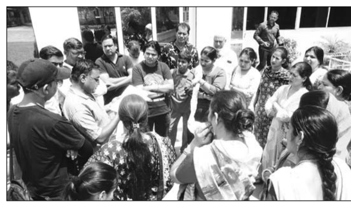
राजधानी जयपुर के श्याम नगर इलाके में “ट्री हाऊस हाई स्कूल” तीसरे दिन गुरुवार को भी बंद रहा, जिसे लेकर अभिभावकों ने कड़ई नाराजगी जताई।

-कार्यालय संवाददाता- जयपुर। राजधानी जयपुर के श्याम नगर इलाके में “ट्री हाऊस हाई स्कूल” तीसरे दिन गुरुवार को भी बंद रहा। बच्चों और अभिभावक स्कूल तो पहुंचे, लेकिन अध्यापन कार्य नहीं हुआ। ऐसे में दिनभर अभिभावकों ने स्कूल सुचारू करने को लेकर प्रिंसिपल से माथापच्ची की, लेकिन प्रिंसिपल ने साफ मना कर दिया कि फिलहाल स्कूल संचालित नहीं हो पायेगा।