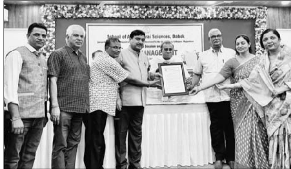
विद्यापीठ में तनाव प्रबंधन पर विशेष सेमिनार का आयोजन हुआ।