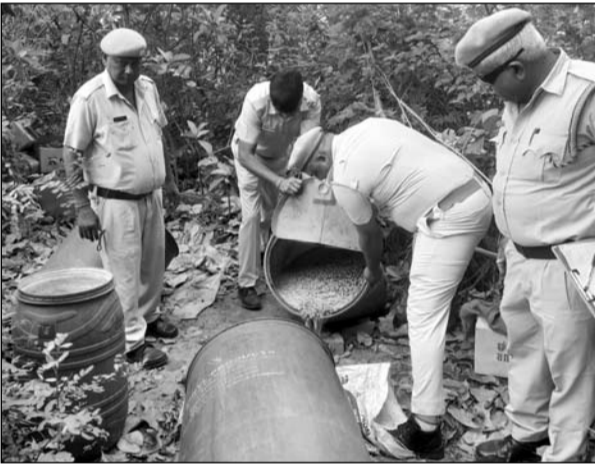
आबकारी निरोधक टीम ने वांश नष्ट कर शराब जब्त की।