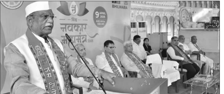
राज्यपाल बागड़े ने भीलवाड़ा में आयोजित विश्व नवकार महामंत्र दिवस समारोह को संबोधित किया।

इस दौरान राज्यपाल बागड़े ने कहा कि नवकार महामंत्र विश्व के प्राचीनतम एवं पावन मंत्रों में से एक है, जो अहिंसा, अपरिग्रह एवं अनेकतावाद जैसे सिद्धांतों पर आधारित है। यह मंत्र न केवल आध्यात्मिक उन्नति का मार्ग प्रशस्त करता है, बल्कि समाज में शांति, समृद्धि एवं सुशांति का भी संदेश देता है। वर्तमान वैश्विक परिस्थितियों में इसकी प्रासंगिकता और भी अधिक बढ़ गई है। राज्यपाल बागड़े ने जैन धर्म की महान परंपरा का उल्लेख करते हुए कहा कि