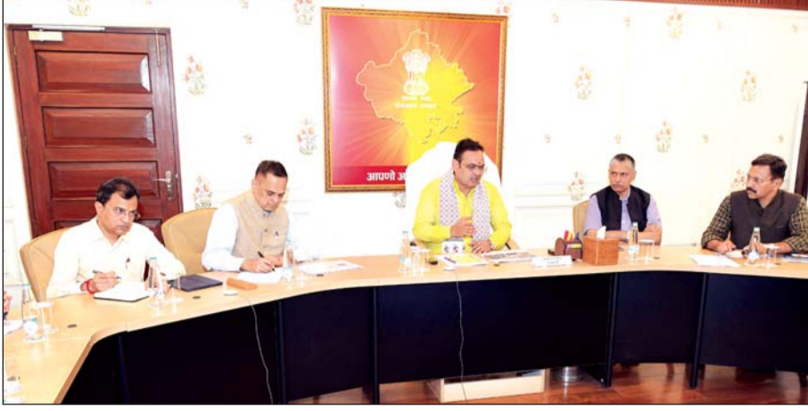
मुख्यमंत्री भजनलाल शर्मा ने गुरुवार को मुख्यमंत्री कार्यालय में जयपुर मेट्रो रेल परियोजना की प्रगति को लेकर अधिकारियों की बैठक की।

(मानसरोवर-अजमेर रोड चौराहा) की परियोजनाओं को गति देने के भी निर्देश दिए। मुख्यमंत्री शर्मा ने जनसंख्या घनत्व एवं ट्रैफिक के दबाव को ध्यान में रखते हुए भविष्य में दिल्ली रोड एवं