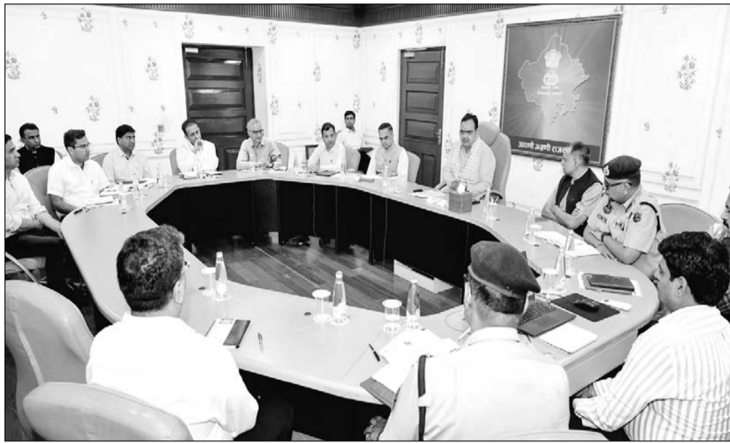
मुख्यमंत्री भजनलाल शर्मा ने गुरुवार को जयपुर शहर के यातायात सुधार के लिए अधिकारियों की उच्चस्तरीय बैठक ली।

मुख्यमंत्री भजनलाल शर्मा ने जेडीए, परिवहन, ट्रैफिक पुलिस और नगर निगम को दिए निर्देश