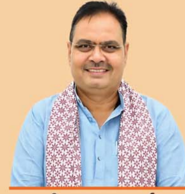
श्री भजनलाल शर्मा माननीय मुख्यमंत्री

माननीय प्रधानमंत्री श्री नरेन्द्र मोदी जी का हार्दिक आभार