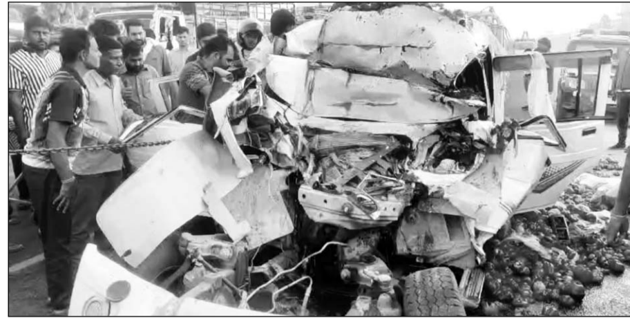
हादसे के बाद स्थानीय लोगों ने तत्परता दिखाते हुए पिकअप में फंसे चालक को बाहर निकाला।

चौमूं/जयपुर। चौमूं थाना क्षेत्र में जयपुर-सीकर हाईवे स्थित राधा स्वामी बाग चौराहे पर शनिवार सुबह एक तेज रफ्तार पिकअप और स्लीपर बस के बीच भीषण टक्कर हो गई। हादसा इतना जोरदार था कि सब्जियों से लदी पिकअप के परखच्चे उड़ गए और चालक वाहन में ही बुरी तरह फंस गया। घटना के बाद मौके पर अफरा-तफरी और चीख-पुकार मच गई।