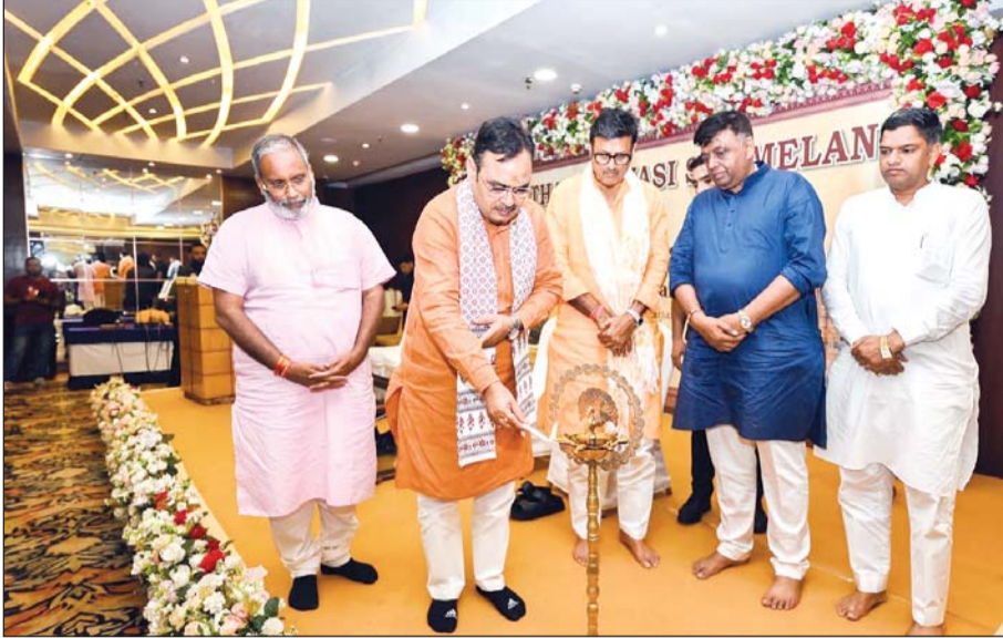
मुख्यमंत्री भजनलाल शर्मा ने शनिवार को कोलकाता में आयोजित राजस्थान प्रवासी सम्मेलन का उद्घाटन किया।

मुख्यमंत्री भजनलाल ने पहले कालीघाट मंदिर में विधि-विधान से पूजा-अर्चना की। फिर बेलीगंज स्थित गोविन्दम इस्कॉन मंदिर में राधा-कृष्ण के दर्शन किए व पूजा की।