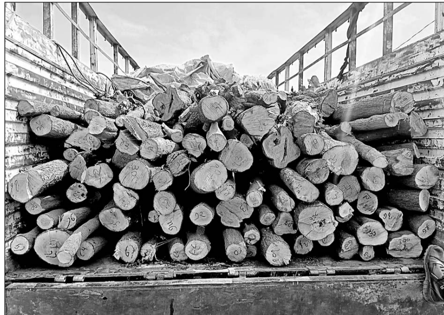
बरोनी पुलिस थाने में जब्त चंदन की लकड़ियों से भरा हुआ मिनी ट्रक।