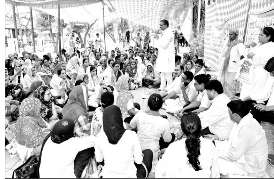
दुष्कर्म मामले को लेकर जिलेभर के नर्सिंगकर्मियों ने कलेक्ट्रेट के सामने प्रदर्शन किया।

सुजानगढ़ क्षेत्र में कार्यरत एनएम से दुष्कर्म मामले में जिलेभर के एनएम सहित कर्मचारी संगठनों में आक्रोश