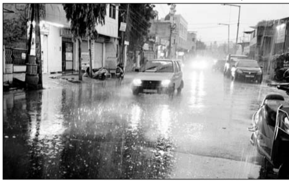
उदयपुर में आयड़ क्षेत्र में बारिश से पानी के बीच में से निकलते वाहन।

लेकसिटी में रविवार की तरह सोमवार को भी सुबह से मौसम में उमस चुली गई। भारी उमस के बीच बीते पूरे दिन के बाद शाम करीब 6.30 बजे अचानक छाप घने बादलों ने खड्ड वर्षा के रूप में बरसना शुरू किया और शाम को शहर के कई इलाकों में मध्यम क्रम की बारिश हुई। मौसम विभाग डबोक से