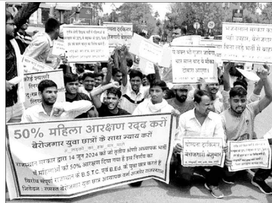
अजमेर कलेक्ट्रेट पर मांगों को लेकर बेरोजगार युवाओं ने प्रदर्शन किया।

सशक्तिकरण के लिए प्रेरक है। बेरोजगार युवाओं ने चेतावनी दी कि अगर इस निर्णय को वापस नहीं लिया गया तो सभी पुरुष वर्ग धराल पर उतरकर गांव, शहरों में विरोध प्रदर्शन करेंगे। पुरुष वर्ग का रोजगार ही छीन लिया है, सभी को मानसिक तनाव देकर आत्महत्या करने के लिए मजबूर किया जा रहा है। बेरोजगार युवाओं ने कहा कि यह निर्णय बीएसटीसी धारक छात्र अध्यापकों को अवसाद प्रस्त करने के लिए मजबूर कर रहा है और परिणाम स्वरूप अधिकांश छात्र अध्यापक पुरुष वर्ग बेरोजगार रहकर सड़कों पर आ जाएंगे। उन्होंने कहा कि इस विषय पर सरकार को पुनः विचार करना चाहिए। सभी ने यही मांग कि आरक्षण बिल के निर्णय को वापस लिया जाए।