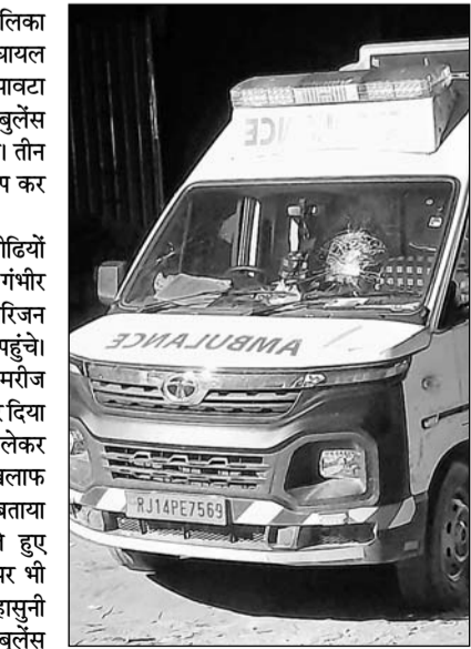
आक्रोशित लोगों ने एम्बुलेंस को क्षतिग्रस्त किया।

पावटा, (निसं)। पावटा- प्रागपुरा नगर पालिका क्षेत्र के सामुदायिक स्वास्थ्य केंद्र पर एक घायल मरीज ने तड़प-तड़प कर दम तोड़ दिया। पावटा सामुदायिक स्वास्थ्य केंद्र पावटा पर कुल 7 एंबुलेंस हैं। जिनमें से चार एंबुलेंस खराब स्थिति में हैं। तीन एंबुलेंस होने के बाद भी घायल ने तड़प तड़प कर दम तोड़ दिया।