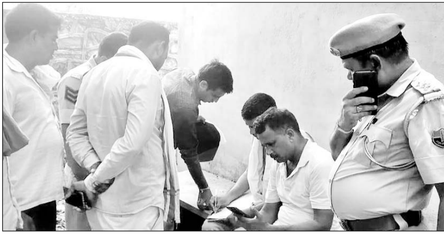
हादसे के बाद पुलिस ने हास्पिटल में पंचनामा तैयार किया।