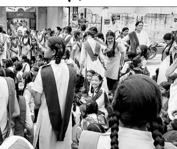
भीलवाड़ा के उपनगर पूर्व में परेशान छात्राओं ने स्कूल के मुख्य द्वार पर तालाबंदी की।

जानकारी के अनुसार छात्राओं का कहना था कि बारिश में जर्जर स्कूल के इस भवन में बैठना मुश्किल हो रहा है। स्कूल में ना तो शौचालय है और ना ही भवन की मरम्मत को लेकर स्कूल प्रबंधन की ओर से कोई व्यवस्था की जा रही है। इसी से