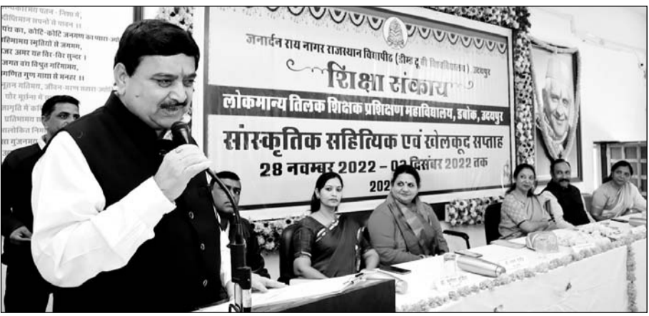
उदयपुर में लोकमान्य तिलक शिक्षक प्रशिक्षण महाविद्यालय का शुभारंभ हुआ।