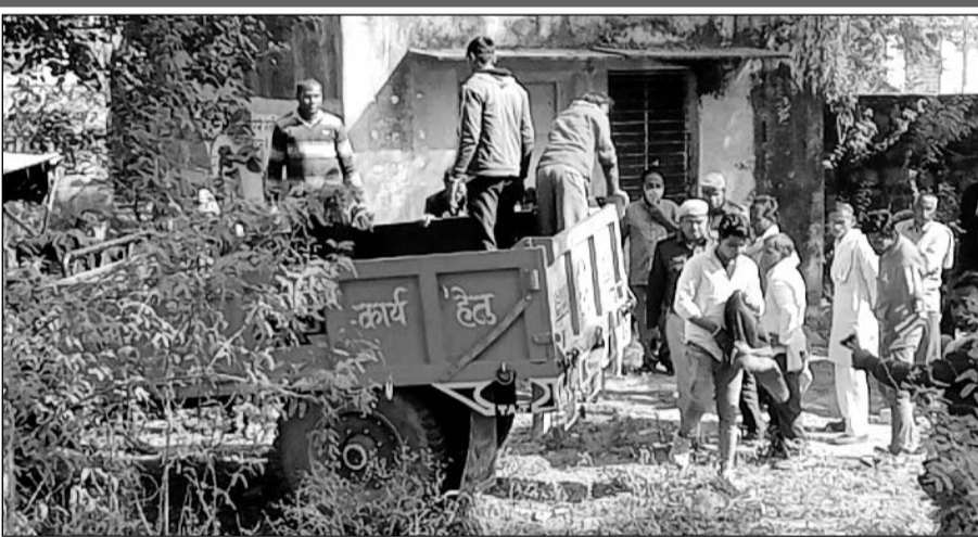
मृतक का सीएचसी पर पोस्टमार्टम कराती पुलिस।