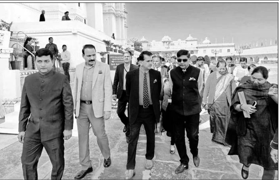
उदयपुर में होने वाली जी-20 शेरपा बैठक के प्रस्तावित कार्यक्रम स्थलों का भारत के शेरपा अमिताभ कांत व विदेश मंत्रालय के अधिकारियों ने जायजा लिया।

उदयपुर, (कास)। लेकसिटी में 5 से 7 दिसंबर तक आयोजित होने वाली जी-20 शेरपा बैठक की तैयारियां जोरें पर हैं। जी-20 की पहली बैठक उदयपुर में होने के कारण इसकी व्यवस्थाओं का जायजा लेने के लिए भारत के शेरपा अमिताभ कांत खुद विदेश मंत्रालय के आला अधिकारियों के साथ सोमवार को उदयपुर पहुंचे और दिनभर तैयारियों का जायजा लिया।