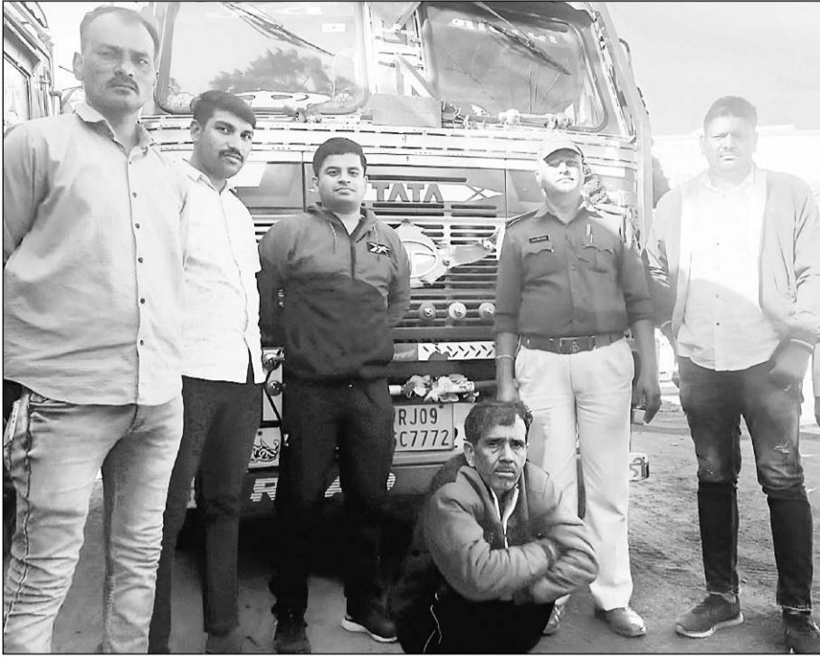
राजस्थान पुलिस की सीआईडी क्राइम ब्रांच ने मध्यप्रदेश के गुना इलाके में ट्रक चालक को गिरफ्तार कर उसके कब्जे से दो करोड़ रुपये की कीमत का गांजा भी जब्त किया।