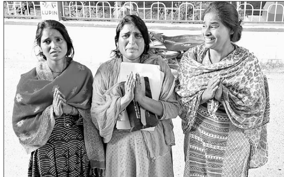
धौलपुर कलेक्टर से आवास की सुरक्षा की मांग करते परिवार के सदस्य।

गुलाब बाग धौलपुर में करीब 60 वर्ष पूर्व से रह रहा था बीपीएल परिवार