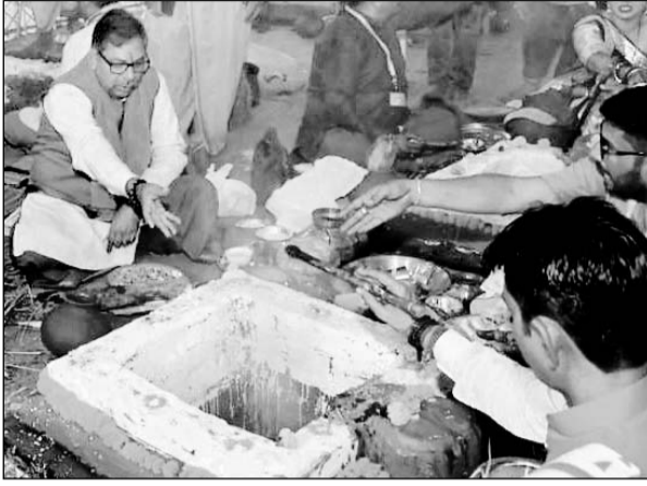
जनाक्रोश रैली की तैयारियों का जायजा लेने डूंगरपुर गए भाजपा प्रदेश अध्यक्ष डॉ. सतीश पूनिया ने बेणेश्वर धाम में श्री हरिमंदिर स्वर्ण शिखर प्रतिष्ठा महोत्सव में भाग लिया व महायज्ञ में भी शामिल हुए।

या तो जलने पर मजबूर होना पड़ा या उसको जला दिया, यह राजस्थान की कानून व्यवस्था की बानगी है, राजस्थान ऐसा लगता है कि अपराधों की राजधानी हो गया है। उन्होंने कहा, दूसरा बड़ा मसला है कि राहुल गांधी यहाँ यात्रा करने आ रहे हैं, लेकिन मैं उनसे एक सवाल पूछना चाहता हूँ कि आपने यह कहा था कि जब कांग्रेस सत्ता में आएगी तो 10 तक गिनती गिनने और राजस्थान के सारे किसानों का सारा कर्जा माफ कर देंगे। चार वर्ष हो गए, दिन तो 10 कहे थे, लेकिन 10 से भी कहीं ज्यादा 1700 दिन हो गए, लेकिन किसानों का कर्जा माफ नहीं किया। अब राजस्थान की धरती पर कदम रखें तो उस वादे को याद करें।