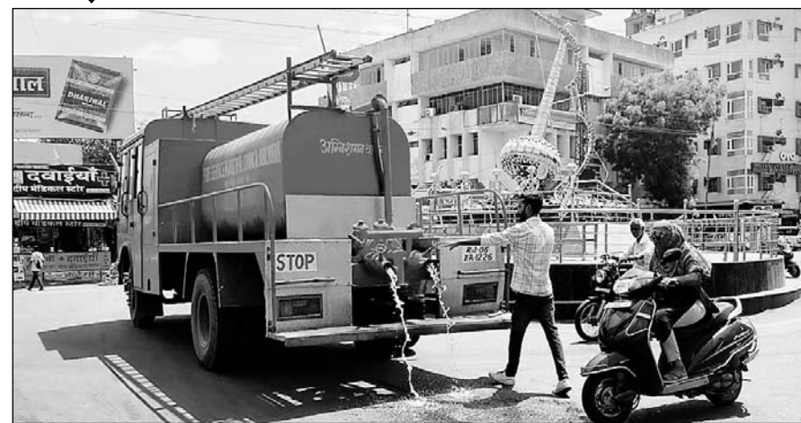
भीलवाड़ा में प्रशासन द्वारा शहर की सड़कों को टंडा रखने के लिए सड़कों पर फायर ब्रिगेड की मदद से पानी का छिड़काव करवाया जा रहा है।

नगर व्यास ने पंचांग के आधार पर बताया कि इस बार देशभर में अच्छी बारिश होगी। राजस्थान में मंडूकछाप यानी कहीं अधिक तो कहीं कम बारिश के योग्य बन रहे हैं। भीलवाड़ा में औसत बारिश होगी। फिलहाल औद्योगिक नगरी में पड़ रही भीषण गर्मी ने शहर की सड़कों को सूना कर दिया है। आमजन रोजमर्रा के कामों