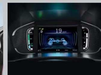
DIGITAL MULTI-INFORMATION DISPLAY