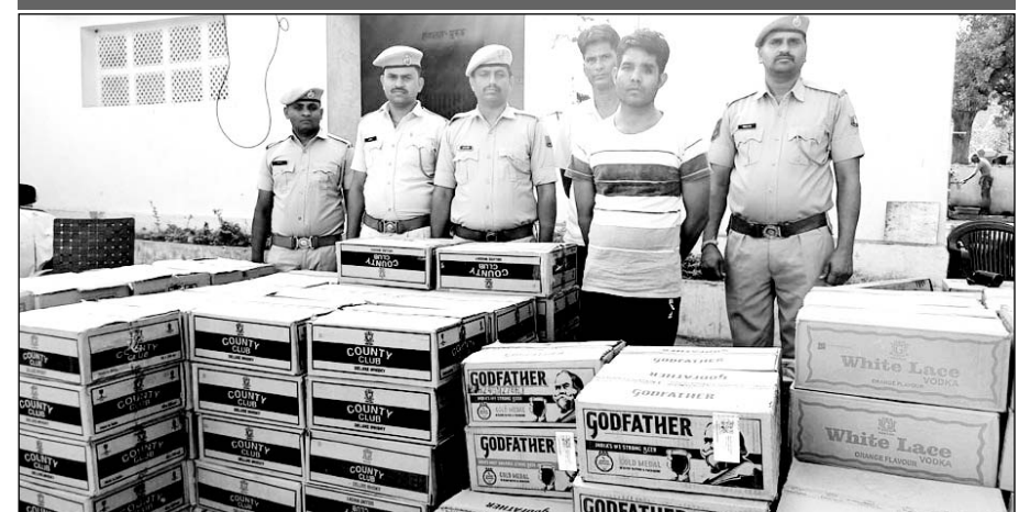
पुलिस ने शराब सहित तस्कर को गिरफ्तार किया।

लकड़ियों की आड़ में गुजरात ले जाई जा रही थी शराब