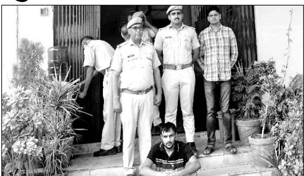
सिंधाना पुलिस ने युवक को गिरफ्तार कर गांजा बरामद किया।

■ पूछताछ में सामने आया कि आरोपी छत्तीसगढ़ से गांजा लेकर आया था