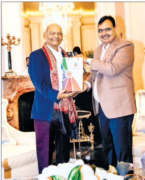
लंदन में मुख्यमंत्री भजनलाल से आज वेदांता समूह के चेयरमैन अनिल अग्रवाल ने मुलाकात की और राजस्थान में एक लाख करोड़ रु. के निवेश के लिए अपनी प्रतिबद्धता दोहराई।

मं होगा और इसके अलावा, लघु और मध्यम उद्योगों के लिए गैर-लाभकारी (नॉन प्रॉफिट) आधार पर वेदांता ग्रुप उदयपुर के पास एक औद्योगिक पार्क भी स्थापित करेगी। मुख्यमंत्री और अनिल अग्रवाल के बीच "पूछरी का लौठा" (गोवर्धन परिक्रमा से संबंधित एक महत्वपूर्ण