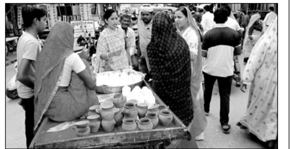
गंगापुर सिटी में करवा चौथ की पूर्व संध्या पर बाजार में करब खरीदती महिलाएं।

गंगापुर सिटी । करक चतुर्थी अर्थात करवाचौथ का व्रत लगभग देशभर में मनाया जाता है। जिला मुख्यालय सहित आसपास के गांवों में करवा चौथ त्यौहार सुहागिन महिलाओं द्वारा रविवार को मनाया जायेगा। कार्तिक कृष्ण चतुर्थी करवा चौथ को स्त्रियों द्वारा अखण्ड सोभाग्यवती पति की दीर्घायु एवं स्वास्थ्य मंगल कामना के लिए व्रत करती है एवं चन्द्रमा को अर्घ्य देकर व्रत पूर्ण करती है। करवा चौथ के त्यौहार को लेकर बाजार में करवों की सभी दुकानों पर महिलाएं दिनभर करवे खरीदती नजर आईं। भारतवर्षियों की भागीदारी से त्याग, आस्था, प्रेम और आपसी विश्वास का यह व्रत विश्व के कई देशों में पहुंच चुका है। दाम्पत्य जीवन के इस सबसे खुशबूरत व्रत की शुरुआत राजा-रजवाड़ों के प्रदेश राजस्थान से हुई है। यह कठना अतिशयोक्ति नहीं होगी कि राजस्थान की वीर जातियों ने हिंदू संस्कृति एवं सभ्यता को संवारे और समृद्ध करने में महती भूमिका निभाई है। इसी की एक कड़ी करक चतुर्थी यानि करवा चौथ पर ग्रामीण व शहरी क्षेत्र की महिलाएं सज धज कर चौथ बहानी के दरवार में पहुंची जहां पर वे विधि विधान से पूजा अर्चना कर अपने परिवार की खुशहाली की कामना करते हुए पति के दीर्घायु होने का वरदान मांगीं।