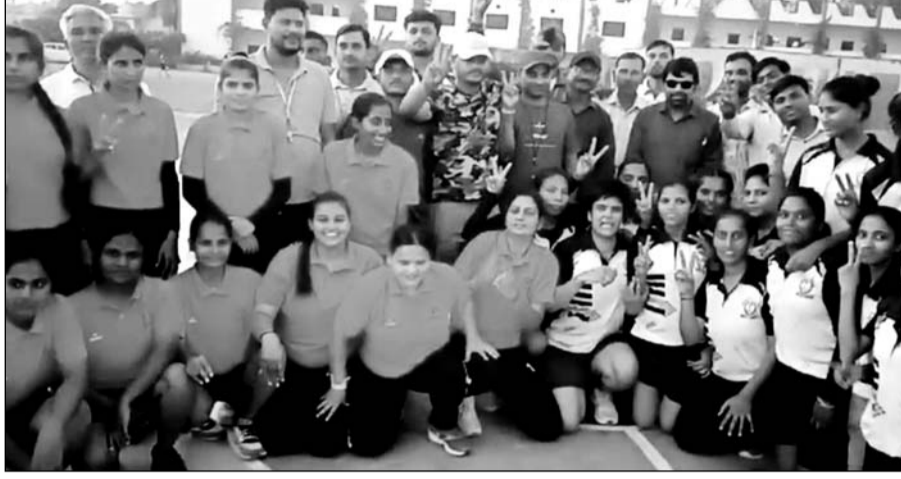
प्रतियोगिता में विजेता खिलाड़ी को सम्मानित किया।