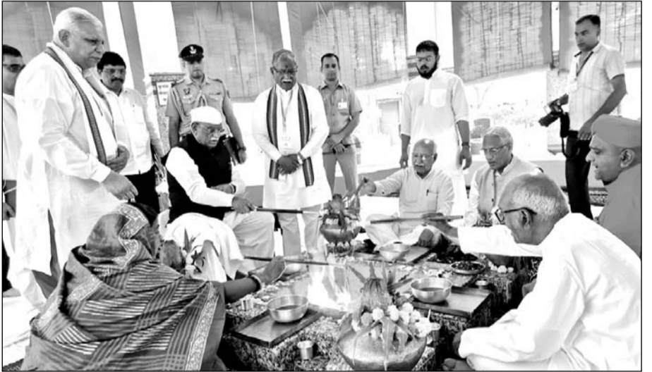
राज्यपाल हरिभाऊ किशनराव बागड़े ने ऋषि मेले में आयोजित यज्ञ में आहुति दी।

समारोह को संबोधित करते हुए राज्यपाल बागड़े ने कहा कि हमारा देश में अनेक धर्म व पंथ हैं और पूजा अर्चना के तरीके भी अलग हैं, लेकिन सभी का लक्ष्य एक ही होना चाहिए। उन्होंने कहा कि सनातन संस्कृति में गुरुकुल परंपरा हजारों साल चली आ रही है, लेकिन वर्तमान में धीरे-धीरे क्षीण होती जा रही है, गुरुकुल परंपरा को पुनः स्थापित कर पर जोर दिया। उन्होंने कहा कि आर्य समाज एक राष्ट्रवादी संस्था है और प्रारंभ से ही उसका लक्ष्य