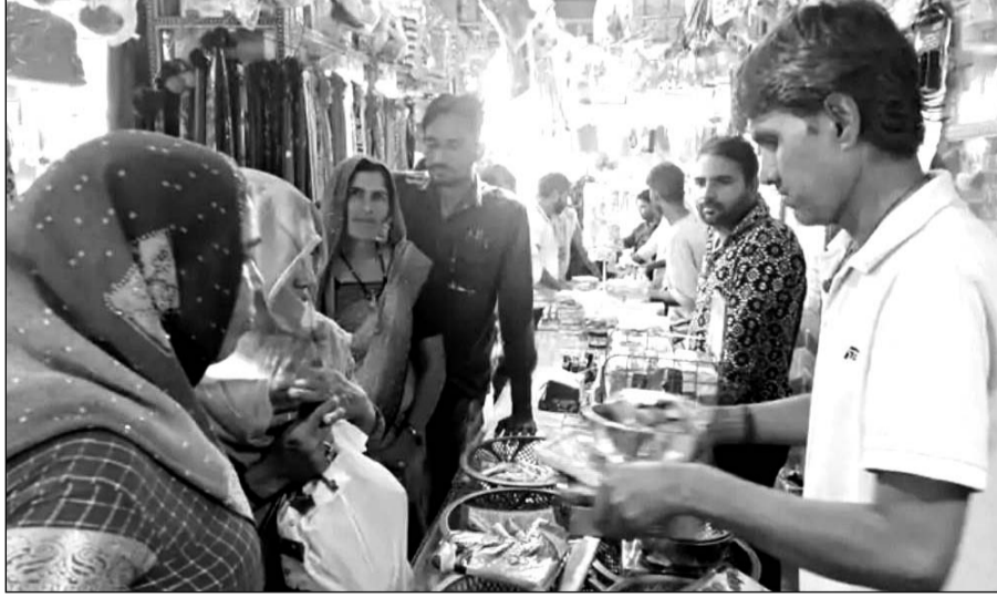
करवाचौथ को लेकर सुहागिन महिलाओं ने खरीददारी करते हुए।