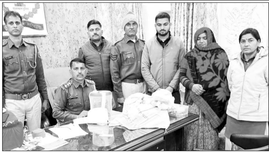
पुलिस ने एक महिला और एक पुरुष तस्कर को गिरफ्तार किया।

देवली, (निर्सं)। मादक पदार्थ के विरुद्ध चल रहे अभियान के तहत मंगलवार रात्रि को देवली थाना पुलिस ने स्मैक पाउडर की एक बड़ी खेप पकड़ी है। पुलिस ने मादक पदार्थ के विरुद्ध कार्रवाई करते हुए एक महिला और एक पुरुष तस्कर को चार लाख रुपए की राशि के साथ गिरफ्तार कर लिया है। पुलिस के अनुसार यह कार्रवाई पुलिस ने स्मैक परिवहन पर की है। यहाँ मादक पदार्थ के विरुद्ध कार्रवाई के दौरान मामला यह सामने आया कि पुलिस ने एक महिला और पुरुष तस्कर से 36 लाख 80 हजार रुपए की कीमत का स्मैक पाउडर जब्त किया है। यह कार्रवाई पिछले एक वर्ष में सबसे बड़ी कार्रवाई मानी जा रही है।