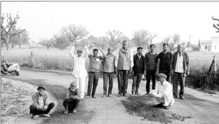
ग्रामीणों ने घटिया सामग्री का आरोप लगाते हुए विरोध प्रदर्शन किया।