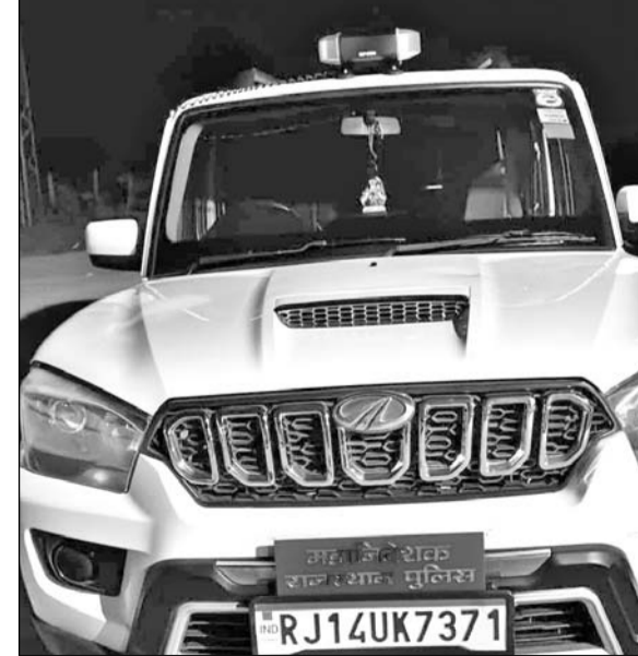
पुलिस थाने में जब्त गाड़ी।

बजरी के वाहनों से अवैध वसूली कर रहा था, लाल बत्ती लगी गाड़ी जब्त