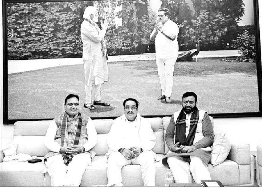
मुख्यमंत्री भजनलाल शर्मा ने यमुना जल के संबंध में केंद्रीय जलशक्ति मंत्री सी.आर. पाटिल के समक्ष हरियाणा के मुख्यमंत्री नायब सैनी के साथ चर्चा की।

जयपुर/नई दिल्ली। मुख्यमंत्री भजनलाल शर्मा ने कहा कि राजस्थान के शेखावाटी अंचल के किसानों को जल्द ही यमुना जल का लाभ मिल सकेगा। इस संबंध में केंद्रीय जलशक्ति मंत्री सी.आर. पाटिल के समक्ष हरियाणा के मुख्यमंत्री नायब सैनी के साथ आज चर्चा पूरी हो गई है। शर्मा ने कहा कि इस जल समझौते की जल्द क्रियान्वित के लिए दोनों राज्यों के अधिकारियों की एक ज्वाइंट टास्क फोर्स बनेगी, जो की डीपीआर पर काम करेगी।