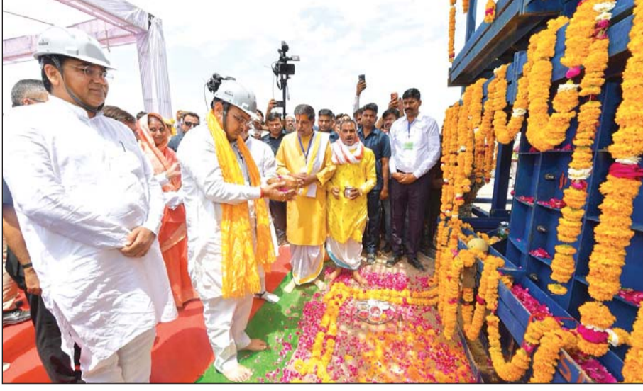
मुख्यमंत्री भजनलाल शर्मा ने बुधवार को बूंदी में राम जल सेतु लिंक परियोजना के अंतर्गत निर्माणाधीन चंबल एक्वाडक्ट के कार्यों का निरीक्षण किया।

कोटा/करौली/पुष्कर, (निसं)। मुख्यमंत्री भजनलाल शर्मा ने बुधवार को बूंदी जिले की इंद्रगढ़ तहसील स्थित गुहाटा गांव पहुंचकर राम जल सेतु लिंक परियोजना के अंतर्गत निर्माणाधीन चंबल एक्वाडक्ट के कार्यों का निरीक्षण किया। उन्होंने कहा कि राम जल सेतु लिंक परियोजना राज्य सरकार की अति महत्वाकांक्षी परियोजना है। इस परियोजना के माध्यम से पूर्वी राजस्थान के 17 जिलों में पेयजल एवं सिंचाई के लिए पर्याप्त जल उपलब्ध हो सकेगा।