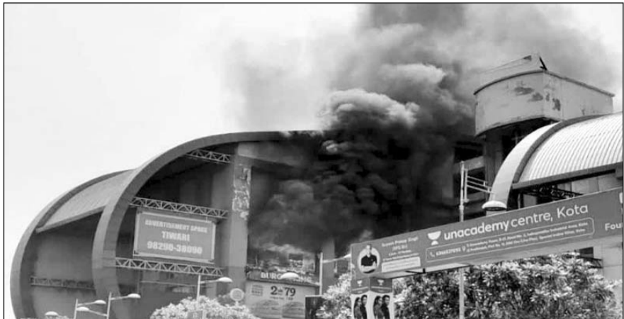
कोटा के सिटी मॉल में भीषण आग लगने के बाद दूर तक धुआं नजर आया।

कोटा, (निर्स)। झालावाड़ रोड स्थित कोटा के सिटी मॉल में बुधवार को आग लग गई। अचानक लगी इस आग से अफरा-तफरी का माहौल बन गया। सिटी मॉल कोचिंग परिया के बीच में ही स्थित है, ऐसे में सिटी मॉल के ठीक लगती वाली बिल्डिंग कोचिंग संस्थान की है। आनन-फानन में पूरे कोचिंग संस्थान को खाली करवाया गया है। बच्चों को बाहर निकाला गया। आग पर काबू पाने के लिए 15 दमकलों का इस्तेमाल किया गया। करीब दो घंटे के बाद आग पर काबू पाया गया।