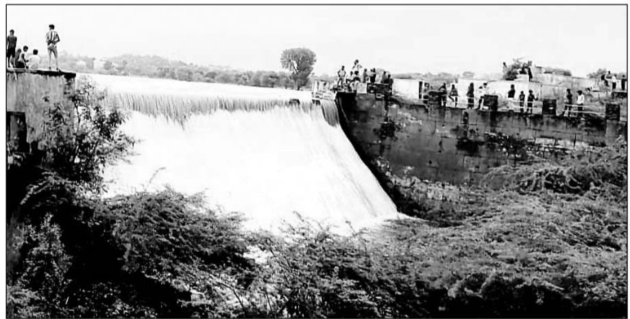
भीम तालाब की चादर चलने पर कस्बवासियों का सैलाब उमड़ा।

भीम, (निर्स)। उपखंड मुख्यालय स्थित 17 फीट की भराव क्षमता वाले भीम तालाब की चादर बुधवार सुबह ही शुरू हो गई। कस्बवासियों एवं आसपास के ग्रामीणों का कहना है कि देर से ही सही लंबे इंतजार के बाद बादलों ने क्षेत्रवासियों की पुकार सुनी ली, जिससे भीम का मुख्य तालाब अपनी भराव क्षमता 17 फीट तक लबालब हो गया। भीम का तालाब भरने से आमजन हर्षित है। पेयजल, कृषि, पशु तथा अन्य उपयोग हेतु लूणी नदी पर आश्रित रहते हैं। कस्बे में निरंतर चौधे दिन भी रिमझिम फुहारों के साथ मूसलाधार बारिश रुक-रुक होती रही, जिसका मार्केट पर असर देखने को मिला। दूसरी ओर जलदाय उपभोक्ताओं का दुर्भाग्य है कि नलों में काफी दिनों से सात-सात दिन तक पानी के दर्शन नहीं होते। विभाग के