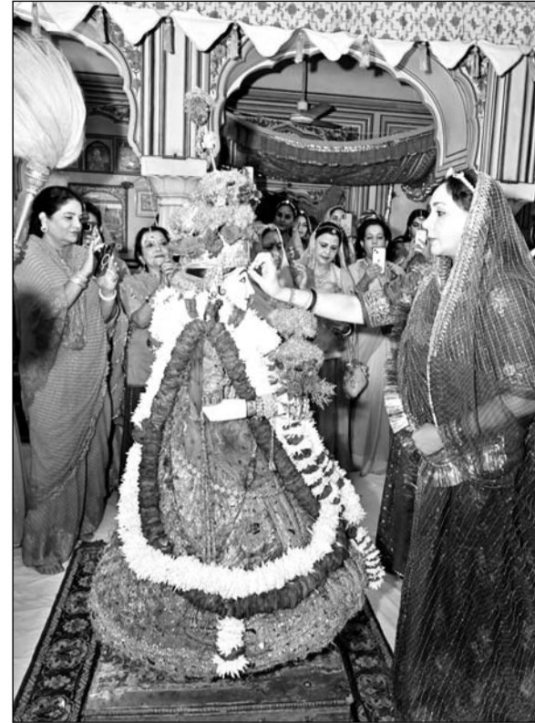
उप मुख्यमंत्री दीया कुमारी ने बुधवार को सिटी पैलेस स्थित जननी इयोदी में तीज माता की पारंपरिक पूजा-अर्चना की।

और भव्य बना दिया। शाही हाथी, सजे हुए ऊंट और उन पर सवार लंबी-लंबी मूँछ लहराते राजस्थानी वेशभूषा में पुरुष, घोड़े, शान से सजी हुई पालकिया, देवी देवताओं का रूप धारण किए हुए बहुरूपियों के साथ ही उछल कूद करते बन्दर रूपी बहुरूपिये दर्शकों में कोलाहल मचा रहे थे, कालबेलिया कलाकार, कच्छी घोड़ी, नर्तक, बैंड बाजों की स्वरलाहरियों के साथ लोक कलाकारों की मनोहारी प्रस्तुति और आतिशबाजी के आयोजन