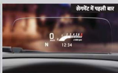
सेगमेंट में पहली बार