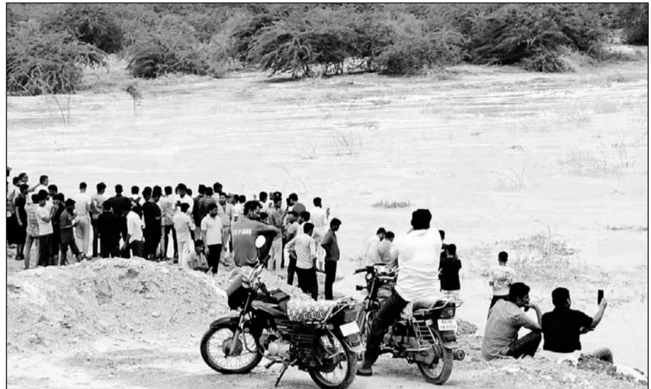
लूणी नदी में पानी की आवक होने पर लोगों की भीड़ पहुंची।

स्थानीय लोगों ने चुनरी ओढ़ाकर और विधिवत रूप से पूजा-अर्चना कर नदी का स्वागत किया