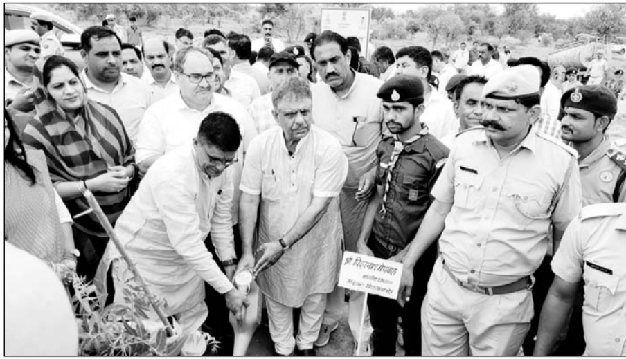
बीछवाल के मरुधरा बायोलॉजिकल पार्क में जिला स्तरीय वन महोत्सव में प्रभारी मंत्री गजेन्द्र सिंह ने पौधारोपण किया।

प्रभारी मंत्री ने कहा कि प्रदेश में मुख्यमंत्री भजन लाल शर्मा के नेतृत्व में इस वर्ष सघन पौधारोपण किया जा रहा है। प्रदेश में सात करोड़ पौधे लगाए जाने का लक्ष्य है। इसी श्रृंखला में हरियाली तीज के अवसर पर 1 करोड़ पौधे लगाये जायेंगे। उन्होंने कहा कि इस अभियान में प्रत्येक व्यक्ति का सहयोग हो और प्रदेश को हरा-भरा बनाएँ। चिकित्सा मंत्री ने कहा कि सरकार के सतत प्रयासों से आमजन में पौधारोपण के प्रति जागरूकता आई है। इससे बरसात में वृद्धि हुई है। उन्होंने