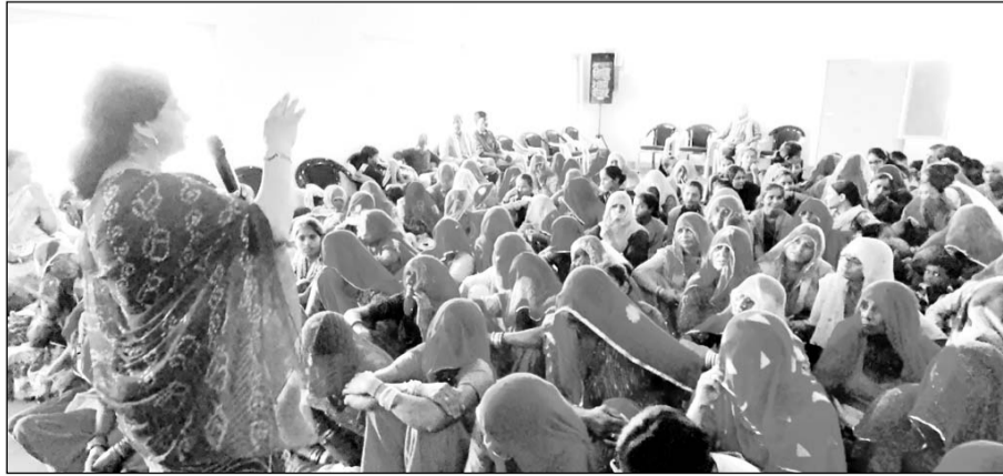
राजस्थान कृषि विश्वविद्यालय के द्वारा हाल ही में गोद लिए गए गांव पेमासर की महिलाओं को स्तन पान के महत्व के बारे में जानकारी दी।