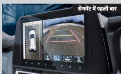
सेगमेंट में पहली बार