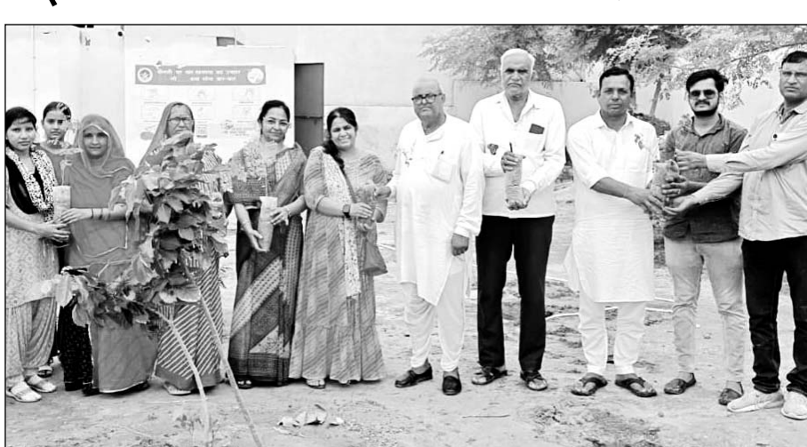
राजकीय उच्च माध्यमिक विद्यालय मोतीगढ़ के शिक्षक व विद्यार्थियों ने बुधवार को अपनी मां के नाम पर पौधारोपण कर उनकी देखभाल के लिए संकल्प लिया।