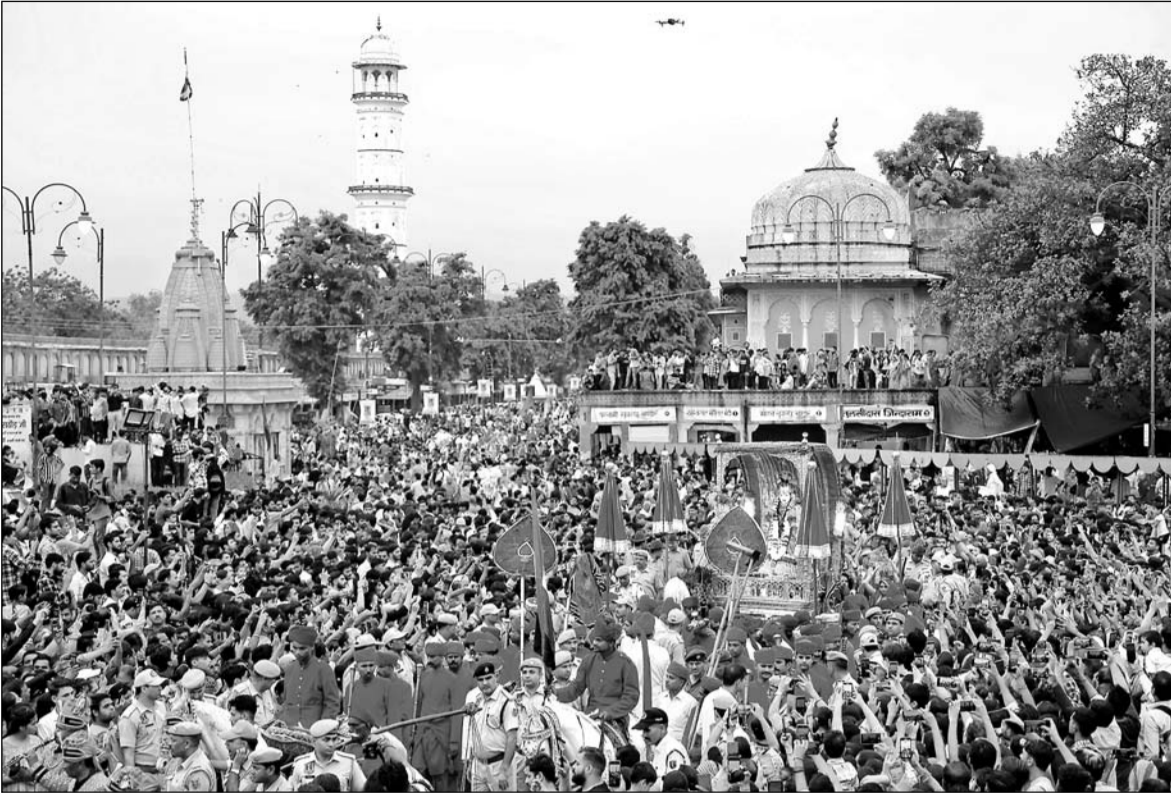
तीज माता की सवारी पूरे हर्ष उल्लास के साथ सिटी पैलेस से निकाली गई। शोभा यात्रा में आएसी व जैल बैंड की ओर से दी गई प्रस्तुतियों से वातावरण गुंजायमान हो गया। दर्शक भी तीज की सवारी देख झूमते हुए दिखाई दिए।

जयपुर। उपमुख्यमंत्री दिया कुमारी ने तीज महोत्सव की प्रदेशवासियों को शुभकामनायें और बधाई देते हुए कहा कि तीज महोत्सव राजस्थान की अनूठी पहचान है। बदलते समय के साथ हम नवाचार कर रहे हैं जिस से ना केवल पर्यटक आकर्षित हो बल्कि हमारी नयी पीढ़ी भी त्योहार को चाव से मनाये। इस बार मनाया गया तीज का उत्सव इसी का प्रतीक है कि बीसवीं संख्या में जयपुर शहर वासियों ने तथा देशी-विदेशी पर्यटकों ने तीज माता की सवारी महोत्सव में सहभागिता की है। वहीं अक्षय उर्जा के द्वारा नवाचारों करते हुए इस बार विभागीय वैक्साइड व विभाग के अधिकारिक सोशल मीडिया अकाउंट्स पर लाइव स्ट्रीमिंग की गई है। जिससे बड़ी संख्या में दर्शकों ने घर बैठे ही सजीव प्रसारण देखकर तीज त्योहार का आनंद लिया है।