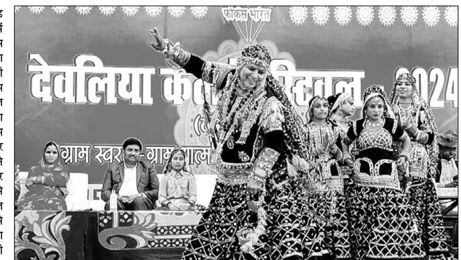
कार्यक्रम में कलाकारों ने राजस्थानी नृत्य प्रस्तुत कर खूब वाहवाही बटोरी।

बान्दानवाड़ा, (निर्स)। उपखण्ड भिनाय के देवलिया कलां ग्राम में फोकस भारत मीडिया और फोकस फाउंडेशन के तत्वाधान में ग्रामीण पर्यटन को बढ़ाने तथा राजस्थान की कला साहित्य-संस्कृति के समागम और ग्रामीण विकास के दृष्टिगत देवलिया कलां फेस्टिवल-2024 का बेहतरीन आयोजन हुआ जिसमें ग्राम स्वराज आत्मनिर्भर गांव आत्मनिर्भर भारत की अवधारणा को सार्थक बनाने की दिशा में फोकस भारत मीडिया और फोकस फाउंडेशन की ओर से आयोजन किया गया। आयोजित कार्यक्रम में क्षेत्र के विभिन्न गांवों से करीब पांच हजार ग्रामीण लोग उपस्थित रहे जिसमें महिलाओं की संख्या ज्यादा देखने को मिली।