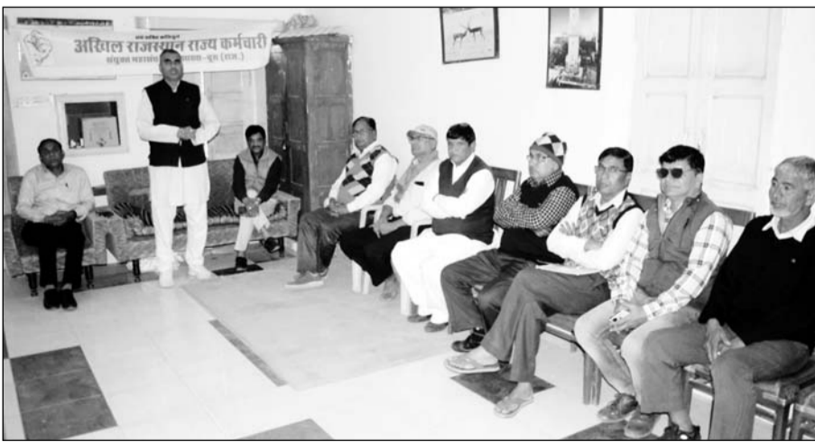
चूँ के पीडब्ल्यूडी रेट्ट हाउस में विविध मांगों को लेकर अखिल राजस्थान राज्य कर्मचारी संयुक्त महासंघ की एक बैठक आयोजित की गई।