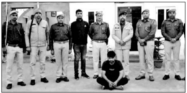
भाबर थाना पुलिस ने 40.842 टन कॉपर वायर जब्त कर आरोपी को गिरफ्तार किया है।