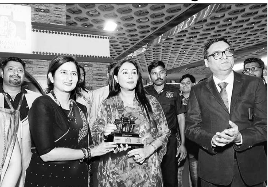
मुम्बई ओटीएम में राजस्थान टूरिज्म को सर्वश्रेष्ठ डिजाइन और सजावट का पुरस्कार मिलने पर उप मुख्यमंत्री दिया कुमारी ने खुशी जताई।

इंफ्रास्ट्रक्चर व इको-टूरिज्म आदि के लिए प्रसिद्ध है। ओटीएम में पर्यटन विभाग की भागीदारी ने राजस्थान में विदेशी पेशेवरों के लिए पर्यटन विकास के दरवाजे खोल दिए हैं। उप मुख्यमंत्री ने मुम्बई के जियो वर्ल्ड कन्वेंशन सेंटर में आयोजित समारोह में कहा कि ओटीएम प्रोडक्ट में अग्रणी ट्रेवल ट्रेड शो है। इसका आयोजन इस बार 8 से 10 फरवरी तक जियो वर्ल्ड कन्वेंशन सेंटर में किया गया है। राजस्थान पर्यटन को इससे काफी बढ़ावा मिलेगा।