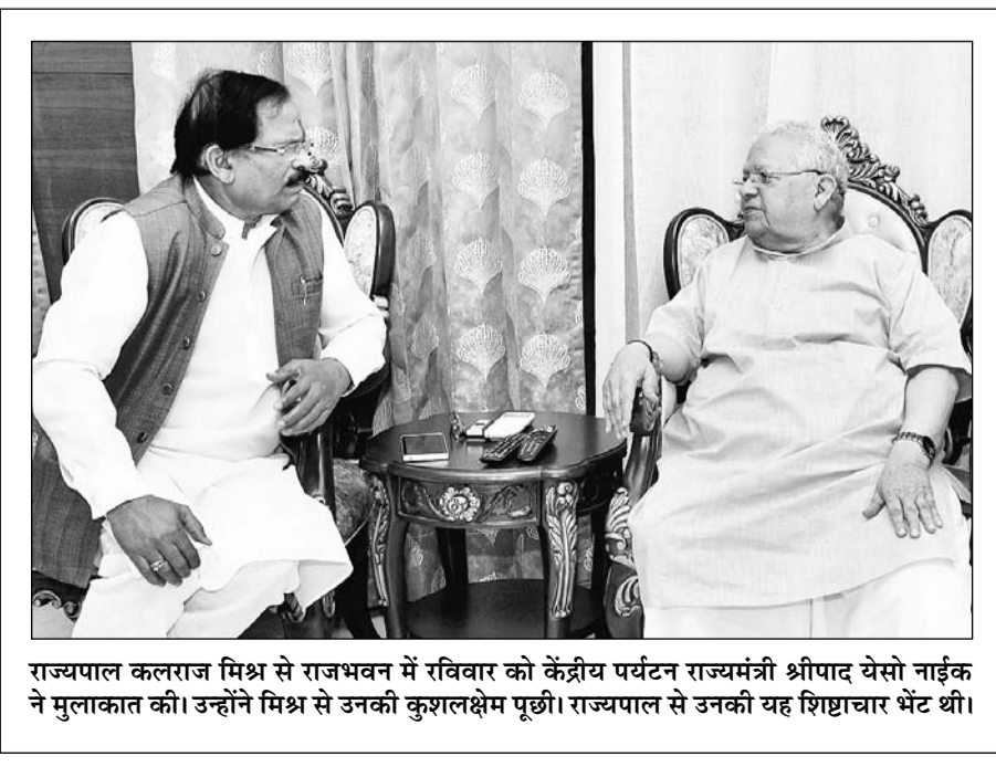
राज्यपाल कलराज मिश्र से राजभवन में रिवार को केंद्रीय पर्यटन राज्यमंत्री श्रीपाद येसो नाईक ने मुलाकात की। उन्होंने मिश्र से उनकी कुशलक्षेम पूछी। राज्यपाल से उनकी यह शिष्टाचार भेंट थी।

जयपुर। विधानसभा अध्यक्ष वासुदेव देवनानी ने रिवार को नागपुर में डॉक्टर हेडगेवार स्मृति स्मारक पर श्रद्धा सुमन अर्पित किए। देवनानी ने हेडगेवार को श्रद्धांजलि दी। वे दीक्षा भूमि भी गये। देवनानी ने हेडगेवार की जन्मस्थली पर पहुंचकर पवित्र स्थल के दर्शन किये। देवनानी ने कहा कि डॉक्टर हेडगेवार के आदर्श अनुकरणीय हैं। उनके त्याग को राष्ट्र सर्वदेव याद रखेगा। देवनानी ने नागपुर में डॉक्टर भीमराव अंबेडकर के दीक्षा स्थल पर पहुंचकर उन्हें भी श्रद्धा सुमन अर्पित किये। देवनानी ने कहा कि उन्हें नागपुर में पवित्र स्थानों पर आकर सुखद अनुभूति हुई है। देवनानी ने कहा कि डॉक्टर अंबेडकर हमारे प्रेरणा स्रोत हैं।