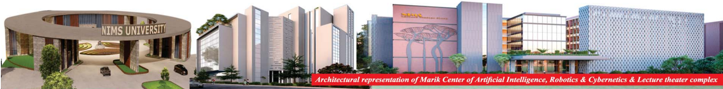
Architectural representation of Marik Center of Artificial Intelligence, Robotics & Cybernetics & Lecture theater complex

FOUNDER & CHANCELLOR NIMS University Rajasthan, Jaipur