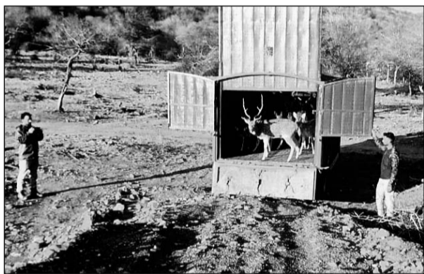
चीतल रामगढ़ विषधारी की जमीन पर कंटेनर से छोड़े गए।