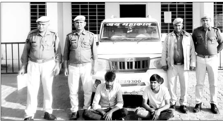
श्रीमाधोपुर थाने के हिस्ट्रीशीटर की हत्या की फिराक में आए दो सक्रिय गुर्गों को गिरफ्तार में लिया।

■ दो अवैध पिस्टल, तीन मैगजीन, दो कारतूस, 12 बोर के पांच कारतूस व बोलेरो गाड़ी बरामद