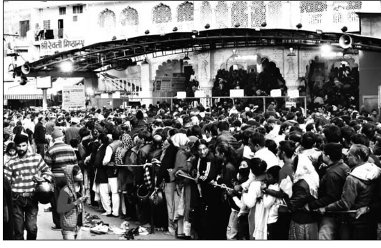
नववर्ष 2025 के प्रथम दिन भगवान गणेश के दर्शनों के लिए मोतीडूंगरी मंदिर में हजारों श्रद्धालु उमड़े मंदिर के बाहर लोगों ने कतार में लगकर अपनी बारी का इंतजार किया।

-कार्यालय संवाददाता- जयपुर । अंग्रेजी नववर्ष-2025 हंसी-खुशी के साथ बीते, इस कामना के साथ भगवान का आशीर्वाद लेने लोग सबसे पहले मंदिरों में दर्शन करने पहुंचे। मौसम ने भी पूरा साथ दिया। सूर्योदय के साथ धूप निकलने से लोगों को ज्यादा परेशानी नहीं हुई। परिवार और दोस्तों के साथ समूह में आए लोगों ने मोतीडूंगरी गणेश मंदिर और गोविंददेवजी मंदिर पहुंचकर भगवान के दर्शन किए। इसके बाद पर्यटन स्थल घूमने मोबाइल से फोटो लेकर सोशल मीडिया पर शेयर की। ज्यादातर लोगों का खाना-पीना भी बाहर ही हुआ। जयपुर के आराध्य देव गोविंद देवजी मंदिर, मोतीडूंगरी और गढ़ गणेश मंदिर में बुधवार को श्रद्धालुओं की भारी भीड़ उमड़ी। तेज सर्दी के कारण मंगला और धूप झांकी में