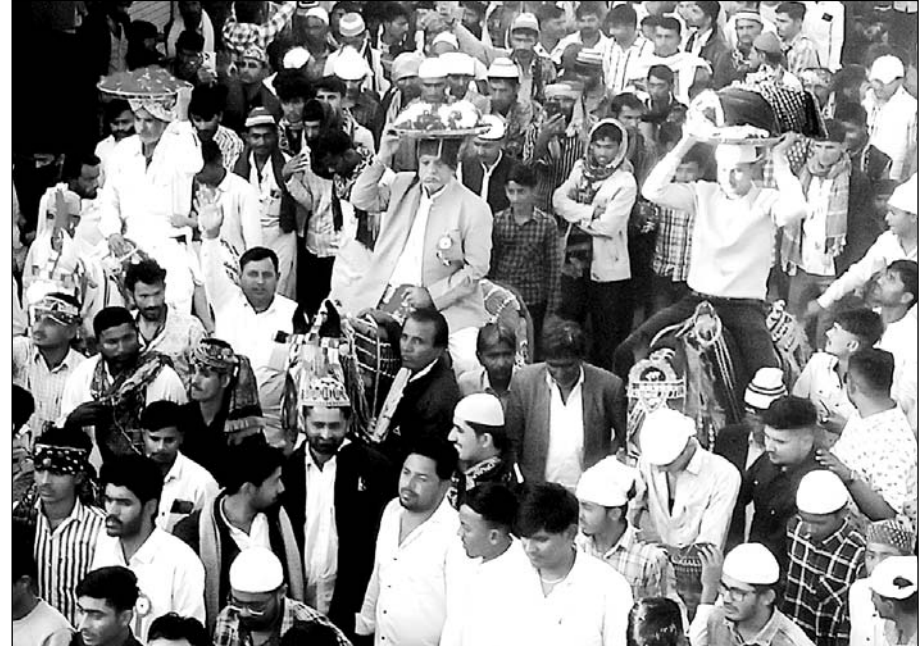
दादा अमीरूदीन हैदर की दरगाह पर 38 वें उर्स को लेकर चादर जलसा निकाला गया।