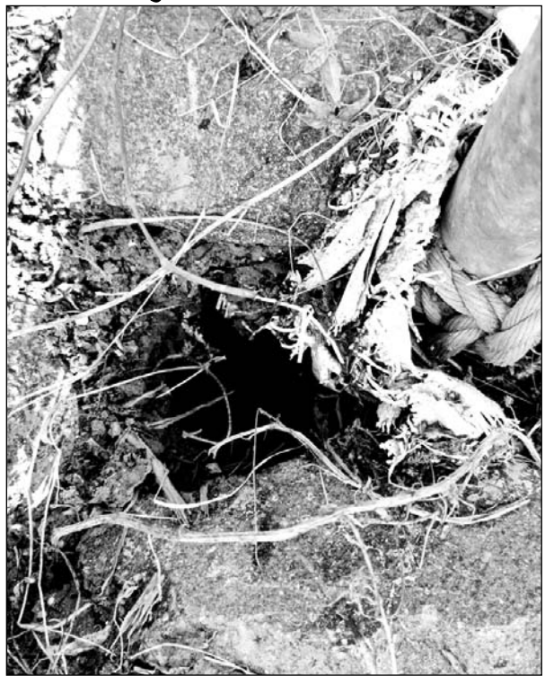
देरवाला में सड़क किनारे खुला पड़ा बोरवैल हादसों को न्यौता दे रहा है।

झुंझुनू, (निर्स)। देरवाला में 11 साल से सड़क किनारे बोरवैल को खुला ही छोड़ रखा है। जिला मुख्यालय के निकटवर्ती ग्राम पंचायत देरवाला में मुख्य सड़क किनारे काजी बस्ती के सामने खेलते बच्चे कब खुले पड़े बोरवैल में गिरने हादसे का शिकार हो जाये, इसका भगवान ही मालिक है। साथ इस बोरवैल के पास में बने पीलर यानी खंभे और कोटड़ी सड़क हादसे को दायत दे रहे हैं। वहीं 11 साल से इस तरफ न जिम्मेदार जलदाय विभाग का ध्यान है न ग्राम पंचायत का।