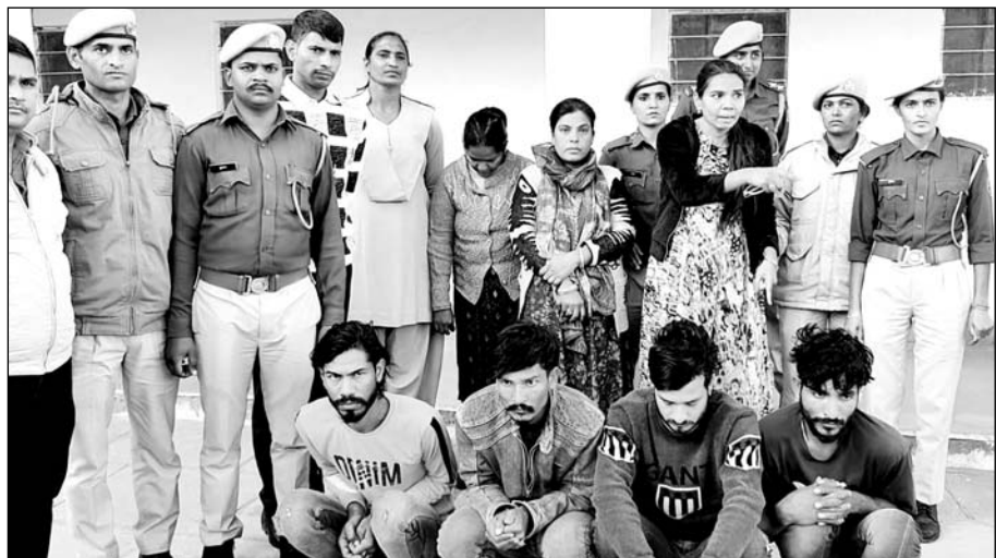
कांकरोली थाना पुलिस ने हनीट्रैप के आरोपियों को गिरफ्तार किया।