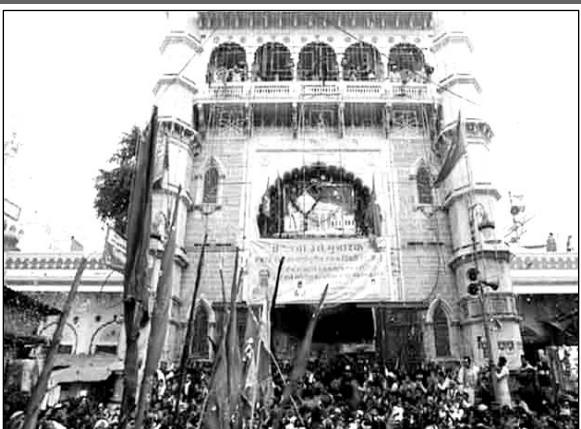
ख्वाजा साहब की दरगाह पर मलंग व कलंदरों ने छड़ियां पेश की।