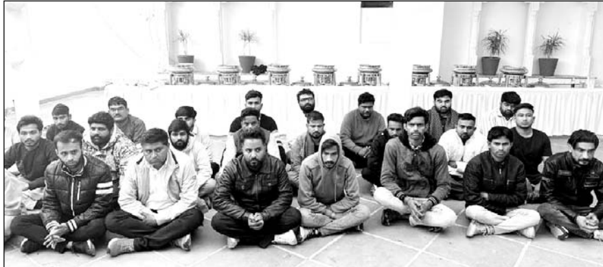
पुलिस ने होटल में रेव पार्टी मनाते लोगों को किया।