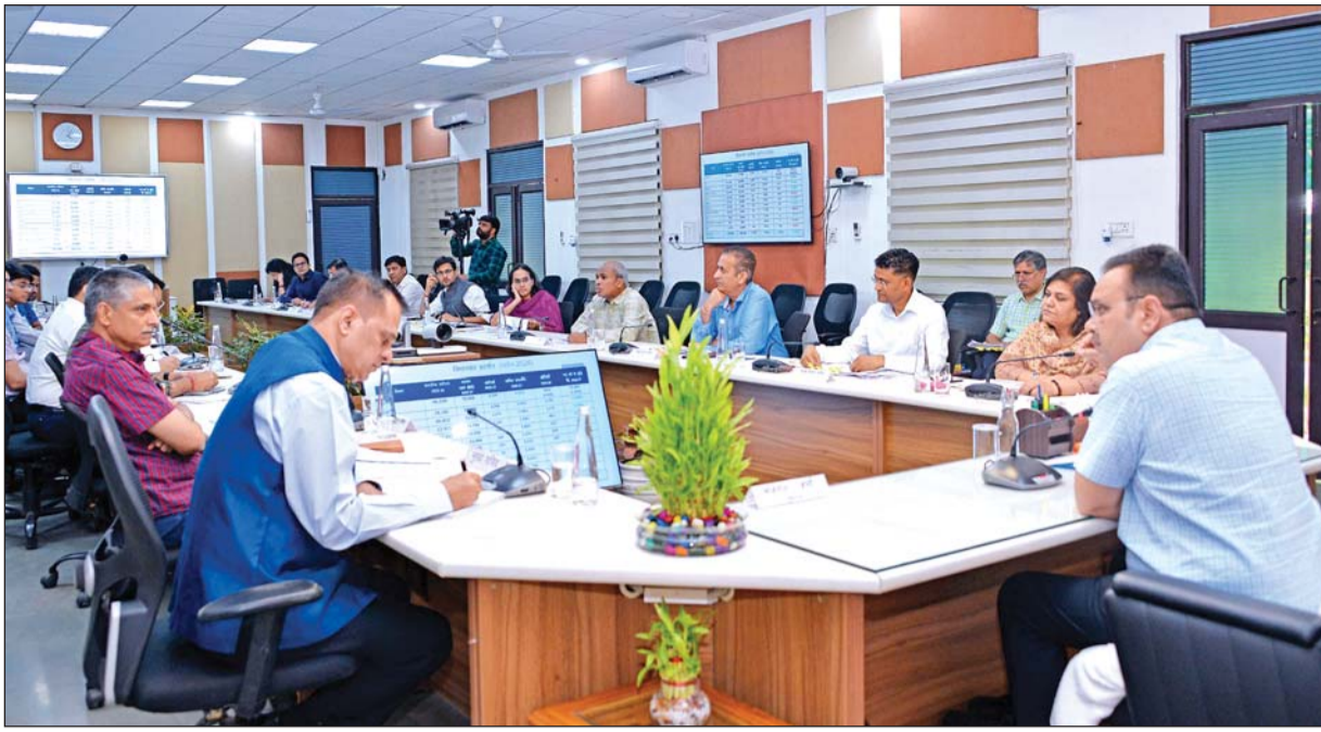
मुख्यमंत्री भजनलाल शर्मा ने रविवार को मुख्यमंत्री निवास पर राजस्व अर्जन से संबंधित विभागों की समीक्षा बैठक ली। बैठक में मुख्य सचिव वी. श्रीनिवास, अतिरिक्त मुख्य सचिव (मुख्यमंत्री) अखिल अरोड़ा, अतिरिक्त मुख्य सचिव खान एवं पेट्रोलियम अपर्णा अरोड़ा, प्रमुख शासन सचिव वित्त वैभव गोलारिया व संबंधित विभागों के अधिकारी उपस्थित रहे।