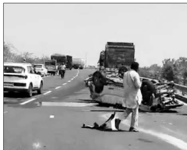
भारतमाला एक्सप्रेस-वे पर हुये हादसे में कार पलटी खा गई।