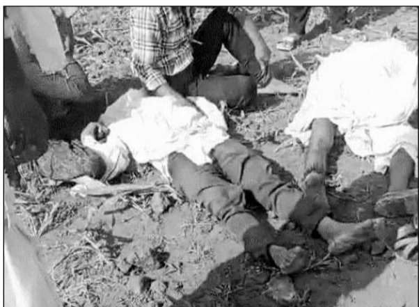
नगरफोर्ट थाना क्षेत्र में खेत पर चारा काटते समय करंट लगने से पिता-पुत्र की मौत हो गई।

करीब एक घंटे बाद मृतक की पत्नी खेत पर चारा लेने पहुंची तो उसने पति और बेटे को घटनीन पर बेसुध पड़ा देखा। चिल्लाने की आवाज सुनकर