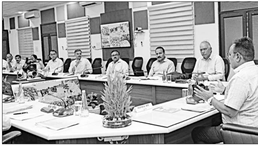
मुख्यमंत्री भजनलाल शर्मा ने वंदे गंगा जल संरक्षण-जन अभियान, जल संचय जन भागीदारी 2.0 और कर्मभूमि से मातृभूमि अभियान को लेकर रविवार को उच्च स्तरीय बैठक ली।

-कार्यालय संवाददाता- जयपुर। मुख्यमंत्री भजनलाल शर्मा ने कहा कि वंदे गंगा जल संरक्षण जन अभियान को केवल सरकारी कार्यक्रम तक सीमित न रखकर गांव-गांव तक पहुंचाया जाए और जन आंदोलन बनाया जाए। उन्होंने कहा कि जल संचय को बढ़ावा देने में यह अभियान महत्वपूर्ण कड़ी है। इसलिए शहरों से लेकर ग्राम स्तर तक आमजन एवं प्रशासन की भागीदारी इस अभियान में सुनिश्चित की जाए। मुख्यमंत्री ने रविवार को मुख्यमंत्री निवास पर वंदे गंगा जल संरक्षण-जन अभियान, जल संचय जन भागीदारी 2.0 और कर्मभूमि से मातृभूमि अभियान को लेकर उच्च स्तरीय बैठक ली।