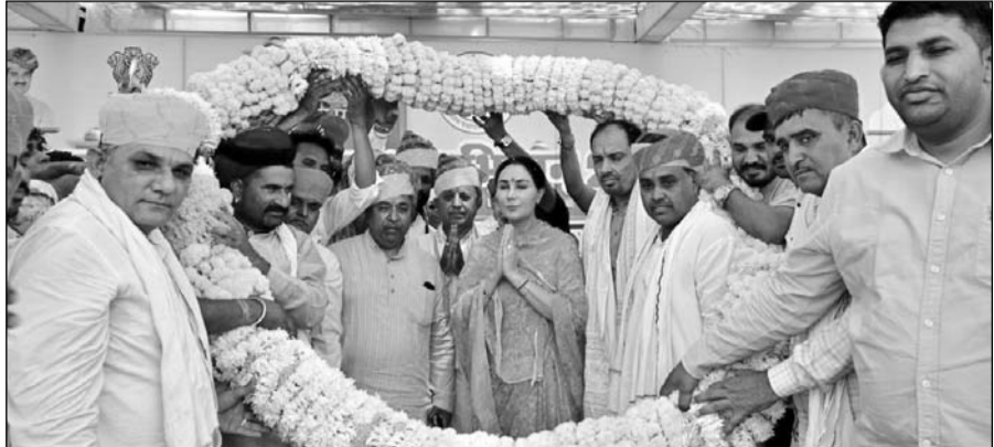
उप मुख्यमंत्री के अजमेर आगमन पर कार्यकर्ताओं ने माला पहनाकर भव्य स्वागत किया।

अजमेर/मांगलियावास, (निसं)। उप मुख्यमंत्री दिया कुमारी ने रविवार को केसरपुरा पहुंचकर नवनिर्मित ग्राम पंचायत भवन का लोकार्पण किया। इसके साथ ही उन्होंने ग्राम विकास चौपाल में ग्रामीणों से संवाद कर उनकी समस्याएं सुनीं तथा संबंधित अधिकारियों को समाधान के निर्देश दिए। उप मुख्यमंत्री जयपुर से अरावली एक्सप्रेस ट्रेन द्वारा अजमेर पहुंचीं: उप मुख्यमंत्री जयपुर से अरावली एक्सप्रेस ट्रेन द्वारा अजमेर पहुंचीं। उन्होंने प्रधानमंत्री नरेन्द्र मोदी की अपील का उल्लेख करते हुए पेट्रोलियम पदार्थों की बचत के लिए रेल यात्रा को प्राथमिकता देने की बात कही। अजमेर से वे केसरपुरा पहुंचीं, जहां पंचायत भवन का लोकार्पण समारोह आयोजित हुआ। समारोह को संबोधित करते हुए दिया कुमारी ने कहा कि केसरपुरा का ग्राम पंचायत भवन पूरे राजस्थान के लिए एक आदर्श मॉडल है। उन्होंने कहा कि सभी ग्राम पंचायतों में इसी प्रकार सुविधायुक्त भवन बनने चाहिए, जिससे ग्रामीण विकास को नई दिशा मिलेगी तथा स्थानीय बैठकों और प्रशासनिक गतिविधियों के लिए बेहतर व्यवस्था उपलब्ध होगी। उन्होंने कहा कि राज्य सरकार कृषि क्षेत्र में नवाचारों को बढ़ावा दे रही है और इसके सकारात्मक परिणाम