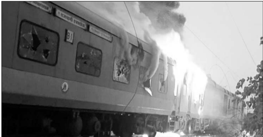
ट्रेन का थर्ड एसी और एएसएलआर कोच जलकर पूरी तरह खाक हो गए।