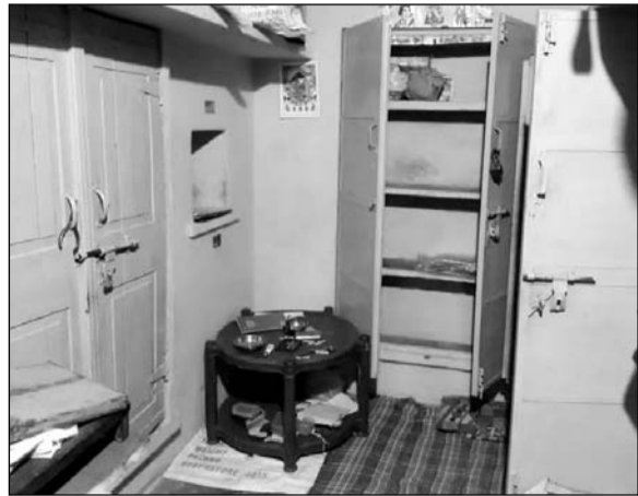
घर को निशाना बनाकर लूट की वारदात को अंजाम दिया गया।

पत्नी छत से नीचे पहुंचे तो अंदर से गेट बंद मिला। काफी मशक्कत के बाद गेट तोड़कर अंदर पहुंचे, तब तक बदमाश सामान लेकर भाग रहे थे। परिवार ने बदमाशों को हाथों में पीपे लेकर भागते हुए देखा। बताया जा रहा है कि बदमाशों ने आसपास के कुछ मकानों के ताले भी तोड़ दिए, जिससे पूरे कस्बे में भय का माहौल बन गया। घटना की सूचना