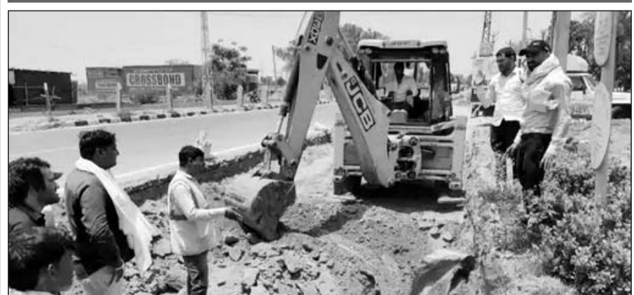
सूचना मिलते ही एस्केएन गैस कंपनी की इमरजेंसी टीम घटनास्थल पर पहुंची।

नाला खुदाई करते समय हुई घटना, इमरजेंसी टीम घटनास्थल पहुंची, स्थिति नियंत्रित