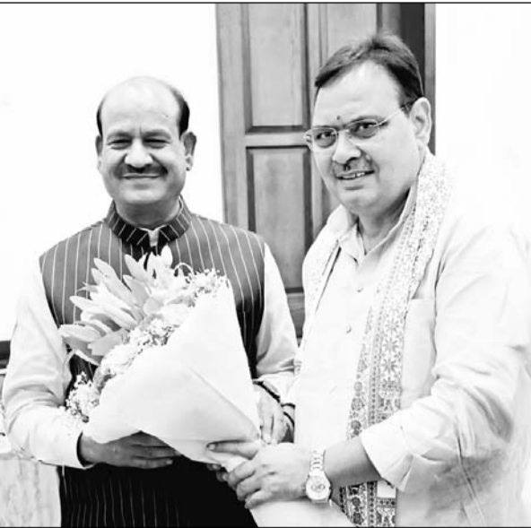
मुख्यमंत्री भजनलाल शर्मा ने ओम बिड़ला के दूसरी बार स्पीकर पद पर चुने जाने पर हार्दिक बधाई दी।

ज्ञान एवं कुशल कार्यप्रणाली का लाभ सदन के समस्त सम्पादित सदस्यों को पूर्व की भांति प्राप्त होगा। बिरला का दूसरी बार लोकसभा अध्यक्ष चुना जाना राजस्थान के लिए गौरव का क्षण है।