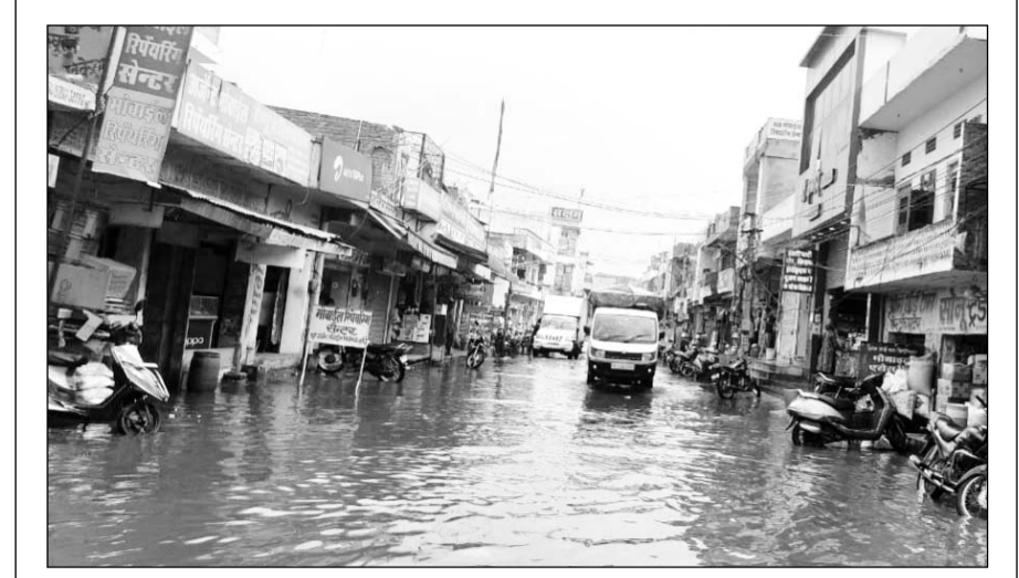
जयपुर शहर में बुधवार को हुई प्री मानसून की छितराई बारिश में सीकर रोड 1 नम्बर से टोडी तक कई जगह घुटनों तक पानी भरा। वहीं रोड नम्बर 2 मुख्य बाजार में भी पानी भर गया।