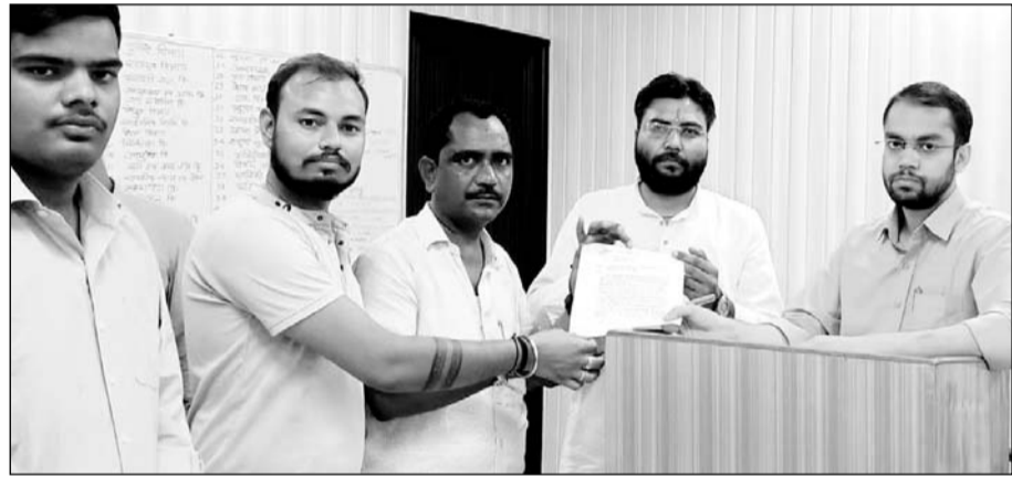
जिला कलेक्टर को ज्ञापन देते विप्र सेना युवा प्रकोष्ठ कार्यकर्ता।