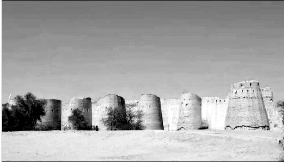
भारत-पाक सीमा के समीप स्थित जर्जर होता किशनगढ़ किला।

संरक्षित स्मारक घोषित होने के बाद यहां के लोगों को उम्मीद जगी थी कि अब इस किले के दिन बदलने वाले हैं लेकिन ऐसा हुआ नहीं। सरकारी उपेक्षा के चलते संरक्षित स्मारक होने के बाद भी न्यायिक रस्ताकशी में फंसे इन किलों की किस्मत संवर नहीं पाई है। जैसलमेर की पाकिस्तान से लगती सीमा पर बने होने के कारण तीनों किले