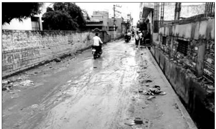
करौली शहर की विवेक बिहार कॉलोनी के रास्ते में बरसाती पानी भरने से लोगों को होती है परेशानी।

आई लेकिन उस 20 मिनट की बारिश ने नगर परिषद प्रशासन और जिला प्रशासन की आपदा प्रबंधन की पोल खोल कर रख दी। मौसम की बरसात आने से जिला प्रशासन के उच्च अधिकारियों के अलावा नगर परिषद प्रशासन एवं आपदा प्रबंधन से जुड़े सभी विभागों के अधिकारियों की जिला कलेक्टर की अध्यक्षता में बैठक आयोजित हुई जिस बैठक में मौसम की बरसात से होने वाली आपदाओं से निपटने के लिए मौसम की बरसात से पूर्व तैयारी के निर्देश दिए गए लेकिन बुधवार को मौसम की महज 20 मिनट लगातार आई बारिश ने नगर परिषद प्रशासन, जिला प्रशासन सहित आपदा