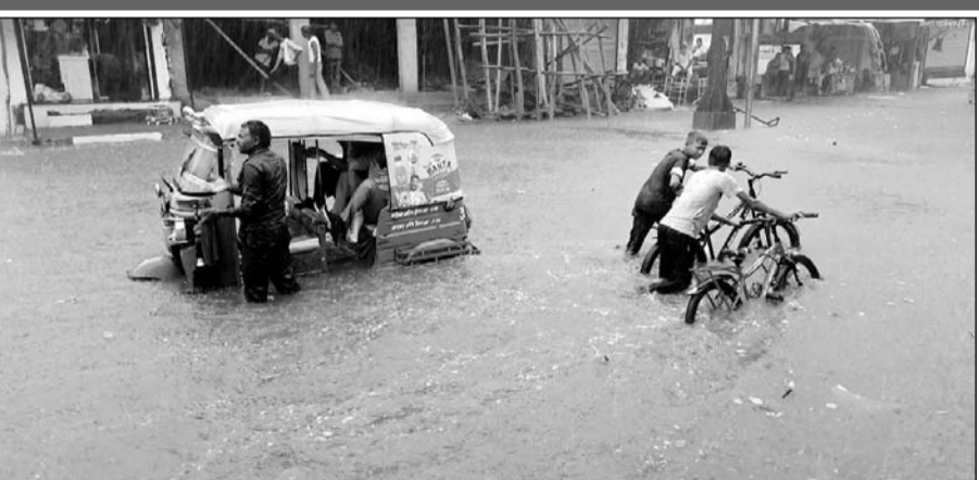
धौलपुर में बरसात होने से सड़कों पर पानी भरने से वाहन चालक परेशान हुये।

धौलपुर, (निर्स)। पिछले कई दिनों के इंतजार के बाद आखिरकार बुधवार शाम को लगभग पूरे धौलपुर जिले में एक घंटे जमकर बरसात हुई। धौलपुर शहर में 65 एमएम (डेढ़ इंच) बारिश दर्ज की गई। वहीं तेज बरसात के कारण धौलपुर शहर के मुख्य मार्गों एवं कॉलोनीयों में भारी जल भराव हो गया, जिससे लोगों को भारी परेशानी को सामना करना पड़ा। बरसात से लोगों को गर्मी से राहत मिली।