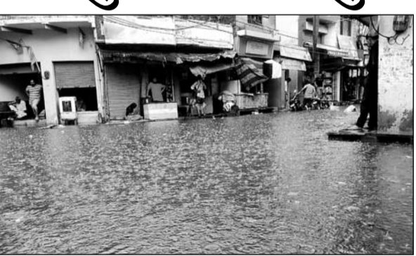
किशनगढ़ बास के मानसून की पहली बरसात में ही मुख्य बाजार में पानी भर गया।

किशनगढ़ बास, (निर्स)। किशनगढ़ बास में बुधवार दोपहर को हुई मानसून की पहली करीब 50 मिमट की बारिश से एक तरफ जहां लोगों को गर्मी से राहत मिली है वहीं दूसरी ओर मुख्य बाजार व गंज रोड की सड़कें पानी से जलमग्न हो गईं। दुकानों के अंदर पानी प्रवेश करने से व्यापारियों का भारी नुकसान हुआ है। शहर में पानी की निकासी की अवरुद्ध समस्या का समाधान नहीं हो पाने के कारण व्यापारियों में भारी आक्रोश नजर आया।