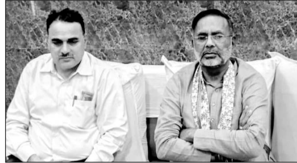
बजट घोषणाओं के क्रियान्वयन के लिए निर्देश दिए।

उन्होंने कहा कि बजट में किए गए प्रावधानों से राजस्थान विकसित राज्य की श्रेणी में तेजी से अग्रसर होगा और अंतिम छोर पर बैठे व्यक्ति के चेहरे पर