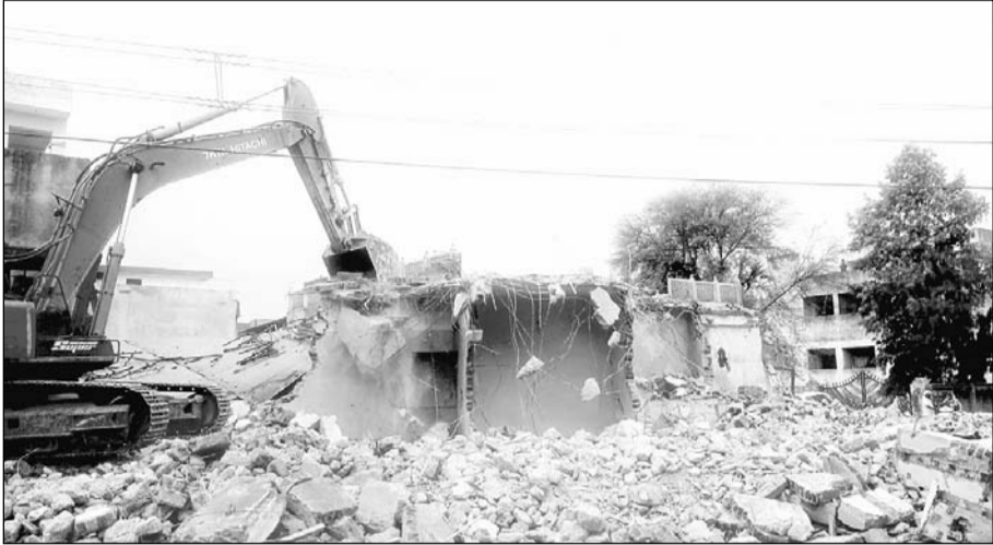
हाईकोर्ट के निर्देश पर पिछले दिनों न्यू सांगानेर रोड पर अतिक्रमण हटाने की तस्वीर। (फाइल फोटो)

जयपुर। नगरीय विकास मंत्री झाबर सिंह खर्वा की नाराजगी और फटकार के बाद जे.डी.ए. प्रशासन 15 से 30 जुलाई तक करीब 50 किलोमीटर क्षेत्र में अतिक्रमण हटाने का अभियान चलायेगा। इस अभियान की शुरुआत सोमवार सुबह मुख्यमंत्री भजनलाल शर्मा के सांगानेर विधानसभा क्षेत्र में गोपालपुरा मोड से होगी। जे.डी.ए. की टीम 30 जुलाई तक गोपालपुरा, गुर्जर की थड़ी, मानसरोवर, श्याम नगर, मालवीय नगर, दुर्गापुरा, वैशाली नगर, नर्सरी सर्किल, गुप्ता स्टोर, खातीपुरा, झोटवाड़ा, गवर्नमेंट हॉस्टल, रामनिवास बाग, घाट गेट, आगरा रोड, घाट की गुणी, दिल्ली रोड, इंदगाह, ट्रांसपोर्ट नगर, सांगानेर, मालपुरा गेट, कर्वी रोड, एसएमएस हॉस्पिटल, नारायण सिंह सर्किल, त्रिमूर्ति सर्किल और रामबाग सर्किल समेत कई इलाकों में तोड़फोड़ करेगी। इसके लिए अतिक्रमणों को चिन्हित कर लिया गया है।