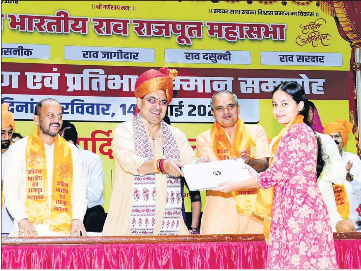
मुख्यमंत्री भजनलाल शर्मा रविवार को बिड़ला ऑडिटोरियम (जयपुर) के भारतीय राव राजपूत समाज के प्रतिभा सम्मान समारोह में सम्मिलित हुये। इस समारोह में 500 प्रतिभाओं को सम्मानित किया गया।