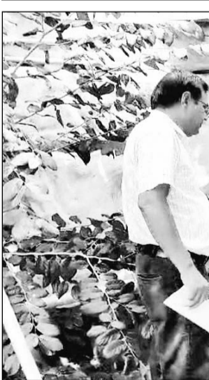
जलदाय विभाग ने जयपुर शहर के खो-नागोरियान में स्थित पार्क सिटी होटल के परिसर में अवैध जल कनेक्शन के विरुद्ध रविवार को कार्रवाई की।