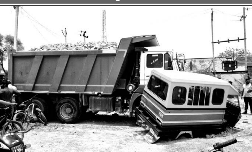
बालोतरा मूंगड़ा सर्किल के पास मेगा हाईवे पर तेज रफ्तार डम्पर ने टैम्पो को टक्कर मार दी जिससे टैम्पो में सवार एक युवक की मौके पर ही मौत हो गई

दोपहर करीब 12 बजे बालोतरा शहर से मूंगड़ा की ओर जा रहे तिपहिया टैम्पो को पचपदरा की ओर से आ रहे क्रिकेट से भरे डम्पर ने चपेट में ले लिया, हादसा इतना भिषमत्स था कि टैम्पो का आगला हिस्सा डम्पर में फंस गया जो करीब 20 से 30 फिट तक