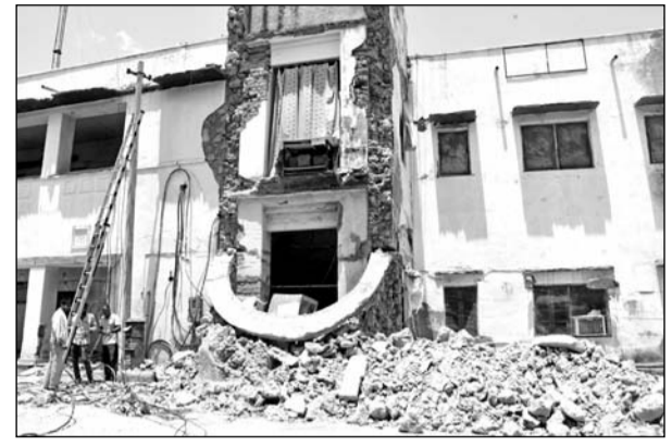
चूरू जिला कलेक्ट्रेट का एक हिस्सा गत रात को अचानक से भरभराकर गिर गया।

चूरू, (कासं)। जिला मुख्यालय पर स्थित कलेक्ट्रेट भवन ही जब सुरक्षित नहीं है तो अन्य पुरानी इमारतों के बारे में तो कुछ कहा ही नहीं जा सकता कब किसी की जिंदगी काल के मुंह में चली जाये। ऐसा ही वाक्या शनिवार को हुआ। यहां पर स्थित जिला कलेक्ट्रेट भवन का एक हिस्सा शनिवार देर रात भरभराकर अचानक से गिर गया। देर रात करीब साढ़े 11 बजे एक ट्रेन के गुजरने के बाद यह भवन गिर गया। इस दौरान मलबे के नीचे दबने से दो कर्मचारी बाल-बाल बच गए। इससे पूर्व भी जिला कलेक्ट्रेट के पीछे बने दो कमरे गिर गये थे। जिससे उसमें रखा रिफाई खराब हो गया था। आपको बता दें कि कलेक्ट्रेट भवन की मरम्मत के लिए राज्य सरकार से 19 करोड़ रुपए का बजट आया है। फिलहाल जो हिस्सा गिरा है, उसमें फोटो ऑफिस संचालित था। इससे वहां रखे महत्वपूर्ण दस्तावेजों