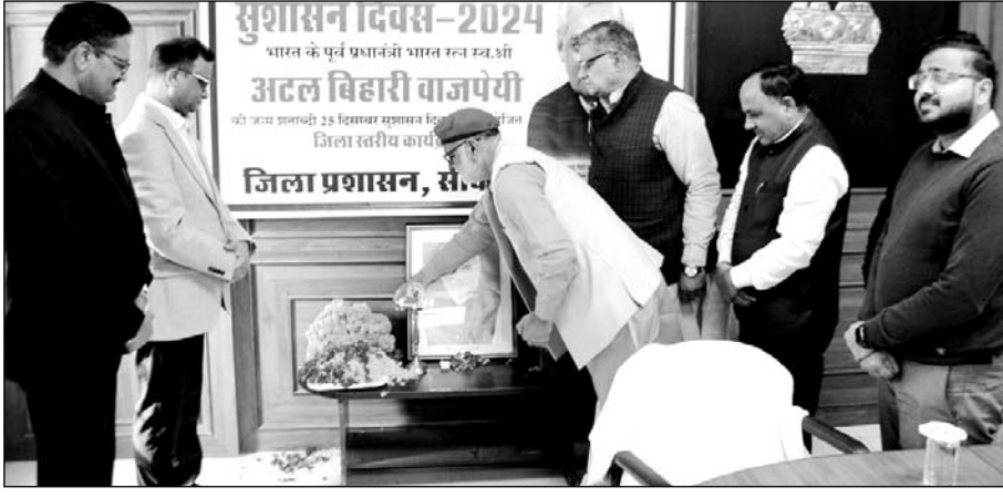
अटल बिहारी वाजपेयी की जयंती के अवसर पर जिला कलेक्टर सभागार में सुशासन दिवस मनाया गया।

पूर्व प्रधानमंत्री वाजपेयी ने देश में नदियों को जोड़ने, हाईवे एवं एक्सप्रेसवे निर्माण का कार्य शुरू किया जो आज देश में बड़े स्तर पर हो रहा है। उन्होंने अंतरराष्ट्रीय स्तर पर देश की राजनीतिक स्थिति को मजबूत किया। उन्हीं के नेतृत्व में अंतरराष्ट्रीय दबाव होने के बावजूद देश ने अपना पोककर