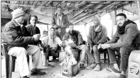
अजमेर में शीतलहर के कारण लोग अलाव तापते नजर आये।

अजमेर, (कासं)। पश्चिम विक्षोभ और पहाड़ों पर हुई बर्फबारी व प्रदेश के जिलों में हुई पहली मबावत की बारिश के चलते मौसम ने करवट बदली है। मबावत और ठंडी हवाओं के चलते घने कोहरे व तापमान में गिरावट के चलते शीतलहर ने लोगों को धुंजणी छुड़ा दी है।