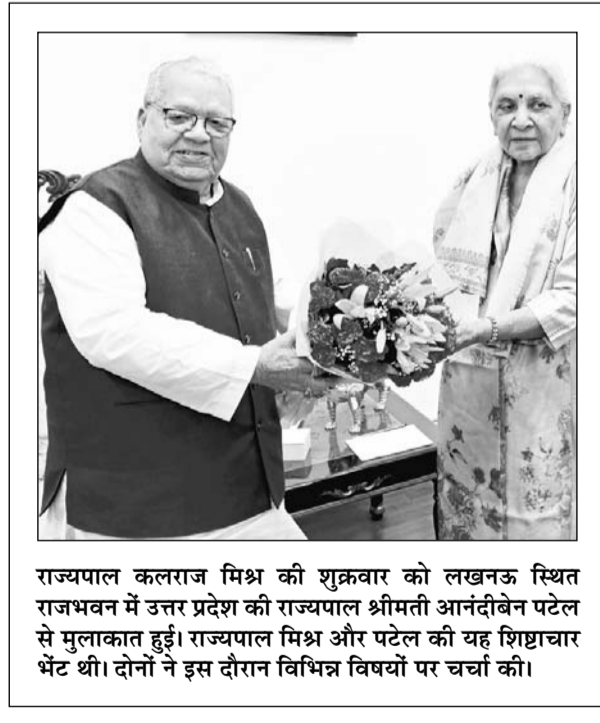
राज्यपाल कलराज मिश्र की शुक्रवार को लखनऊ स्थित राजभवन में उत्तर प्रदेश की राज्यपाल श्रीमती आनंदीबेन पटेल से मुलाकात हुई। राज्यपाल मिश्र और पटेल की यह शिष्टाचार भेंट थी। दोनों ने इस दौरान विभिन्न विषयों पर चर्चा की।