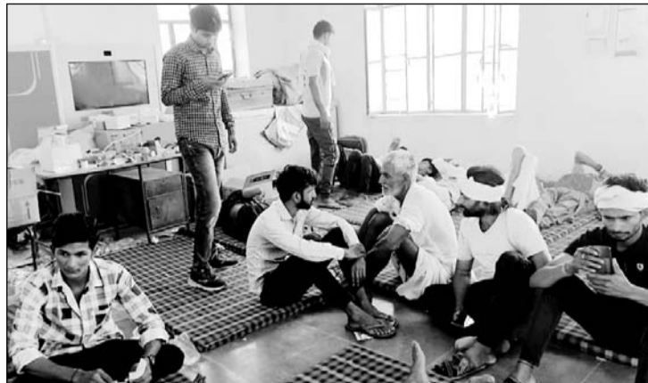
फूड प्वाइजनिंग से बीमार लोगों को केकड़ी जिला अस्पताल में भर्ती कराया।

खाना खाने के कुछ देर बाद लोगों को अचानक उल्टी और दस्त की शिकायत होने लगी थी