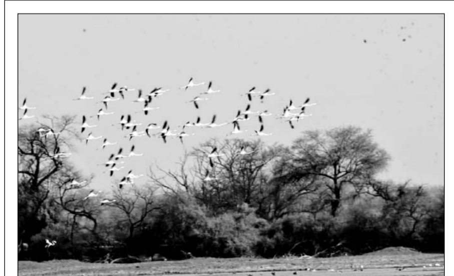
भरतपुर के केवलदावे नेशनल पार्क में पक्षियों एवं वन्यजीवों के लिए भीषण गर्मी में भी जलाशय तथा वाटर पॉइंट्स में पर्याप्त मात्रा में पानी की व्यवस्था की जा रही है। इसमें वाटर टैंकर, सोलर पम्प इत्यादि के माध्यम से पानी सुविधा मुहिया कराई जा रही है। इसकी वजह से पक्षी एवं वन्यजीव भीषण गर्मी में भी पार्क के अंदर रहना तथा भोजन के लिए रुकना पसंद कर रहे हैं।