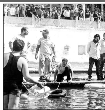
उदयपुर के गंगु कुण्ड में मौके पर पहुंची रेस्क्यू टीम ने शवों को बाहर निकाला।