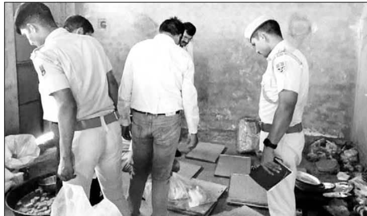
खाद्य विभाग की टीम ने शादी में बने घेवर, मिठाई और तेल आदि के नमूने लिए।

देवली, (निसं)। बीजवाड़ गांव में गुरुवार की रात को एक शादी समारोह में आयोजित भोज में खाना खाने के बाद करीब 150 लोगों की तबियत बिगड़ गई थी। जानकारी के अनुसार गुरुवार की रात को बीजवाड़ गांव में एक शादी थी। इस शादी समारोह में एक हजार लोगों के लिए भोजन बनाया गया था। इस दौरान खाना खाने के कुछ देर बाद अचानक लोगों की अचानक उल्टी और दस्त की शिकायत होने लगी। जब यह संख्या ज्यादा बढ़ने लगी तो प्रामीणी ने तत्परता दिखाते हुए एंबुलेंस और निजी वाहनों के जरिए केकड़ी जिला अस्पताल लेकर पहुंचे जहां पर फूड प्वाइजनिंग की जानकारी लगी। फूड प्वाइजनिंग की वजह से करीब 150