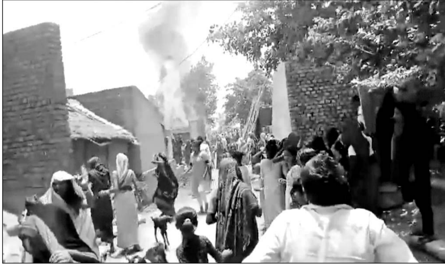
धौलपुर जिले के मनियां क्षेत्र के गांव उदई का पुरा में एक छप्परपोश मकान में भयानक आग लग गई।

इकट्ठा हो गए और आग बुझाने का प्रयास करने लगे। वहीं आनन-फानन में दमकल गाड़ी को भी सूचना दी, जिसके मौके पर पहुंचने में देर हो गई। फिर ग्रामीणों ने भारी मशकत के बाद करीब 2 घंटे में आग पर काबू पाया, लेकिन