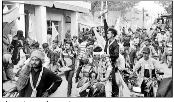
धौलपुर में बाइक रैली व शोभायात्रा निकाली।

धौलपुर, (निर्स)। पाल बघेल समाज की ओर से धौलपुर जिला मुख्यालय पर अहिल्याबाई होलकर को 2099वीं जयंती को धूमधाम से मनाया गया। अहिल्या बाई होलकर उन चुनिंदा शासकों में से हैं, जिन्होंने प्रजा के उद्धार के लिए अपना संपूर्ण जीवन न्योछावर कर दिया। अहिल्याबाई होलकर ने अपने राज्य की सीमाओं के बाहर भी पूरे भारत के प्रसिद्ध तीर्थों और विभिन्न स्थानों में मंदिर, घाट, कुओं, बावड़ियों का निर्माण करवाया।