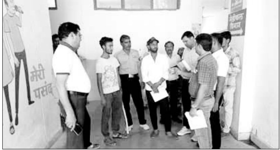
करौली अस्पताल में चिकित्साकर्मियों ने तम्बाकू से होने वाले दुष्परिणामों की लोगों को जानकारी दी।

करौली, (निर्स)। करौली जिला मुख्यालय स्थित विद्यालय व सरकारी अस्पताल सहित कई अन्य स्थानों पर विश्व तम्बाकू निषेध दिवस के अवसर पर कई कार्यक्रमों का आयोजन किया गया।