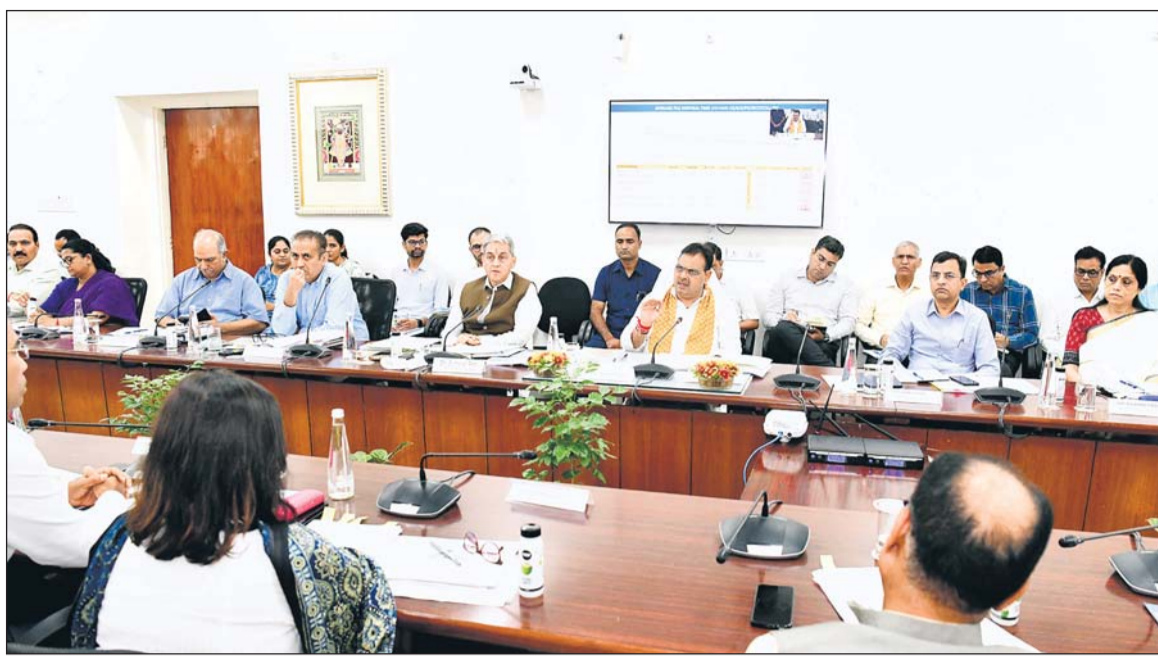
मुख्यमंत्री भजनलाल शर्मा ने शुक्रवार को वीडियो कॉन्फ्रेंसिंग के माध्यम से विभागीय उच्चाधिकारियों, जिला प्रभारी सचिवों, संभागीय आयुक्त व कलेक्टरों की समीक्षा बैठक ली, जिसमें उन्होंने अधिकारियों को पानी-बिजली सप्लाई की सुचारु व्यवस्था सुनिश्चित करने के निर्देश दिये तथा अधिकारियों के साथ प्रदेश में वॉटर हार्वेस्टिंग एवं आम जन शिकायत निवारण सहित कई प्रमुख मुद्दों पर चर्चा की।