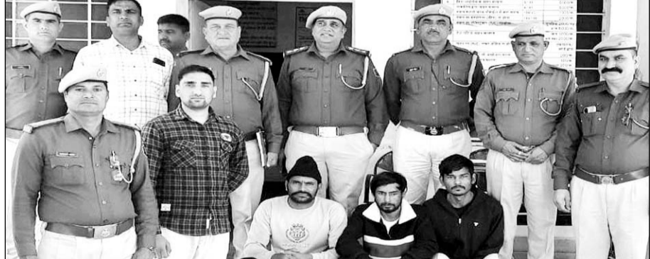
झालावाड़ जिले में कोतवाली थाना पुलिस ने आरोपियों को गिरफ्तार किया।