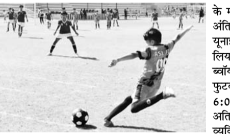
में राजस्थान फुटबाल स्कूल जयपुर ने जयपुर फुटसाल फुटबाल क्लब को 3:1 से पराजित किया। चौथे मैच में ब्रदर्स यूनाइटेड फुटबाल क्लब और एस ल फुटबाल क्लब

जयपुर, 9 फरवरी। राजस्थान फुटबॉल संघ के तत्वाधान में एस एस जैन सुबोध शिक्षा समिति के प्रांगण में जारी आर लीग यूथ अंडर-13 फुटबॉल प्रतियोगिता में पांच मैच खेले गए। जयपुर एलिट फुटबाल क्लब जयपुर और जयपुर यूनाइटेड फुटबाल क्लब के बीच खेला गया जिसमें जयपुर एलिट क्लब ने मैच 6:0 से जीत लिया। दूसरा मैच चैंपियन मेकर्स और रॉयल फुटबाल स्कूल के बीच खेला गया दोनों टीमों ने शानदार प्रदर्शन किया व निर्धारित समय तक 7-1 से मैच चैंपियन मेकर्स अजमेर ने जीत हासिल की। तीसरे मैच