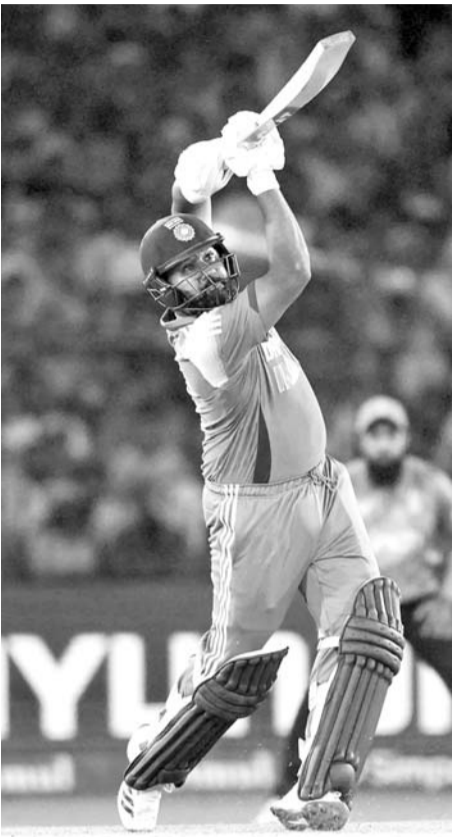
लिया। अक्षर पटेल (41) और रवींद्र जडेजा (11) रन बनाकर नाबाद रहे। इंग्लैंड की ओर से जेमी ओवर्टन ने दो विकेट लिये। आदिल रशीद, गस ऐटकिंसन और लियम लिविंग्स्टन ने एक-एक बल्लेबाज को आउट किया। इससे

कटक 9 फरवरी। रवींद्र जडेजा (तीन विकेट) की धाक गेंदबाजी के बाद भारतीय टीम के कप्तान रोहित शर्मा (119) की शतकीय, शुभमन गिल (60) और अक्षर पटेल (नाबाद 41) की शानदार बल्लेबाजी के दम पर भारत रविवार को दूसरे एकदिवसीय मुकाबले में इंग्लैंड को 33 गेंद शेष रहते चार विकेट से हरा दिया है। इसी के साथ भारत ने तीन मैचों की सीरीज में 2-0 से अजेय बढ़त बना ली है। इंग्लैंड के 304 रनों के जवाब में बल्लेबाजी करने उतरी रोहित शर्मा और शुभमन गिल की भारतीय सलामी जोड़ी ने शानदार शुरुआत करते हुए पहले विकेट के लिए 136 रनों की साझेदारी की। 17वें ओवर में जेमी ओवर्टन ने शुभमन गिल को आउट कर इंग्लैंड को पहली सफलता दिलाई। गिल ने 52 गेंदों में नौ चौके और एक छक्का लगाते हुए (60) रन बनाये। इसके बाद बल्लेबाजी करने आये विराट कोहली एक बार फिर विफल रहे। उन्हें आदिल रशीद ने (पांच) रन पर पवेलियन भेज दिया। इस दौरान रोहित शर्मा एक छोर पर डटे रहे और उन्होंने अपना 32वां शतक पूरा किया। 30वें ओवर में लियम लिविंग्स्टन ने रोहित को आदिल रशीद के हाथों कैच आउट कराकर भारत को बड़ा झटका दिया। रोहित ने 90 गेंदों में 12 चौके और सात छक्के लगाते हुए (119) रनों की पारी खेली। 37वें ओवर में अपने अर्धशतकी की ओर बढ़ रहे श्रेयस अय्यर रनआउट हुये। श्रेयस अय्यर ने 47 गेंदों तीन चौके और एक छक्का लगाते हुए (44) रन बनाये। जेमी ओवर्टन की गेंद पर सॉल्ट के एल गहल (10) का कैच पकड़ा। हार्दिक पंड्या (10) रूप में भारत का छठा विकेट गिरा। उन्हें गस ऐटकिंसन ने आउट किया। भारत ने 44.3 ओवर में 308 रन बनाकर मुकाबला चार विकेट से जीत