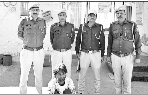
व्यापारी के बैग से रुपये चोरी करने के मामले में आरोपी को पकड़ा