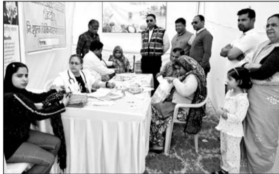
बीकानेर संभाग स्तरीय आरोग्य मेले में रोगियों का उपचार करते आयुर्वेद चिकित्सक।