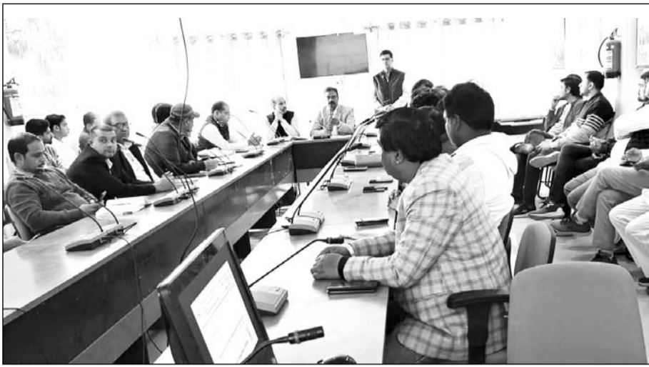
कृषि विभाग व कृषि और प्रसंस्कृत खाद्य उत्पाद निर्यात विकास प्राधिकरण (एपीडा) के संयुक्त तत्वाधान में आयोजित बैठक में मूंगफली निर्यात बढ़ाने की संभावनाओं पर चर्चा की।

भारत से 6.80 लाख मीट्रिक टन मूंगफली का निर्यात हो रहा है। देश में गुजरात के बाद राजस्थान मूंगफली उत्पादन में दूसरे स्थान पर है। बीकानेर में 3.30 लाख हेक्टेयर क्षेत्रफल में