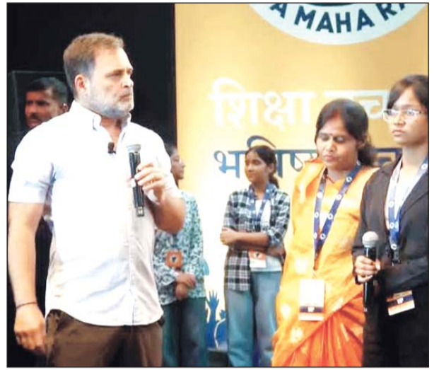
कांग्रेस के वरिष्ठ नेता राहुल गांधी ने कोटा के दशहरा मैदान से पेपर लीक मामले में छात्रों से संवाद अभियान की शुरुआत की है।

कोटा, 17 जून (निस)। कांग्रेस के वरिष्ठ नेता राहुल गांधी ने कोटा के दशहरा मैदान श्री राम रंगमंच से पेपर लीक मामले में छात्रों से संवाद अभियान की शुरुआत की है। इस अभियान में उनका पहला संवाद कार्यक्रम कोटा में आयोजित किया गया। ज्ञातव्य है कि कोटा मेडिकल और इंजीनियरिंग की प्रवेश परीक्षाओं की