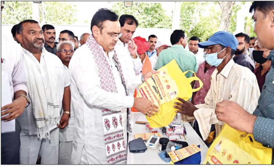
मुख्यमंत्री भजनलाल शर्मा ने बुधवार को उदयपुर में शहरी सेवा शिविर का अवलोकन किया। इस अवसर पर उन्होंने विभिन्न योजनाओं के लाभार्थियों को सहायता प्रदान की।

मुख्यमंत्री भजनलाल शर्मा ने आमजन से अपील की कि वे जरूरतमंद लोगों को शिविर में पहुँचाने में सहयोग करें, ताकि पात्र व्यक्ति को योजनाओं और सेवाओं का लाभ मिलना सुनिश्चित हो।