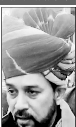
जोधपुर में प्रेस कॉन्फ्रेंस करते केंद्रीय मंत्री अनुराग ठाकुर।

जम्मू कश्मीर से कहा- जम्मू कश्मीर में एक करोड़ साठ लाख पर्यटक पिछले 9 माह में आए हैं, क्या राहुल उनका स्वागत करते हैं? जम्मू कश्मीर में पथभार की घटनाएं बंद हो गई हैं और आतंकवाद के खिलाफ कड़ी कार्रवाई की जा रही है, क्या राहुल इसका स्वागत करते हैं? केंद्रीय मंत्री अनुराग ठाकुर ने कहा कि गहलोट सरकार ने 4 साल आरोप-प्रत्यारोप में निराला दिए। उन्होंने पैपर लीक मामले में कहा कि गहलोट सरकार की ऐसी क्या मजबूरी है कि 8 बार पैपर लीक होता है और वे इसे रोक नहीं पा रहे। उन्होंने कहा कि इनके मंत्रियों के रिश्तेदार कंचे ओहदे पर पहुंच जाते हैं लेकिन राजस्थान का युवा हताश-निराश होकर आत्महत्या करता है। गहलोट सरकार को लेकर भी राज्यों में सहर्षण भरी थी, आगे की भी प्रक्रिया है। उन्होंने किसानों के कर्ज माफी का वादा किया था जो साढ़े चार साल में भी नहीं हुआ।