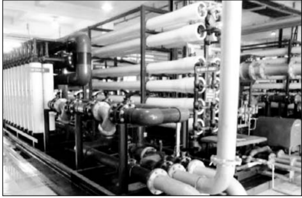
प्रदूषण से निजात दिलाने के लिए तैयार जेडएलडी प्लांट।

अब प्रदूषण को कंट्रोल करने के लिए पिछले 4 साल के संघर्ष के बाद जेड एलडी (जीरो डिग्री डिस्चार्ज) प्लांट