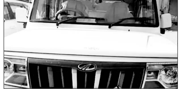
जयपुर की टीम ने तम्बाकू, सुपारी थोक विक्रेता के यहां छापामारी कार्रवाई की

हिण्डौन सिटी (कासं)। शहर में जीएसटी विभाग, जयपुर की टीम ने बुधवार को एक शहर के एक तम्बाकू, सुपारी उत्पाद के थोक विक्रेता कारोबार के प्रतिष्ठान पर छापामारी कार्रवाई की। विभाग की टीम ने सुबह 7 बजे से चली कार्रवाई में टीम के सदस्यों ने बयाना रोड स्थित टीकम कटरा स्थित