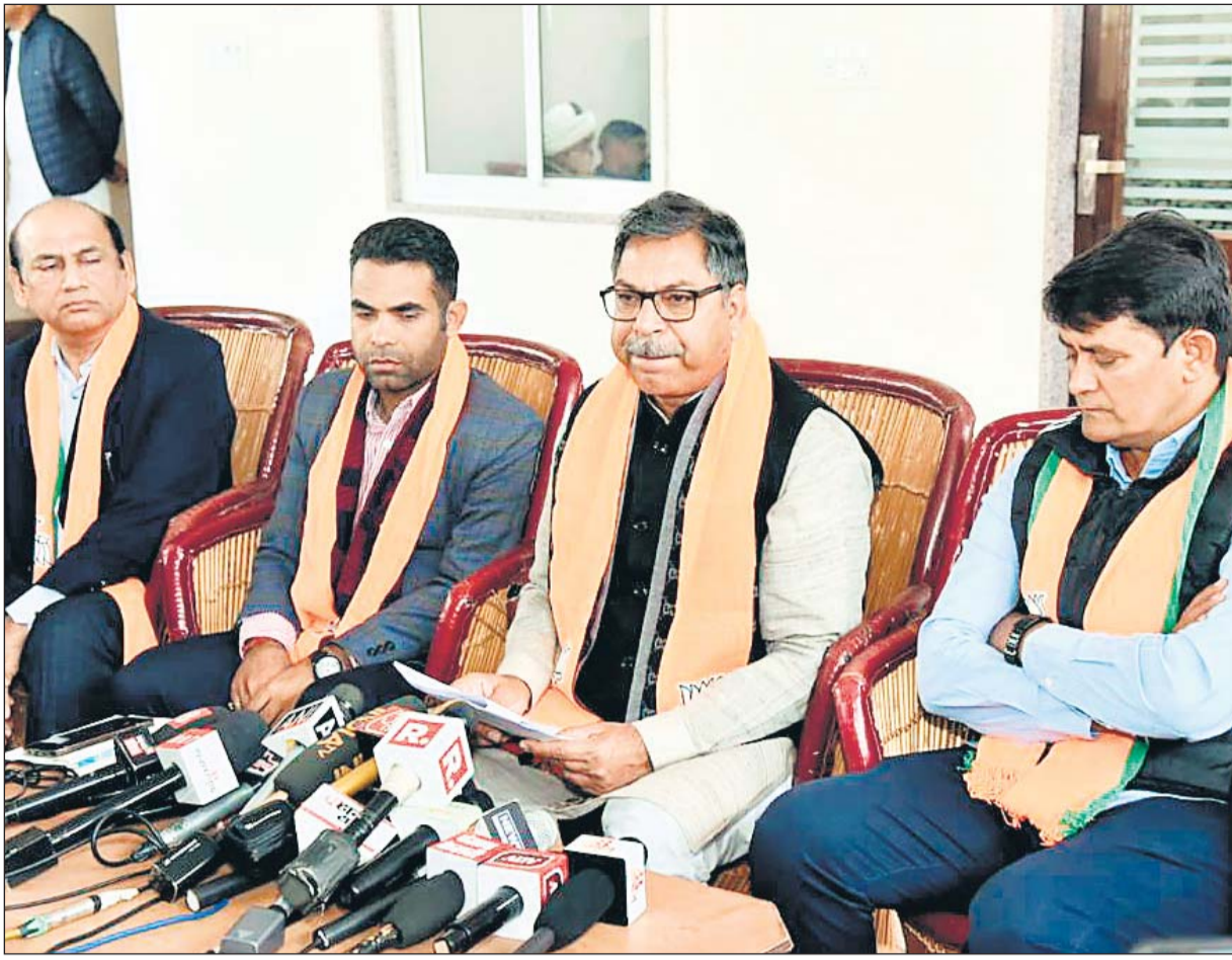
भाजपा प्रदेश अध्यक्ष डॉ. सतीश पूनिया ने जयपुर में प्रेस कॉन्फ्रेंस को संबोधित करते हुए कहा कि, मुख्यमंत्री अशोक गहलोत, रॉबर्ट वाड्रा द्वारा किये गये 125 बीघा जमीन घोटाले पर एक्शन कब लेंगे? पूनिया ने इस प्रकरण में गहलोत सरकार की सलिपता का भी आरोप लगाया और कहा कि, गहलोत सरकार इस प्रकरण पर पर्दा डालने में जुटी हुई है।