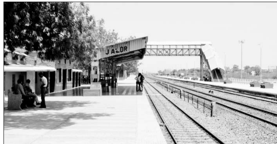
समदड़ी-भीलड़ी रेलखंड पर दिल्ली व जयपुर से जालोर नहीं जुड़ पाये से लोगों में मायूसी है।

ट्रेन संख्या 22421/22 सालासर एक्सप्रेस का विस्तार गांधी धाम तक संचालित है। जालोर जिले के लोगों की भारी मांग को देखते हुए अगर इस ट्रेन का विस्तार मारवाड़ भीममाल या रानीवाड़ा तक किया जाए तो लाखों लोगों को सुविधा मिलेगी। वर्तमान में इस ट्रेन को जोधपुर याई में जगह नहीं होने से जोधपुर के आगे