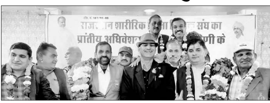
भरतपुर में राजस्थान शारीरिक शिक्षक संघ का प्रांतीय अधिवेशन सौनार हवेली में शुरू हुआ।