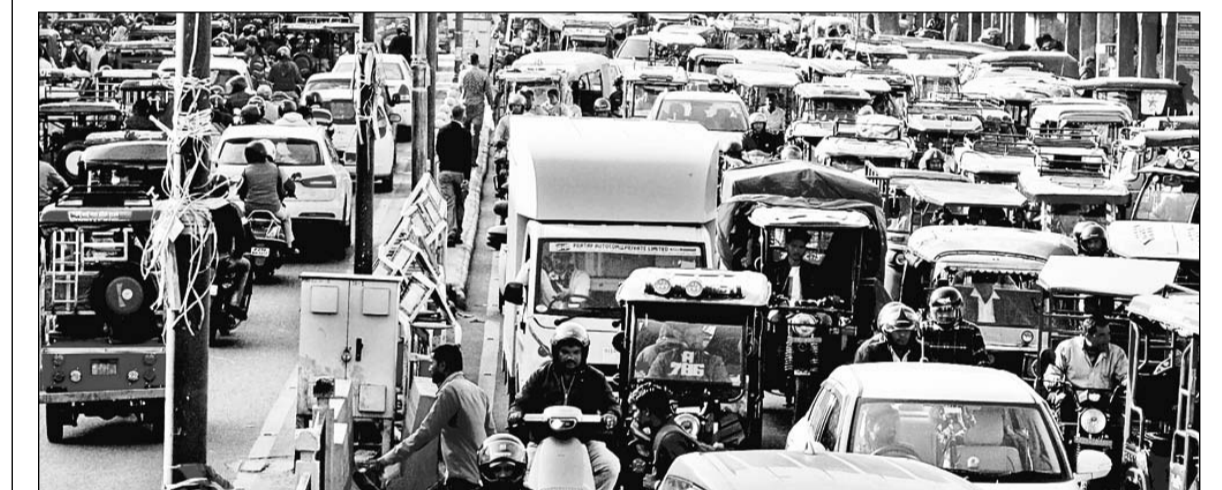
ई-रिक्शा के बेतरतीब परिवहन से शहर में दिन भर जाम लगने से वाहन रेंग-रेंग कर चल रहे हैं जिससे पर्यटकों के साथ-साथ आम जनता भी परेशान हो रही है लेकिन ई-रिक्शा के व्यवस्थित परिवहन को लेकर कोई कदम नहीं उठाया जा रहा।

सेण्डस्टोन व मैसनी स्टोन के कुल 64 प्लॉट्स डेलिभियेट कर ई-ऑक्शन 6 दिसंबर से 27 दिसंबर तक किये गये। इस ई-नीलामी में 61 प्लॉटों की रिजर्व प्राईस राशि 1.77 करोड़ रु. के विरुद्ध 49.26 करोड़ रु. की बोलियां प्राप्त हुईं, जो कि रिजर्व प्राईस से 27.83 गुणा अधिक है। माइनर मिनरल प्लॉट्स के ई-नीलामी से यह अब तक की सर्वाधिक बिड राशि है। उन्होंने बताया कि खनिज मैसनी स्टोन के प्लॉट संख्या 147 में रिजर्व प्राईस 1.50 लाख के विरुद्ध 2.42 करोड़ बोली प्राप्त हुई, जो 161.36 गुणा अधिक है जो सर्वाधिक है।