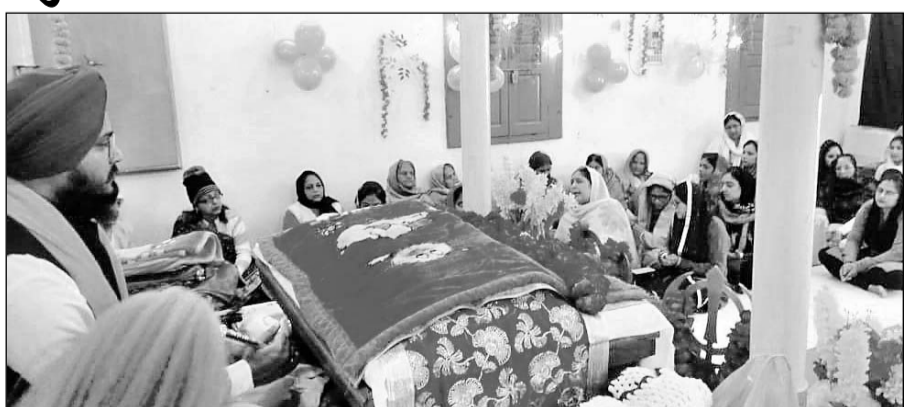
हिण्डौन सिटी में गुरु गोविंद सिंह जी का 554 वां प्रकाश पर्व सिख समाज की ओर से गुरुवार को मनाया।

हिण्डौन सिटी। गुरु गोविंद सिंह जी का 554वां प्रकाश पर्व हिंडौन में सिख समाज की ओर से गुरुवार को कई आयोजनों के साथ गुरु गोविंद सिंह का 554वां प्रकाश पर्व मनाया गया। इस मौके पर राजकीय जिला अस्पताल में भर्ती रोगियों और परिवारों को दूध और बिरक्ति वितरित किए गए। वही मोहन नगर स्थित जैन उपाध्याय में प्रोजेक्टर के माध्यम से गुरु गोविंद सिंह जी के चार साहिबजादे के बलिदान पर बनी डेहंट घंटे की मूवी भी दिखाई गई। फिल्म में मुगल