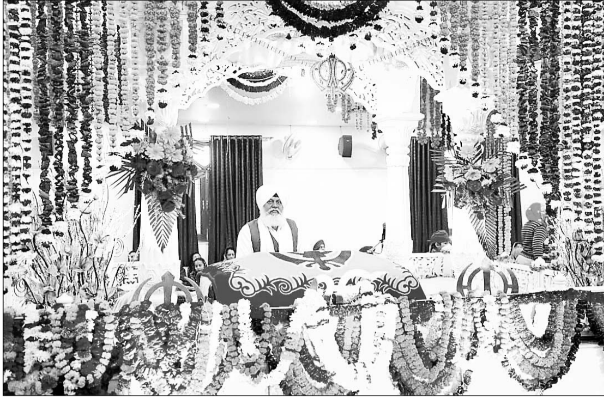
जयपुर के राजापार्क में सिखों के दसवें गुरु गुरु गोबिंद सिंह का 356वां प्रकाश पर्व गुरुवार को मनाया गया। सिख संगत ने अरदास की, सुबह दीवान सजाए गए। बाहर से आए रागी जत्थों ने शब्द कीर्तन से संगत को निहाल किया।