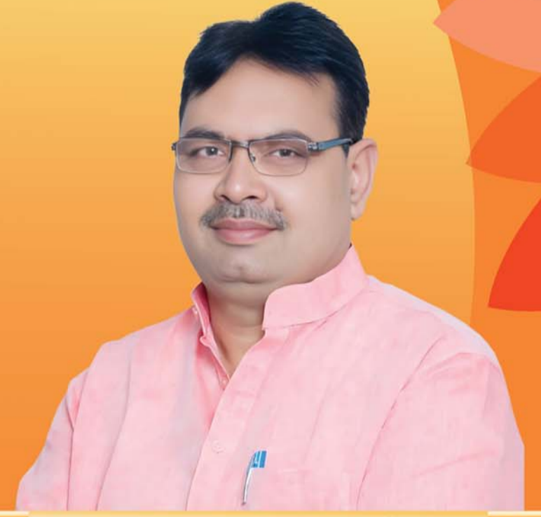
भजनलाल शर्मा माननीय मुख्यमंत्री, राजस्थान