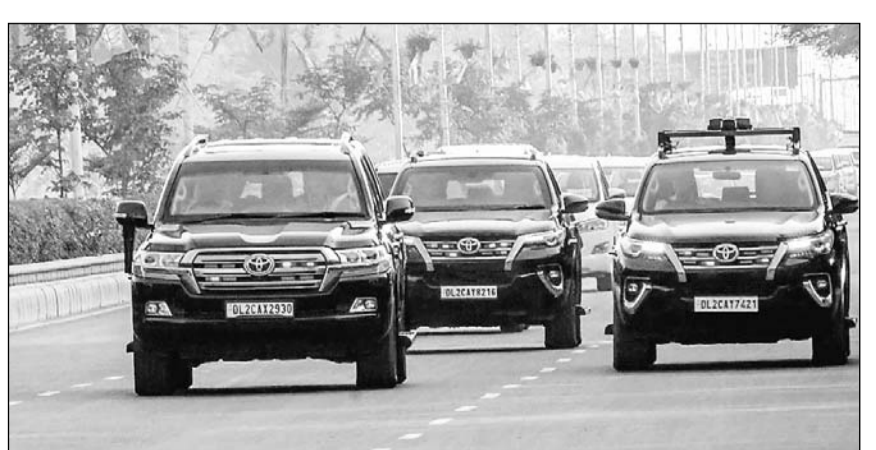
राजस्थान के मुख्यमंत्री भजनलाल शर्मा का शपथ ग्रहण समारोह शुक्रवार को रामनिवास बाग स्थित अल्बर्ट हॉल के सामने होगा। प्रधानमंत्री सहित अन्य वी.आई.पी. लोगों के आगमन को देखते हुए गुरुवार को जे.एल.एन. मार्ग पर पुलिस-प्रशासन ने रिहर्सल की।