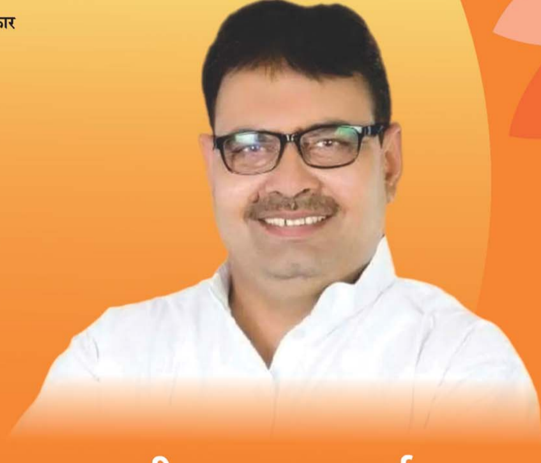
श्री भजनलाल शर्मा माननीय मुख्यमंत्री, राजस्थान