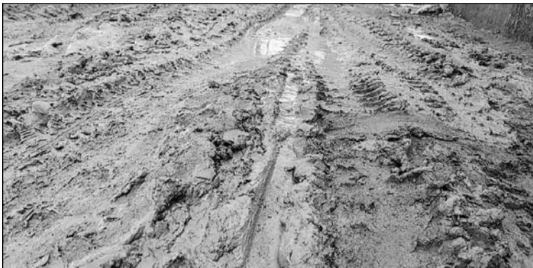
माण्डलगढ़ के कचोलिया गांव की सड़क कीचड़ व गड्डों में तब्दील हो चुकी है।