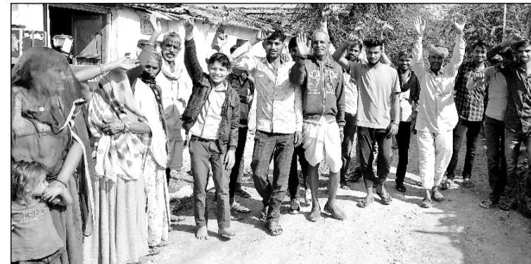
आक्रोशित ग्रामीणों ने लोक निर्माण विभाग के अधिकारियों के खिलाफ प्रदर्शन किया।

माण्डलगढ़, (निर्स)। माण्डलगढ़ के श्रीनगर ग्राम पंचायत के कचोलिया का झोपड़ा गांव में एक ऐसी तस्वीर निकल कर सामने आई जो शासन और प्रशासन की कार्यप्रणाली पर बड़ा सवाल खड़ा कर रही है। आज से दो दशक पहले सार्वजनिक निर्माण विभाग द्वारा बनाई गई सड़क जीर्णशीर्ण होकर कीचड़ में तब्दील हो चुकी है। गन्दगी और कीचड़ से सनी सड़क के दलदल में गुजरने को लोग मजबूर हैं। ग्रामीणों ने इस समस्या से निजात पाने के लिए