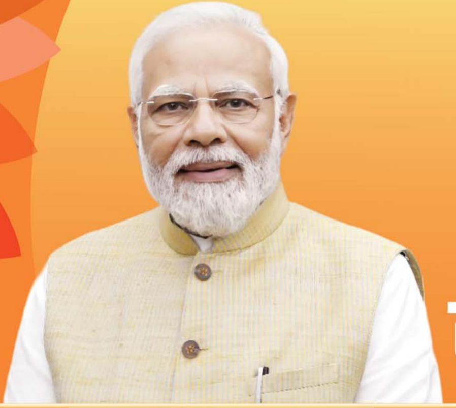
नरेन्द्र मोदी माननीय प्रधानमंत्री