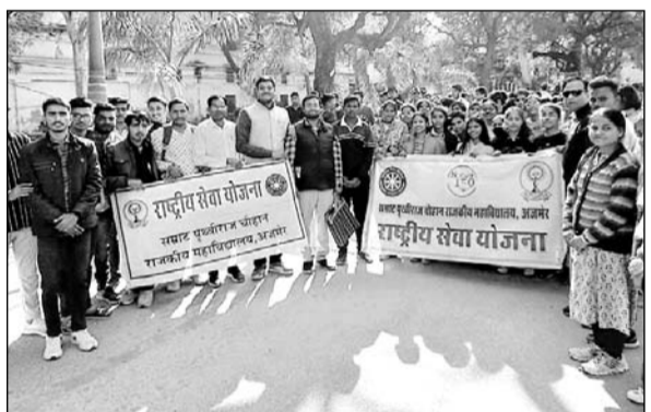
स्वच्छता का संदेश के लिए छात्र-छात्राओं ने रैली निकाली।