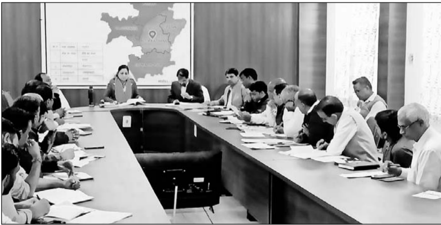
यात्रा को लेकर जिला कलेक्टर श्रुति भारद्वाज ने संबंधित अधिकारियों के साथ तैयारी बैठक ली।

इस संबंध में गुरुवार को जिला कलेक्टर श्रुति भारद्वाज ने संबंधित अधिकारियों के साथ तैयारी बैठक ली और अधिकारियों को दिशा निर्देश दिए। उन्होंने कहा कि संबंधित विभाग केम से पहले प्री केम लगाकर वहां अपने विभाग की योजनाओं के लाभांशित एवं पात्र व्यक्तियों को चिन्हित कर आवेदन कन्वाने संबंधित प्रक्रिया पूर्ण कर लेवें। उन्होंने कृषि विभाग के अधिकारियों से कहा कि वे कृषि विभाग की स्टॉल पर सारी व्यवस्थाएं रखें, ताकि ज्यादा से ज्यादा कृषक