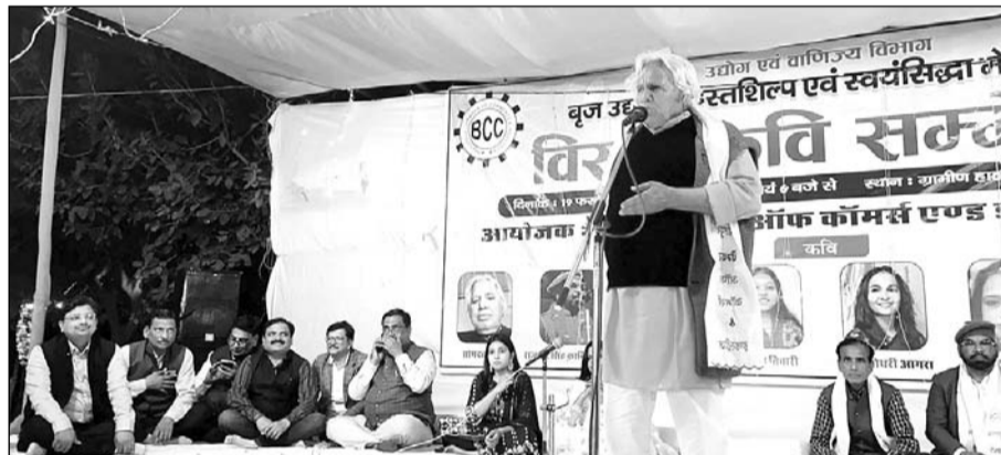
भरतपुर के हाट कम्पनी बाग में चल रहे ब्रज उद्योग-हस्तशिल्प मेले में कवियों ने अपनी कविताएं प्रस्तुत की।