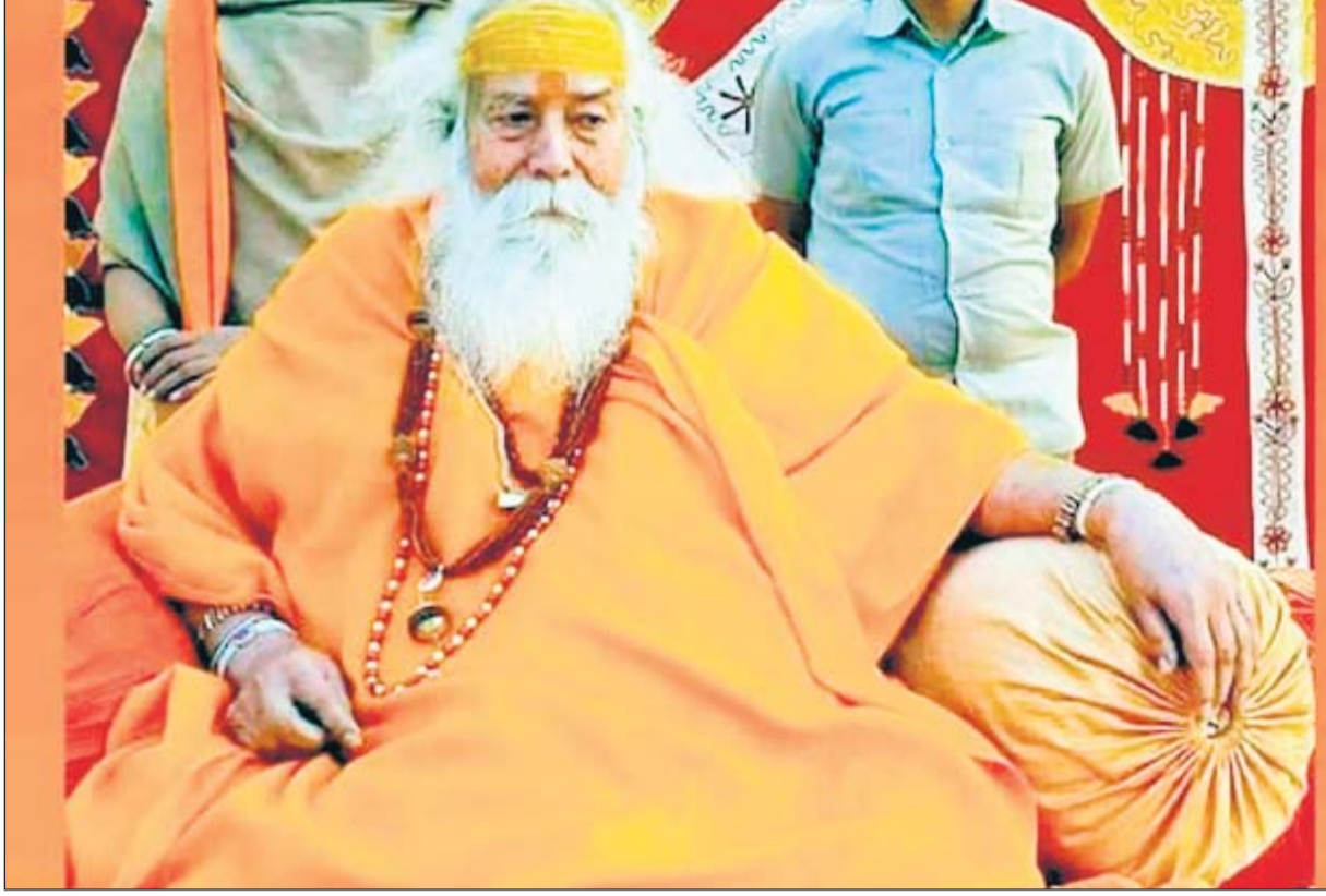
द्वारका शारदा पीठ के शंकराचार्य स्वरूपानंद सरस्वती का रविवार को 99 साल की उम्र में निधन हो गया, वे लंबे समय से बीमार चल रहे थे। मध्य प्रदेश के नरसिंहपुर में उनका निधन हुआ। जानकारी के मुताबिक, उन्होंने अपने आश्रम में दोपहर 3 बजे के करीब अंतिम सांस ली। साल 1989 में उन्हें शंकराचार्य की उपाधि मिली थी। स्वरूपानंद सरस्वती हिंदुओं के सबसे बड़े धर्मगुरु थे। राम मंदिर के लिए भी उन्होंने लंबी लड़ाई लड़ी।