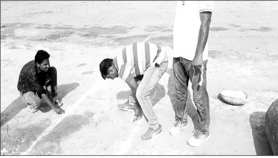
बीकानेर में रविवार को राजीव गांधी ग्रामीण ब्लॉक स्तरीय ओलंपिक खेल प्रतियोगिता की तैयारियों को अंतिम रूप दिया।

जिला कलेक्टर ने बताया कि सभी ब्लॉक क्षेत्रों में खेल स्पर्धाओं का शेड्यूल निर्धारित कर दिया गया है। मैदानों का चिह्निकरण एवं समतलीकरण, रैफरियों की नियुक्ति, खेल सामग्री का चयन सहित सभी