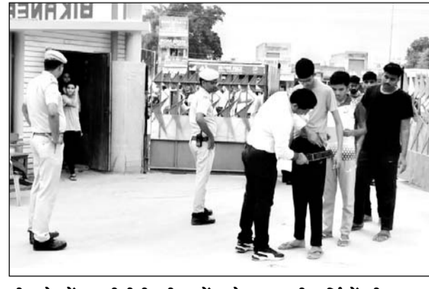
बीकानेर में आरपीवीटी परीक्षा सेंटर के बाहर परीक्षार्थियों की गहनता से जांच कर प्रवेश दिया।