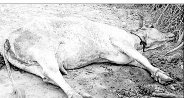
उनियारा उपखण्ड क्षेत्र में लम्पी बीमारी ने घेर पसारने शुरू कर दिए।

उनियारा/चौरू, (निर्स)। टोंक जिले उनियारा उपखंड के चौरू ग्राम पंचायत क्षेत्र में पशुपालन विभाग एवं प्रशासन द्वारा उचित प्रबंध नहीं किए जाने से क्षेत्र में गोवंश में फैली लम्पी स्किन संक्रामक रोग गोवंश में दिनों दिन बढ़ता जा रहा है, और देखते ही देखते इस महामारी ने गोवंश में भयंकर रूप धारण कर लिया है। अब तक करीब 1 दर्जन से अधिक गाय इसका शिकार होकर मौत के आगोश में समा चुकी है। इस रोग से संक्रमित गायों को ग्राम गो सेवा दल द्वारा ग्राम पंचायत भवन के पुराने भवन में क्वारंटिन कर रखा था। कुछ दिनों पूर्व किसी ग्रामीण द्वारा क्वारंटिन गायों को पंचायत भवन के बाहर निकाल दिया।