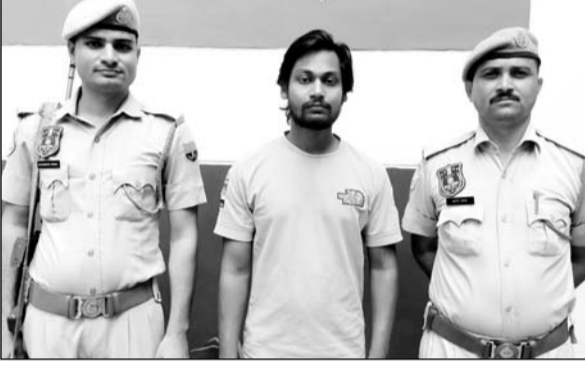
करधनी थाना पुलिस ने स्मैक तस्कर को गिरफ्तार किया।