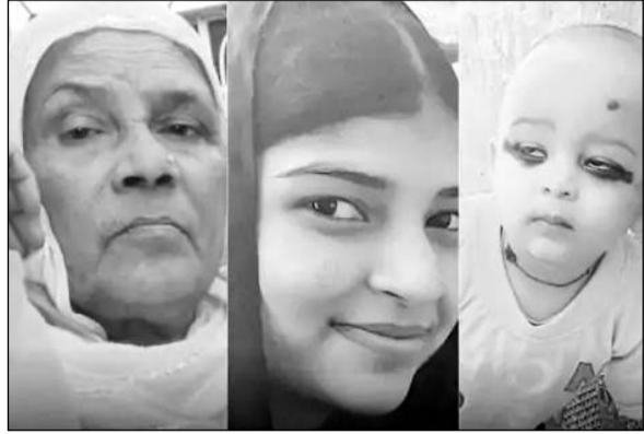
मृतकों की फाइल फोटो।

गंगापुर सिटी, (निर्स)। बस की टक्कर से बाइक सवार एक ही परिवार के तीन लोगों की मौत हो गई। हादसे में सास-बहू और एक मासूम ने मौके पर ही दम तोड़ दिया। वहीं, बाइक चला रहा परिवार का मुखिया गंभीर रूप से घायल हो गया। हादसे के बाद बस सहित बस ड्राइवर फरार हो गया।