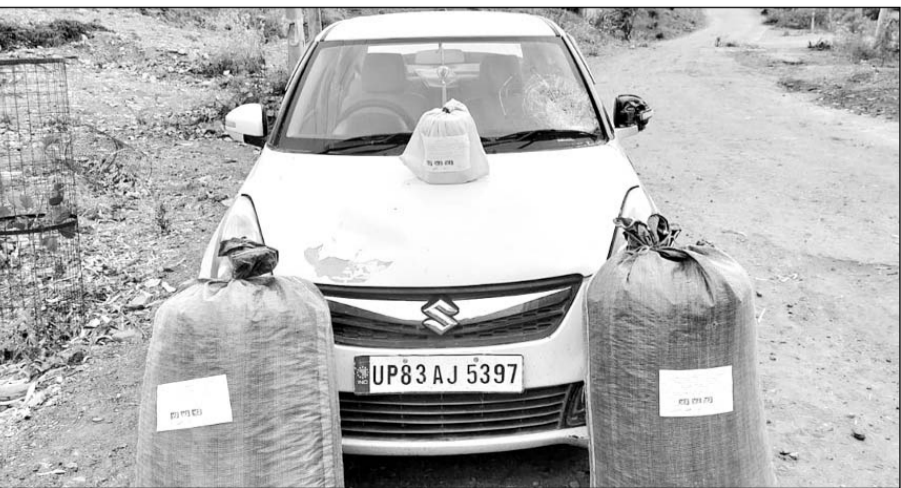
ग्रामीण पुलिस की विशेष टीम व मंडाना पुलिस टीम ने कार व अवैध मादक पदार्थ जब्त किया।