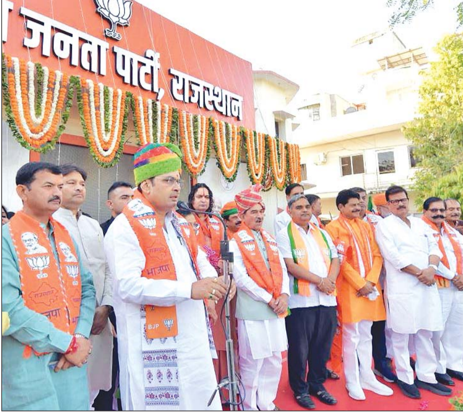
मुख्यमंत्री भजनलाल शर्मा ने सोमवार को भाजपा के स्थापना दिवस पर प्रदेश मुख्यालय पर आयोजित कार्यक्रम को संबोधित किया। इस अवसर भाजपा प्रदेश अध्यक्ष मदन राठौड़, पूर्व मुख्यमंत्री वसुन्धरा राजे व वरिष्ठ नेता मौजूद थे।

वसुन्धरा राजे ने अपने संबोधन में कहा कि भाजपा का 46 वर्षों का सफर संघर्ष, निष्ठा और विचारधारा के प्रति समर्पण का परिणाम है। उन्होंने स्पष्ट कहा कि राजनीतिक नियुक्तियों और महत्वपूर्ण दायित्व केवल उन्हीं कार्यकर्ताओं को