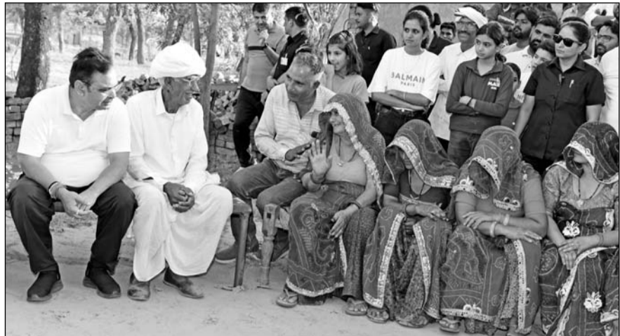
सीकर के जाजोद गांव में मुख्यमंत्री भजनलाल शर्मा ने घरों में जाकर लोगों से मुलाकात की।

सीकर/जयपुर। सीकर के जाजोद गांव में गुरुवार को देर तक रात्रि चौपाल लगाने के बाद मुख्यमंत्री भजनलाल शर्मा शुकुवार को सूरज निकलते ही फिर लोगों के बीच पहुंच गए। लोग घरों से निकले तो उन्होंने सड़क पर मुख्यमंत्री को गांव में टहलते हुए पाया। गांव की गलियों में सहजता के साथ भ्रमण करते हुए मुख्यमंत्री ने बुजुर्गों, महिलाओं, किसानों, पशुपालकों, फल एवं सब्जी विक्रेताओं तथा युवाओं से संवाद किया और राज्य सरकार की जनकल्याणकारी योजनाओं के क्रियान्वयन का फीडबैक लिया। मुख्यमंत्री ने इस दौरान गांव में स्थित श्री गोपीनाथ जी मंदिर एवं शिव मंदिर में दर्शन कर प्रदेशवासियों को सुख-समृद्धि और खुशहाली की कामना की।