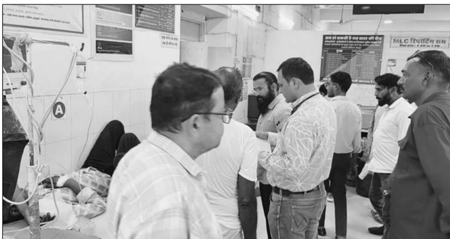
लोगों की तबीयत बिगड़ने पर उन्हें अस्पताल में भर्ती कर चिकित्सकों ने उपचार शुरू किया।

खाने के बाद अचानक लोगों की तबीयत बिगड़ने लगी। देखते ही देखते बच्चों, महिलाओं और बुजुर्गों को उल्टी-दस्त की शिकायत होने लगी, जिससे समारोह स्थल पर हड़कंध मच गया। स्थिति गंभीर होने पर परिजनों ने तुरंत मरीजों को अतेला सीएसजी और बाद में शाहपुरा राजकीय उपजिला चिकित्सालय पहुंचाया, जहां एक साथ बड़ी संख्या में मरीज आने से अस्पताल के वार्ड भर गए। जानकारी के अनुसार करीब 50