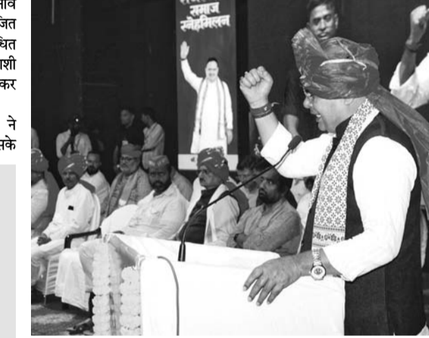
मुख्यमंत्री भजनलाल शर्मा ने शुक्रवार को महाराष्ट्र विधानसभा चुनाव के तहत पुणे के भोसरी में आयोजित राजस्थानी समाज सम्मेलन को संबोधित किया।