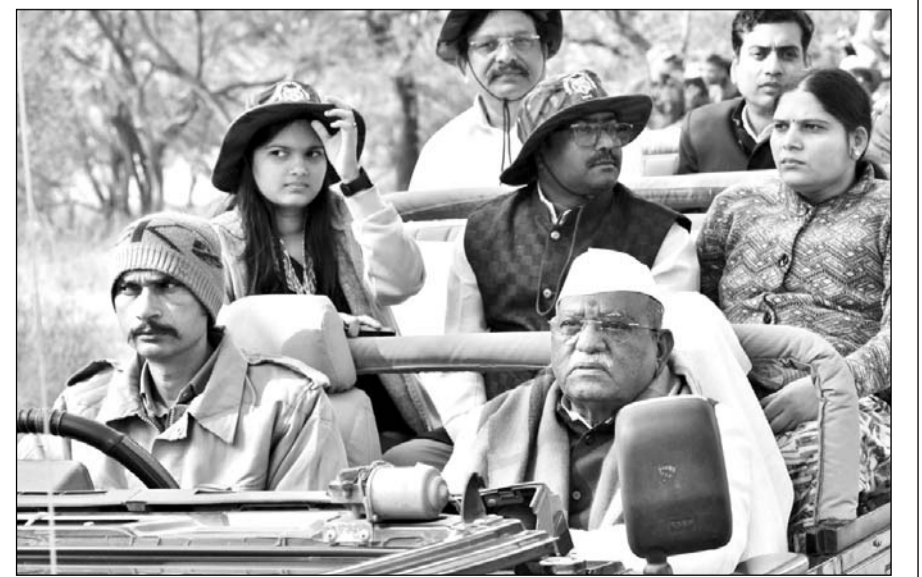
राज्यपाल हरिभाऊ बागड़े ने सपरिवार रणथम्भौर टाइगर रिजर्व का भ्रमण किया।

बाघों की अठखेलियां देख आनंदित हुए राज्यपाल हरिभाऊ बागड़े