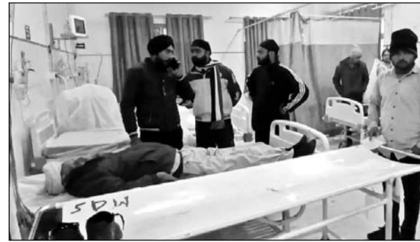
घायल पर्यटकों को अस्पताल में भर्ती कराया।

भरतपुर, (निर्स)। केवलादेव नेशनल पार्क घूमकर आ रहे पर्यटकों का ई-रिक्शा पलटा गया। घटना में ई-रिक्शा चालक की मौत हो गई। वहीं तीन पर्यटक घायल हो गए। सभी को नेशनल पार्क की गाड़ी से आरबीएम अस्पताल पहुंचाया गया। घटना ई-रिक्शा के आगे दो चीतल आने की वजह से हुई।