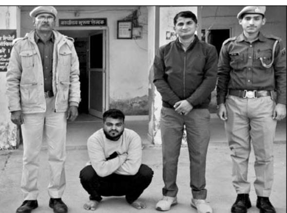
पुलिस ने गबन के मामले में फरार आरोपी को गिरफ्तार किया।