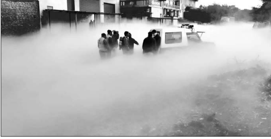
राजधानी जयपुर के विश्वकर्मा इंडस्ट्रियल एरिया में मंगलवार को ऑक्सीजन प्लांट में टैंकर का बॉल्व टूटने से हडकंप मच गया।

गौरतलब है कि करीब 11 दिन पहले 20 दिसंबर को जयपुर-अजमेर एक्सप्रेस हाईवे पर गैस टैंकर से निकली एलपीजी के कारण ब्लास्ट हो गया था। इस हादसे में 20 लोगों की जान जा चुकी है। मंगलवार को जैसे ही वी.के.आई. में गैस लीकेज हुई तो लोगों के जेहन में वह दृश्य ताजा हो गया। इसी कारण प्लांट के आसपास के लोग गैस लीक होने से डर गए। अक्सिस्टेंट फायर ऑफिसर