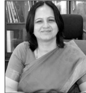
आई.ए.एस. मंजू राजपाल।