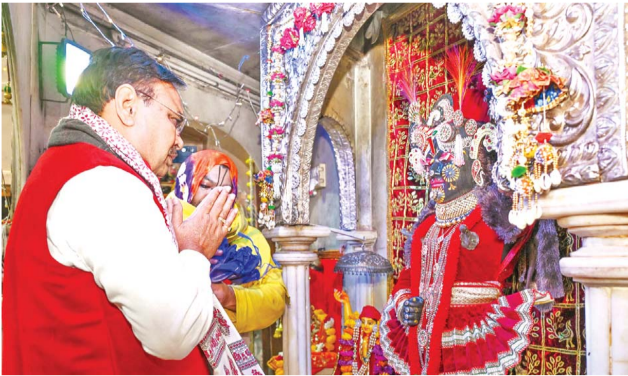
मुख्यमंत्री भजनलाल शर्मा ने नववर्ष की पूर्व संध्या पर डींग जिले के पूंछरी का लौठा के श्रीनाथ जी मंदिर में पूजा की और प्रदेश की खुशहाली की कामना की। इससे पहले वे मेहदीपुर बालाजी भी गए जहां उन्होंने पूजा अर्चना की। सूत्रों ने बताया कि मुख्यमंत्री नववर्ष के प्रथम दिन पूंछरी का लौठा धाम में गिराज महाराज के भी दर्शन करेंगे तथा विशेष पूजा कार्यक्रम में शामिल होंगे।