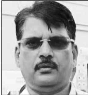
आई.ए.एस. भास्कर ए. सावंत।