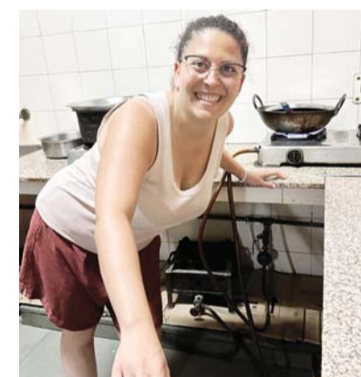
Guests from Italy cooking spaghetti al pomodoro in the courtyard at Jaipur Inn, Jaipur.