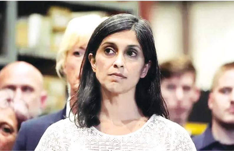
Usha Vance, Second Lady of the US.

life in the United States. The unease is not entirely unfounded. In recent years, even some of the most prominent Indian-origin figures in American politics have found themselves targets of racial attacks. Kash Patel, one of the most influential Indian Americans in the Trump administration, has frequently been subjected to racist abuse online. Former South Carolina governor Nikki Haley has long faced taunts about her Indian heritage and birth name, while Usha Vance, the wife of Vice President JD Vance, has been the target of xenophobic commentary on social media. Their prominence may have brought them national visibility, but it has not shielded them from questions about identity and belonging that many Indian Americans know all too well.