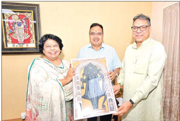
राज्यसभा के उम्मीदवार घोषित होने के बाद डॉ. सतीश पूनिया एवं डॉ. अलका गुर्जर ने गुरुवार देर शाम मुख्यमंत्री भजनलाल शर्मा से उनके निवास पर शिष्टाचार भेंट की।

जयपुर। राज्यसभा चुनाव को लेकर भाजपा ने राजस्थान के दो उम्मीदवारों के नाम घोषित कर राजनीतिक हलकों में नई चर्चा छेड़ दी है। पार्टी ने पूर्व प्रदेशाध्यक्ष सतीश पूनियां और भाजपा की राष्ट्रीय सचिव अलका गुर्जर को उम्मीदवार बनाया है। यह फैसला केवल राज्यसभा सीटों तक सीमित नहीं माना जा रहा, बल्कि इसे प्रदेश की दो प्रभावशाली जातियों जाट और गुर्जर समाज को साधने की रणनीति के रूप में देखा जा रहा है। गुरुवार देर शाम डॉ. सतीश पूनिया एवं डॉ. अलका गुर्जर ने मुख्यमंत्री भजनलाल शर्मा से उनके निवास पर शिष्टाचार भेंट की। इस अवसर पर मुख्यमंत्री ने दोनों नेताओं को राज्यसभा के लिए प्रत्याशी बनाए जाने पर मिठाई खिलाकर हार्दिक बधाई एवं शुभकामनाएं दीं। मुख्यमंत्री ने कहा कि दोनों नेताओं का व्यापक संगठनात्मक अनुभव, जनसेवा के प्रति समर्पण और राष्ट्रियता के प्रति प्रतिबद्धता संसद में राजस्थान एवं देश की आकांक्षाओं को सशक्त अभिव्यक्ति प्रदान करेगी। इस अवसर पर संसदीय कार्य मंत्री जोगाराम पटेल उपस्थित रहे।