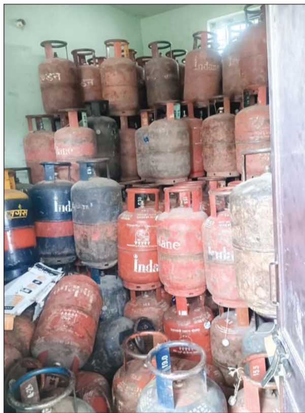
की गई कार्रवाई में कुल 302 घरेलू एवं व्यावसायिक गैस सिलेंडर तथा दो पिकअप वाहन (आरजे-14-जीआर-7835 और आरजे-14-जीएच-5920) जब्त किए गए। मामले में सिलेन दो व्यक्तियों के खिलाफ संबंधित पुलिस थानों में एफआईआर दर्ज कराने की कार्रवाई की जा रही है।