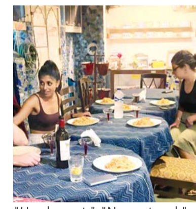
"Hands meet." "Names travel." "Pages remember."