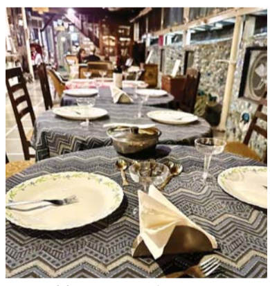
One table, one evening, many homes.