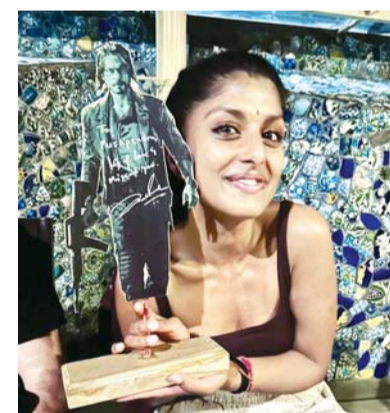
Kuch kuch hota hai.