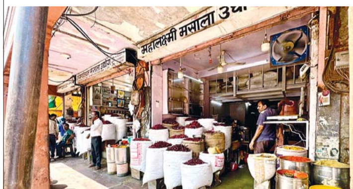
Chandpole Bazaar, Spices, Cumin, Coriander, Mirchi and Cardamom.

...Since then, I ask unassuming guests the same question: "Would you cook one dish from where you come from?" Most say yes