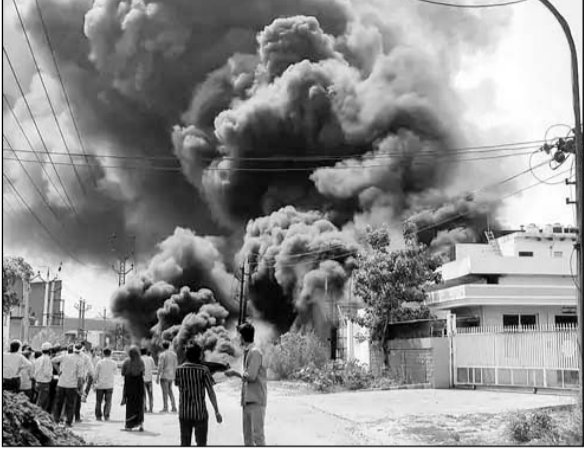
भिवाड़ी के यूआईटी औद्योगिक क्षेत्र में फैक्ट्रियों में लगी आग के बाद मौके पर लोग जमा हो गये।

जानकारी के अनुसार रामको मेटल कंपनी के ऊपर रखे ऑयल टैंकर में ब्लॉस्ट हुआ और आग लग गई। टैंकर से निकला ऑयल ब्लॉस्ट के साथ अलशोक एलएलपी कंपनी में फैल गया। जिससे इस कंपनी में भी आग लग गई। अलशोक कंपनी के कर्मचारी ने बताया कि आग की शुरुआत पड़ोस की कंपनी की छत पर रखे एक ऑयल टैंकर से हुई। इसके बाद आग अलशोक एलएलपी में फैल गई। आग लगने के समय कंपनी के