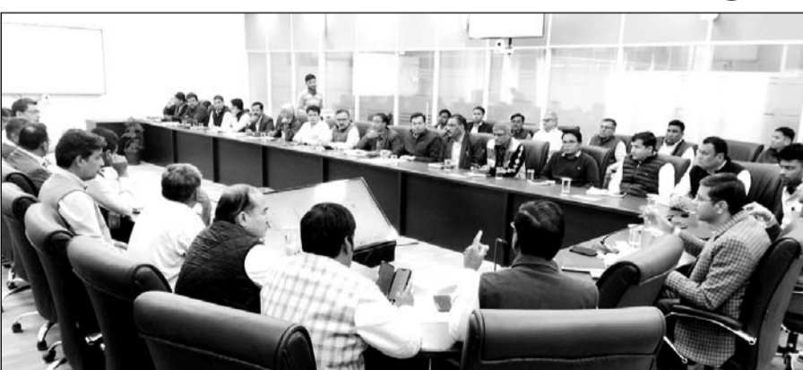
मुख्यमंत्री भजनलाल शर्मा के बालोतरा दौरे को लेकर जिला कलैक्टर ने अधिकारियों की बैठक ली।

बालोतरा, (नि.सं)। मुख्यमंत्री भजनलाल शर्मा के 10 जनवरी को बालोतरा क्षेत्र के प्रस्तावित दौरे को लेकर पूर्व तैयारियों को अंतिम रूप दिया जा रहा है। सी.पी.ओ. को लेकर बुधवार को रिफाइन्दी शीटिंग हॉल में जिला कलैक्टर सुशील कुमार यादव की अध्यक्षता में पूर्व तैयारियों की समीक्षा बैठक आयोजित की गई।