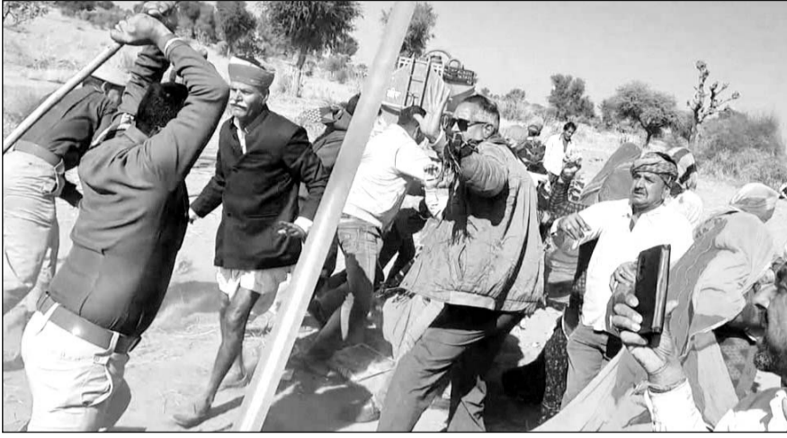
सरासनी गांव में जमीन अधिग्रहण की कार्रवाई के दौरान ग्रामीणों के विरोध करने पर पुलिस ने भीड़ को खदेड़ने के लिए हल्का बल प्रयोग किया।

जानकारी के मुताबिक जमीन अधिग्रहण की कार्रवाई के विरोध में किसान 134 दिन से धरना दे रहे थे। इस बीच बुधवार को निजी कंपनी की ओर से हरिमा, सरासनी आदि गांव में जमीन अधिग्रहण की कार्रवाई की जा रही थी। इस बीच धरने पर बैठे ग्रामीणों का विरोध बढ़ गया। ग्रामीणों ने पुलिस पर पथराव कर दिया तो पुलिस ने भी